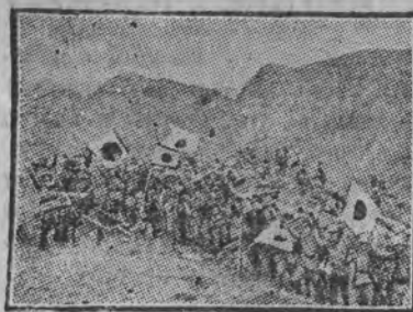
ODDZIAŁ JAPONSKI POD CZANG KU FENG.

Wiadomość o ugodzie osiągniętej pomiędzy Litwinowem a Szigemitsu wywarła duże wrażenie na giełdzie w Tokio. Większość papierów natychmiast zwyżkowała i już w pierwszych godzinach po otwarciu giełdy notowana była od 2 do 5 punktów wyżej niż wczoraj z dalszą tendencją zwyżkową.