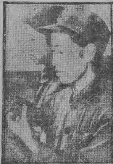
KOBIETY W ARMII CHIŃSKIEJ

Wszystkie warstwy Chin walczą solidarnie z najeźdźcą