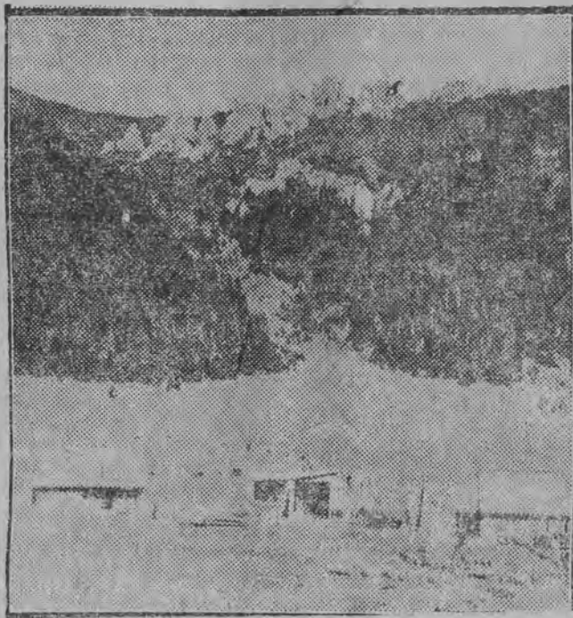
Baraki obozu w Dolinie Chocholowskiej. W głębi miejsce, które było przeznaczone na start, otoczone dźwigarkiem.

a już za parę dni rozpoczyna się ciągnięcie 43 Lot. Kl. Pozostała, niewielka ilość losów sprzedaje znana ze szczęścia kolektura d. f. „ELEKTR“ Warszawa Nowy-Swiat 60 (róg Ordynackiej) tel. 34-04.