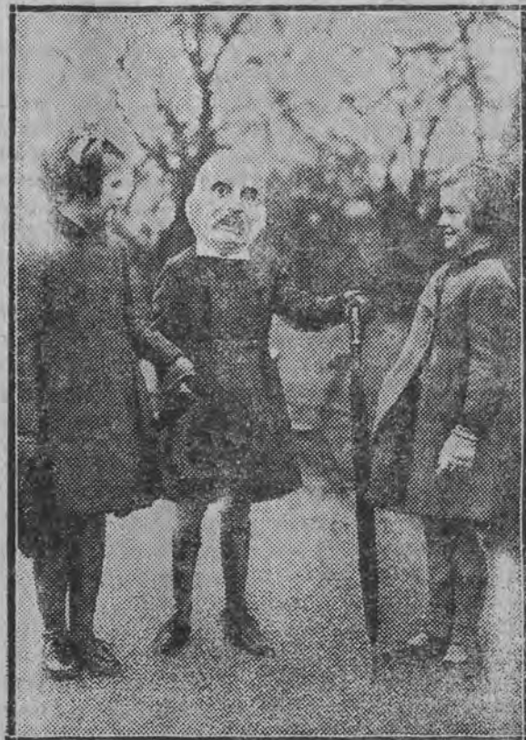
ZABAWY ANGIELSKICH DZIECI SZKOLNYCH W CHAMBERLAINA, DZIEWCZYNIKA (NA ŚRODKU) W MASCE PREMIERA ANGLII.

Prawie równocześnie ukazały się na rynku anglo-amerykańskim dwie książki o dwóch premierach W. Brytanii. „Bohater czy oszukany?” — oto tytuł książki o Neville Chamberlainie, pióra Sir Charlesa Petrie, która ukazała się nakładem firmy wydawniczej „Stokes”. Jest ona biografią premiera Anglii, bohatera traktatu monachijskiego, ze szczególnym uwzględnieniem tradycji rodu Chamberlainów — „Starego Joe” — ojca i sir Austena — brata.