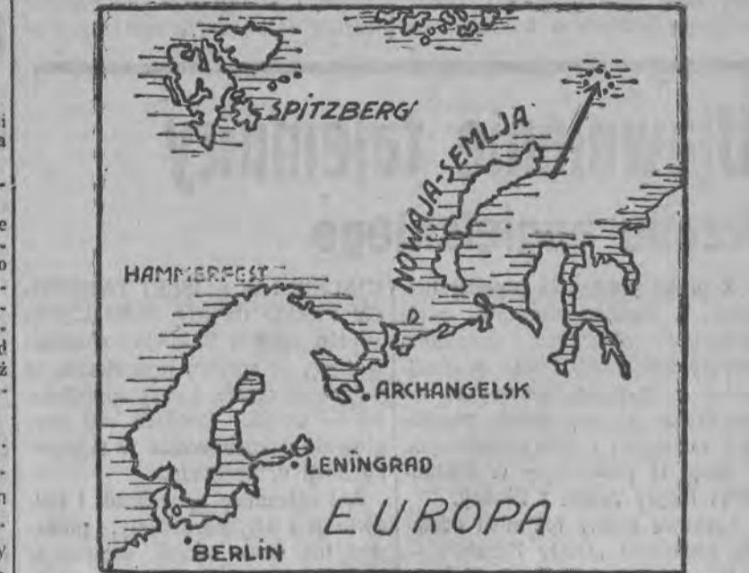
MAPA POLARNYCH OKOLIC, GDZIE POWSTANĄ SOWIECKIE BAZY MORSKIE.