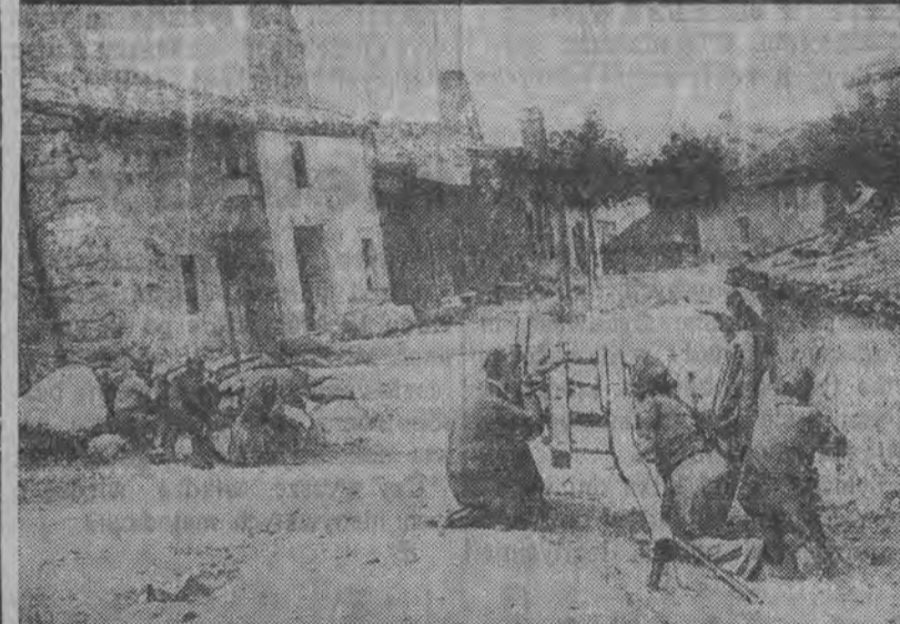
POSTERUNEK MILICJI BASKIJSKIEJ OSTRZELIWIJE POZYCJĘ FASZYSTÓW W JEDNEJ Z WIOSEK.

Specjalny korespondent agencji Havasa donosi, że fatalna pogoda panująca od dwóch dni na froncie baskijskim, w szczególności na odcinku Urqujola, utrudnia bardzo operacje wojskowe. Doliny są tak rozmokłe, że transporty wojskowe z trudnością mogą się posuwać naprzód. Silny wiatr uniemożliwia wszelką akcję lotnictwa. Wojska rządowe wykorzystują czas na umocnienie swoich pozycji. Silne fortyfikacje budowane są niedaleko od przedmieść Bilbao. Komunikat Komitetu Obrony Bilbao donosi: Na froncie Guipozcoa na odcinku Lequitia artyleria wojsk rządowych nie dopuściła do koncentracji oddziałów powstańczych, które poniosły ciężkie straty. Na odcinku Eibar samoloty rządowe dokonywały w ciągu dnia lotów rozpoznawczych, zaś artyleria ostrzeliwała intensywnie pozycje powstańców. Na odcinku Orueda obustronna wymiana strzałów. Na froncie Alava w następstwie ataku wojsk rządowych powstańcy stracili 50 zabitych i wielu rannych. Po otrzymaniu znaczniejszych posiłków powstańcy usiłowali przepro-