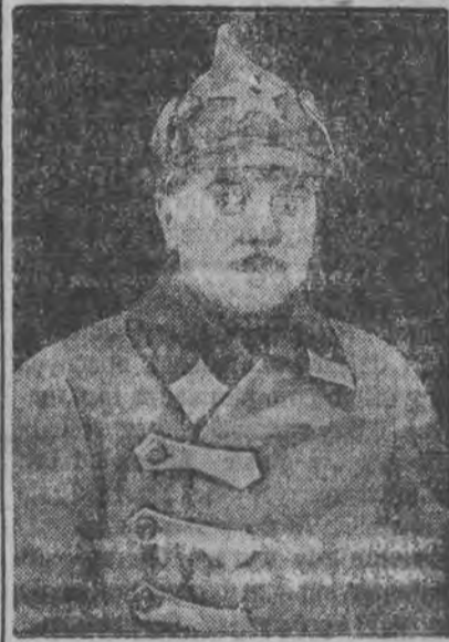
MARSZ. WOROSZYŁOW, KOMISARZ WOJNY Z. S. S. R.

cznym. Gdy rozszerzony będzie kanał, łączący jezioro Onegę z Nową, umożliwiony będzie przejazd krążowników z Bałtyku do