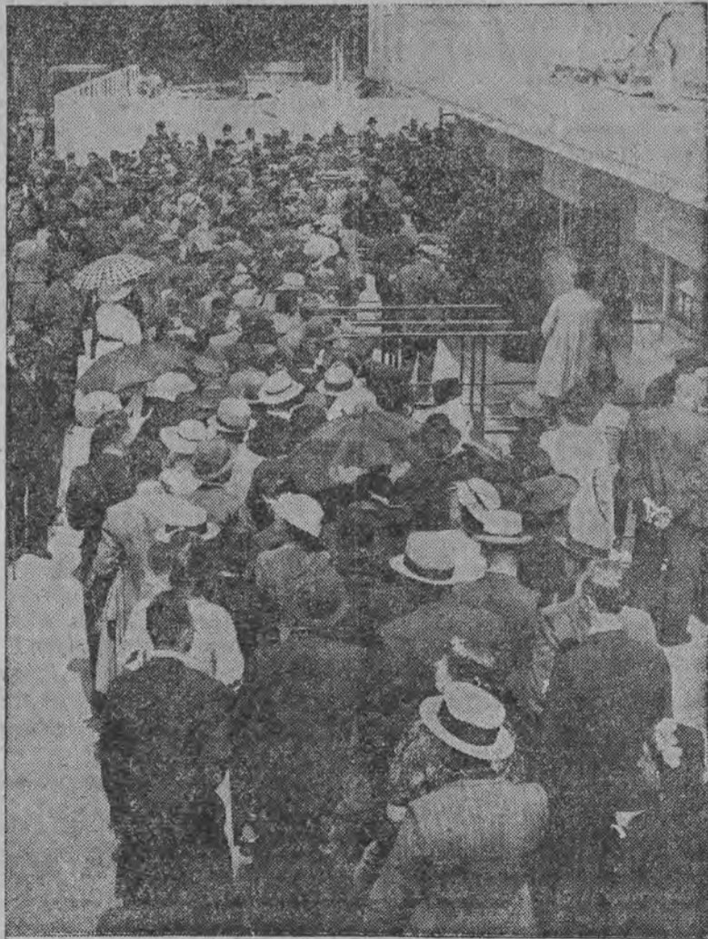
W ubiegłą niedzielę, zgórą stutysięczny tłum odwiedził Wystawę. Zdjęcie nasze przedstawia jedną z pierwszych grup, zwiedzających Wystawę.