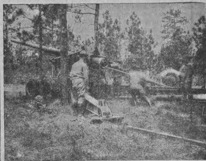
Fragment ćwiczeń amerykańskiej artylerii przeciwlotniczej.