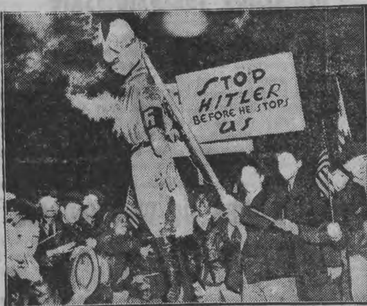
W Filadelfii odbyły się wielkie demonstracje antyhitlerowskie. Kulminacyjnym punktem demonstracji było spalenie kukły w mundurze hitlerowskiego szturmowca.