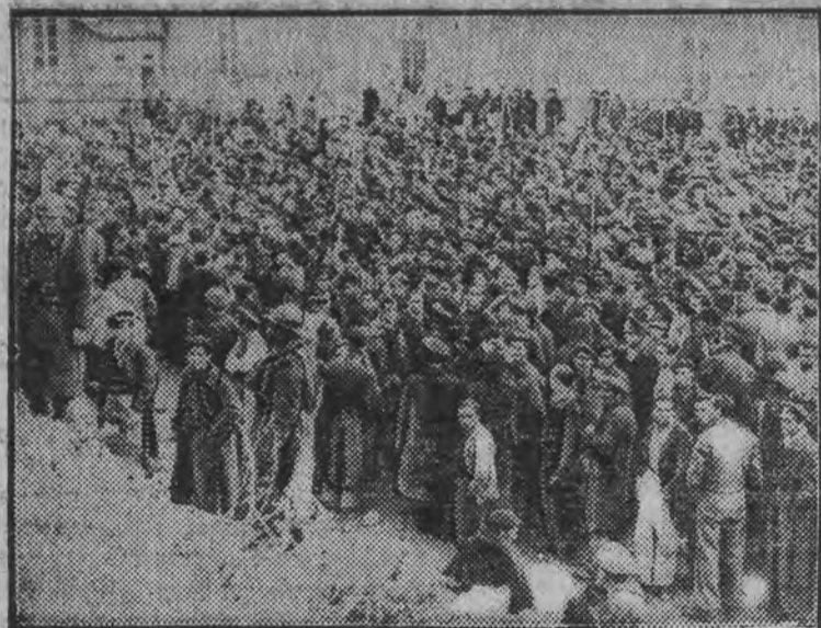
DZIESIĄTKI TYSIĘCY UCHODZCÓW HISZPAŃSKICH NA GRANICY FRANCUSKIEJ

Puigcerda. Agencja Havasa donosi, że wojska gen. Franco weszły do miasta