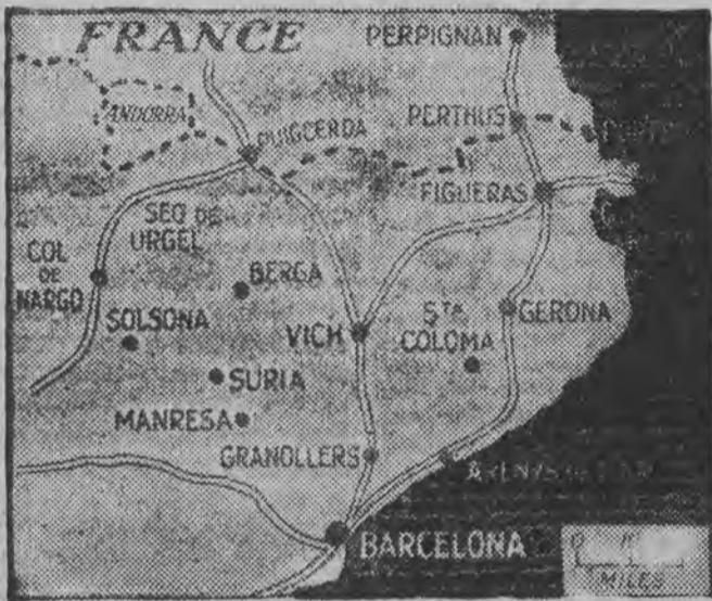
POGRANICZE KATALONSKO - FRANCUSKIE

W Brytanii znacznie skorzystałaby — kończy korespondent — na realizacji planów federacji panarabskiej z Egiptem na czele, tym bardziej, że więzy jej z Egiptem są znacznie bliższe, niż z innymi państwami Bliskiego Wschodu.