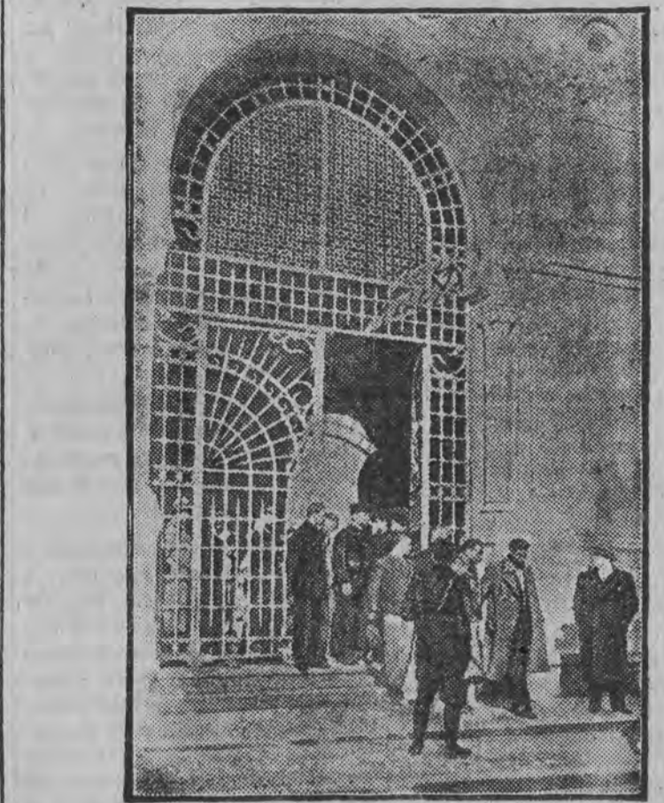
PALAC GUBERNATORA W TUNISIE

C. K. P. stwierdziła, że rok miniony był pełen niepokojów i gróźb wojennych oraz że przyniósł dalsze wzmocnienie pozycji Rzeczypospolitej w świecie.