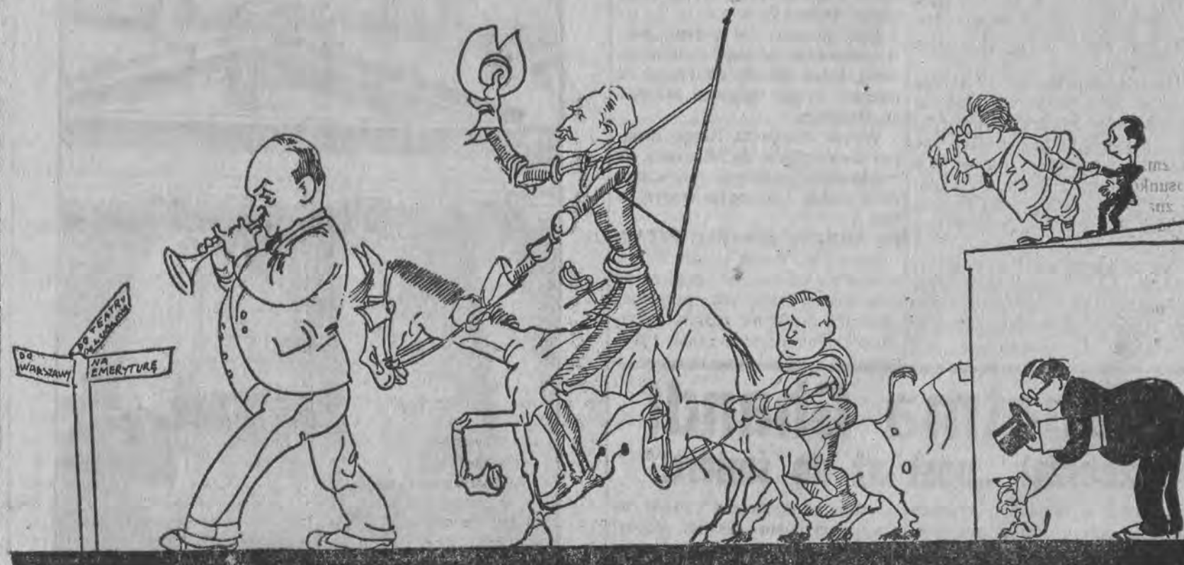
Mile komisarycznych rządów poczłtki lecz koniec żalony.