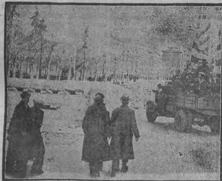
Jak widać, ulice Madrytu w czasie wkroczenia pierwszych oddziałów gen. Franco, były zupełnie puste.