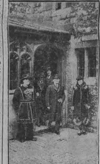
GEN. WEYGAND W LONDYNIE

jest jednak z nadzwyczajną ostrożnością, aby przez przed-