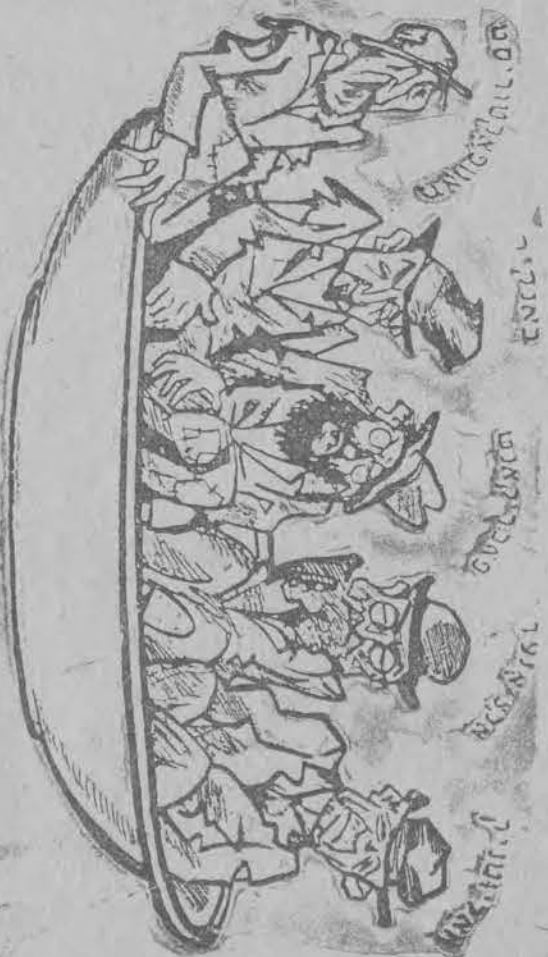
וואס לעבט נאך קיים