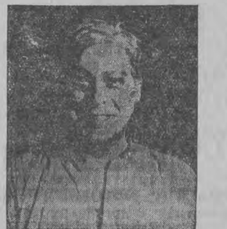
דעם דירעקטאר דוד צעלמיסער אין גע-לונגען איינצולאדען נאך אויף עמליכע געזעהלעטע גאסטשפילען דעם וועלט-בעריהמטען יודיש-דייטשען שווישפילער קורט קאשט.

דער ערשטער אויפטרעט וועט פארקומען פרייטאָג, דעם 16-טען נאוועמבער אין פֿרונדל צווייגס וועלט-בעריהמטע פיעטע, סערשונט גריש"א אין וועלכער קורט קאשט פיערט א גרויסען קינסטלערישען טריאומף.