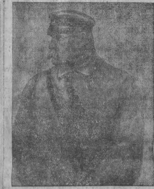
מארשאל יוזעף פילסורסקי

ווארשא, 10 (טעלעגראפיש). שבת, ערב דעם יום-טוב פון פוילענס-אונדזענדיגקייט האט די היינט-שטאט, אונטערזייען ערשטער און פלעצער זענען פארגעקומען מיינענדיקע פארשטאטלונגען, אין וועלכע עס האבען זיך בעטייליגט אלע שיכטען פון דער בעפעלקערונג.