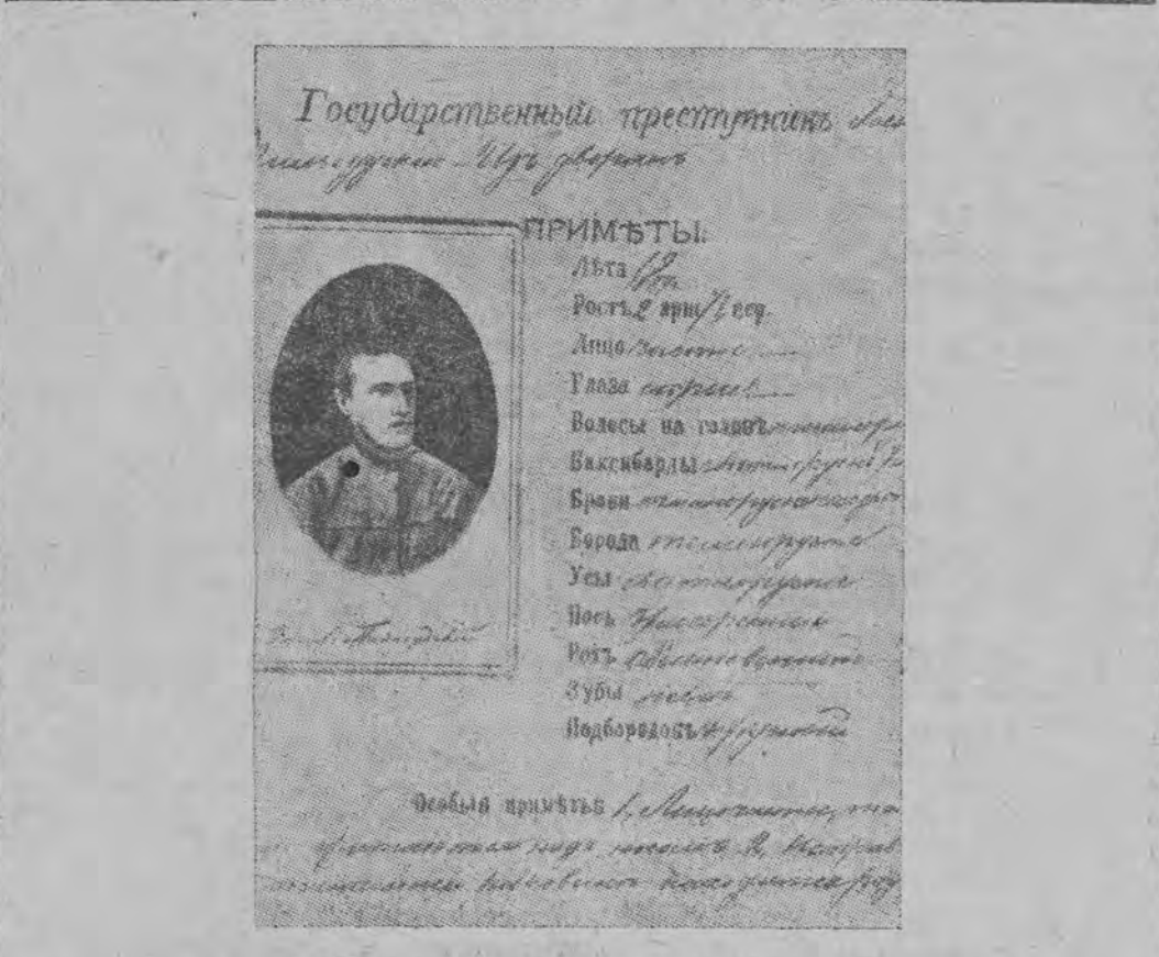
תפיסה-קארטע פון מארשאל פילסודסקי פון יאהר 1887.

ערב דעם וועלכע שטורם, בעת דעם גרויסען גע- ראנגעל פון מיליאנענדיגע מענשליכע מאסען, כדי נאך דעם גרויסען קרבן פון בלוט און לעזער זאל אויפשווערן דער מארגענשטערן פון מענשליכער פרייהייט און נאציאנאלע שטרעבונגען, כדי נאך די בלוט-קרופות זאלען קענען אויפשטעהן תחת- המתים פעלקער - האט ער מיט זיין פאליטישען זשעני און נביאותדיגען בליק געשאפען דאס איי- גענע געוועהר. דאס אייגענע געוועהר, וועלכע איז געווען אויס- געשמידט פון שטאף, האט זעהר בעשנידען רופט מיט א הויכען עכא איבער דעם נאנצען לאנד, אז אין דעם גרויסען געראנגעל נעמען מיר אפטייל נישט פאר קיין פרעמדען ענין נאך פאר אן אייגענעם. דאס געוועהר בעקומט דורך עטליכע יאהר אלץ מעהר רוטין און ערפארונג, ווערט געשטארקט נישט נאך אין כמות, נאך אויך אין איכות, אזא סא- מענט פון דעזיזוע וועגען גורל פון מלוכות און פעל- קער, און מאכענט ווען ס'האט זיך געשטאלטעט די אייראפעאישע מאפע, איז דער גרויסער נפטר אין בעזיצן פון א פערזענלעכען קאלעקטיווען ארגאניזם, וועלכער שטיצענדיג זיך אויף דעם היסטארישען און נאציאנאלען געוויסען - פונקט, געהאט די מעגליכ- קייט אויסצושמידען אן אייגענע אונטערגענייטע מלו- כה, און דאס, וואס דער נביא האט אין זיין וויזיא- ניסטישע טרויערען אויסגע'האלט'ען, האט זיך אין די הענט פונם בויער פערזענלעך אין מעשים און די אייגענע מלוכה, כמעט מיט די אלטע גענייטען האט ווידער אויפגעלעבט.