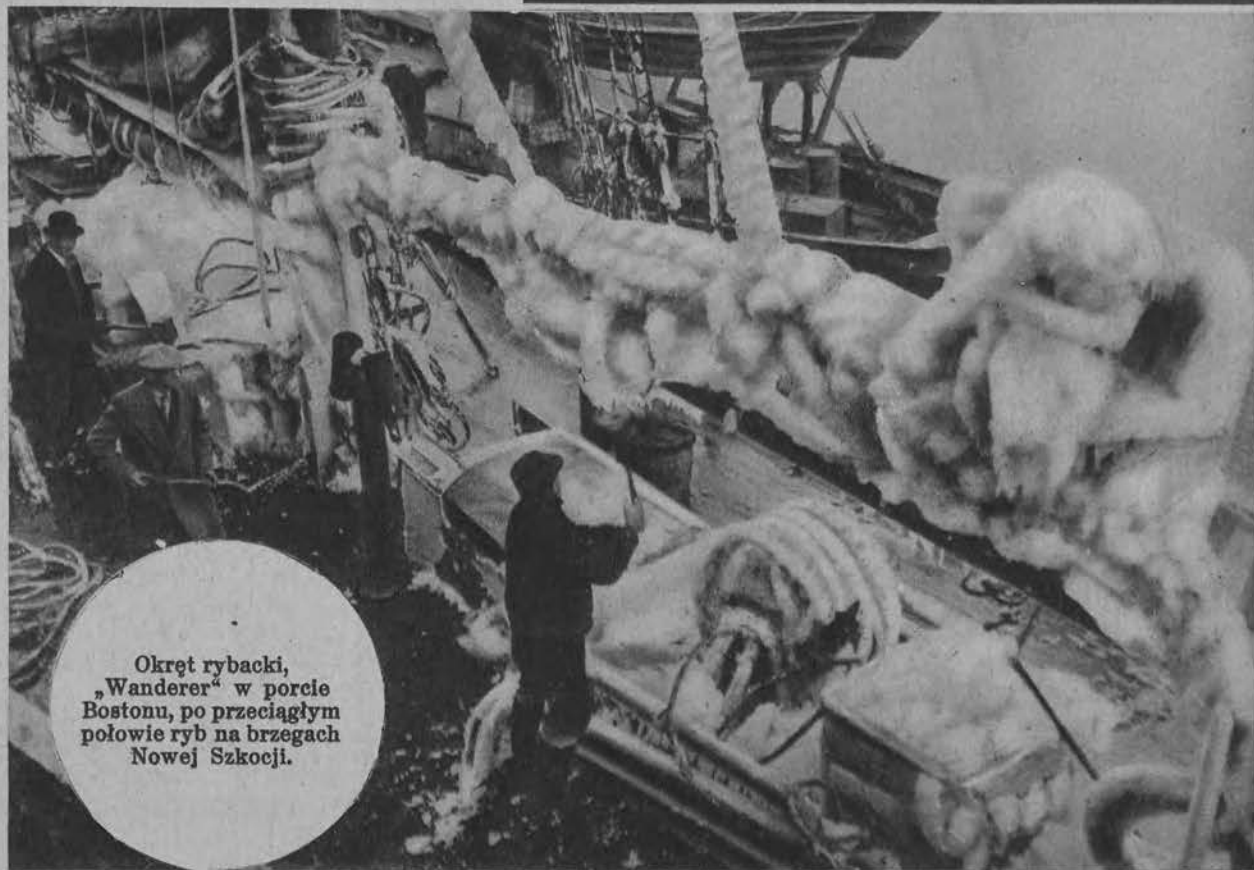
Okręt rybacki, „Wanderer“ w porcie Bostonu, po przeciągnięciu połowie ryb na brzegach Nowej Szkocji.