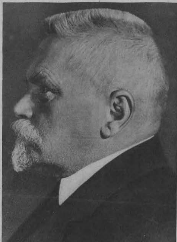
Vintila Bratianu, przywódca partji liberalów w Rumunji, zmarł nagle w 63 roku swego życia.