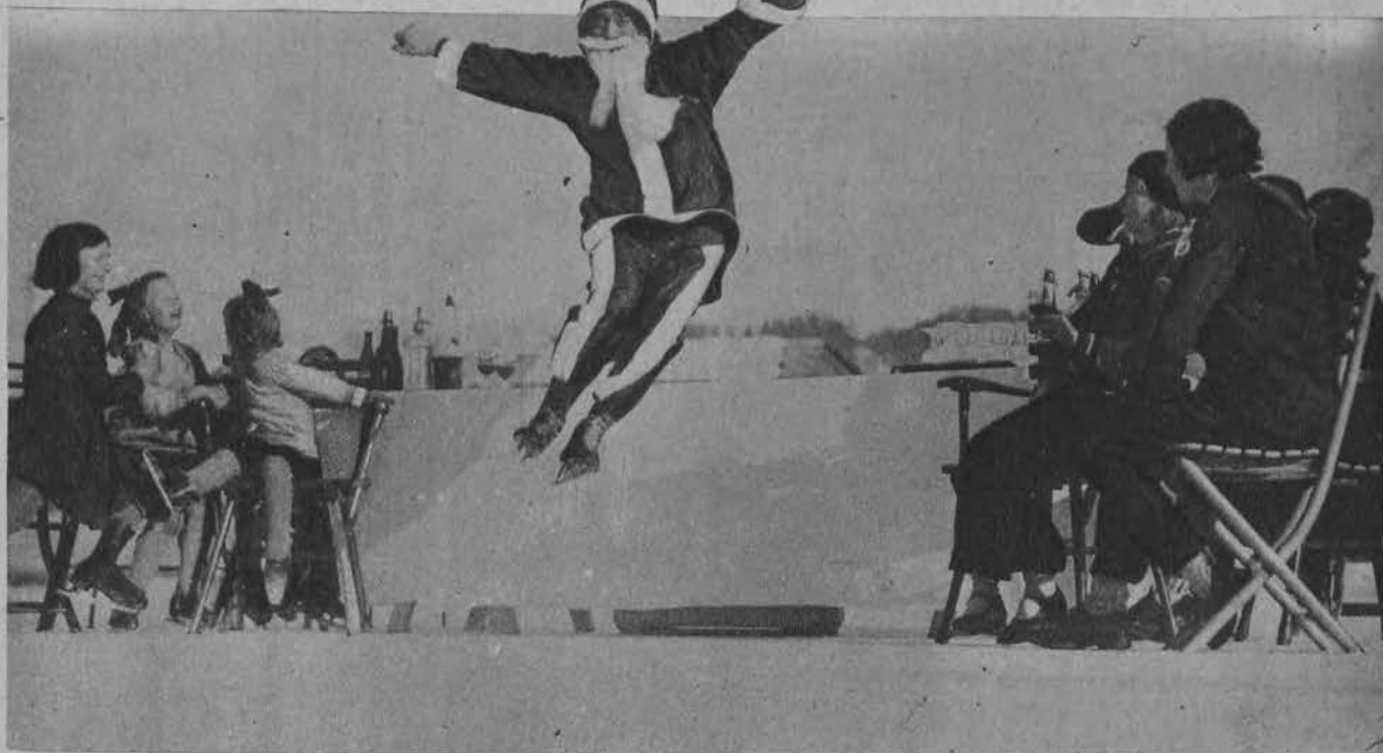
Święty Mikołaj zatrzymał się w podróży po ziemi w St. Moritz, gdzie z przyjemnością uprawia sport łyżwiarski.