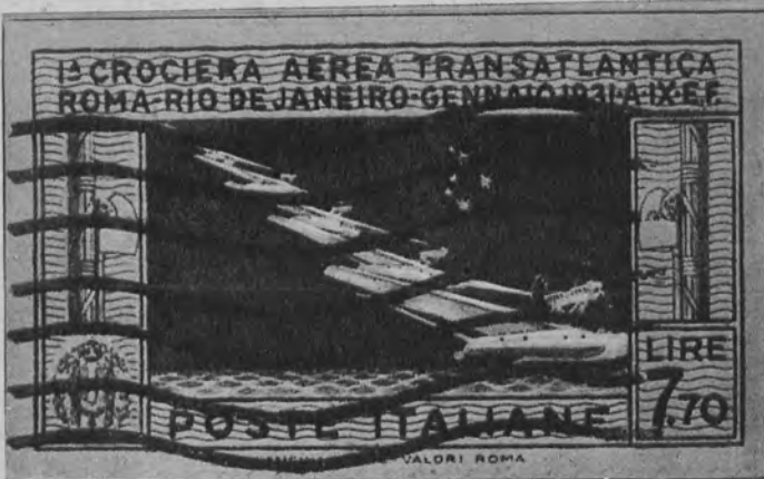
Na lewo: Marka poczty włoskiej wydana na pamiątkę lotu hydroplanów do Brazylii.