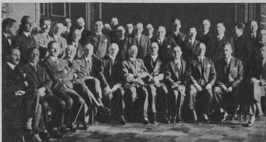
Przedstawiciele 16 państw Europy na tegorocznej międzynarodowej konferencji lotniczej w Berlinie.