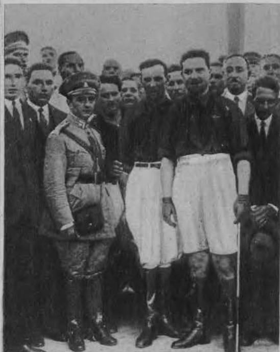
Na prawo: Włoski minister lotnictwa gen. Balbo i pułkownik Maddalena w Natalu otoczeni brazylijczykami.