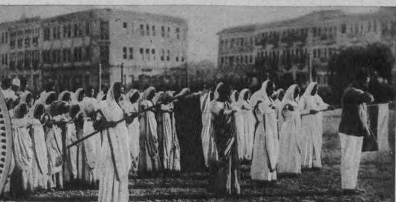
Uroczysta ceremonia powitania flagi narodowej indyjskiej przed zawieszeniem jej na budynkach rządowych.