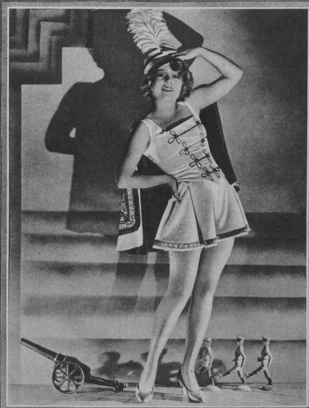
Piękny kostjum karnawałowy.