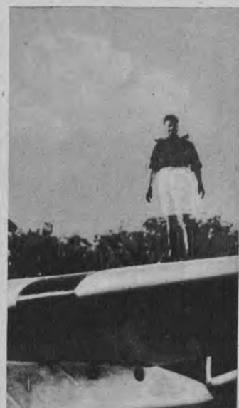
Na prawo: Generał italski Balbo na skrzydle swego samolotu w moment po wylądowaniu na ziemi Ameryki Południowej.