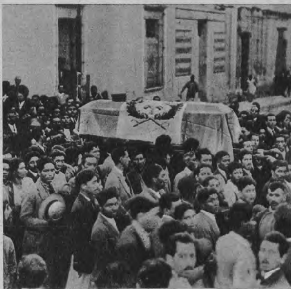
Na prawo: Pogrzeb generała Muaro de Leon ministra wojny Guatemali, zabitego w czasie utraczek między powstańcami a zwolennikami rządu.