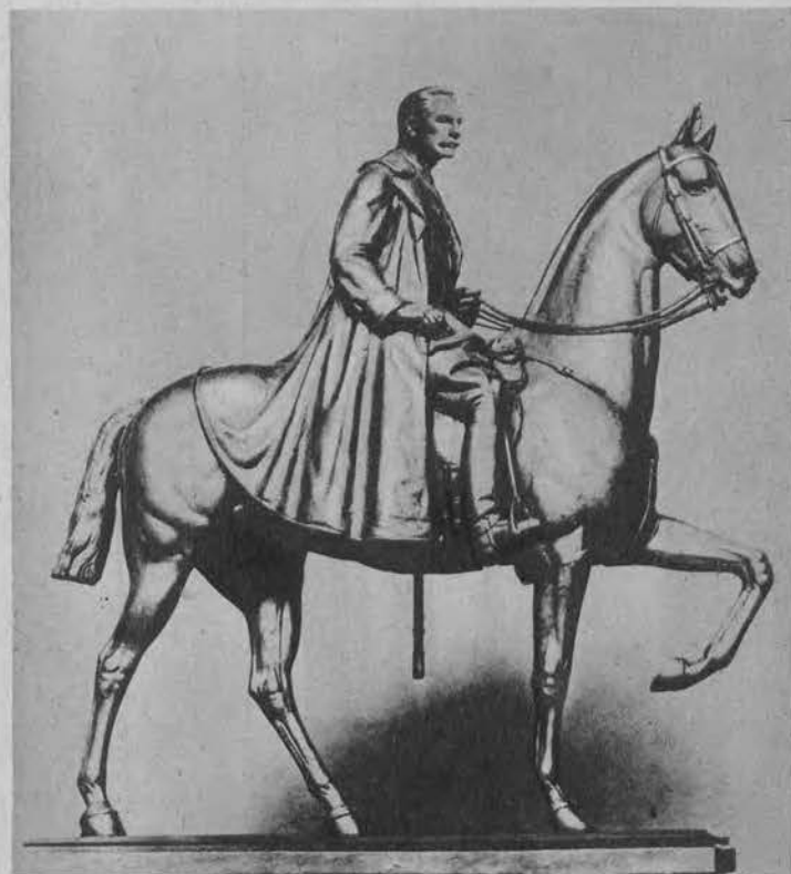
Pomnik angielskiego marszałka wojny światowej Haig'a wystawiony obecnie w galerji królewskiej w Londynie.