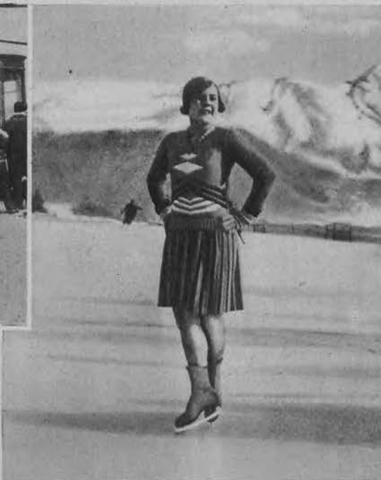
Sonja Henje młodociana mistrzyni świata w jeździe na łyżwach trenuje w St. Moritz.

- Pani ma cudowną cerę! - Tak, bo od urodzenia pielegnowano mnie MYDŁEM BÉBÉ SZOFMANA!