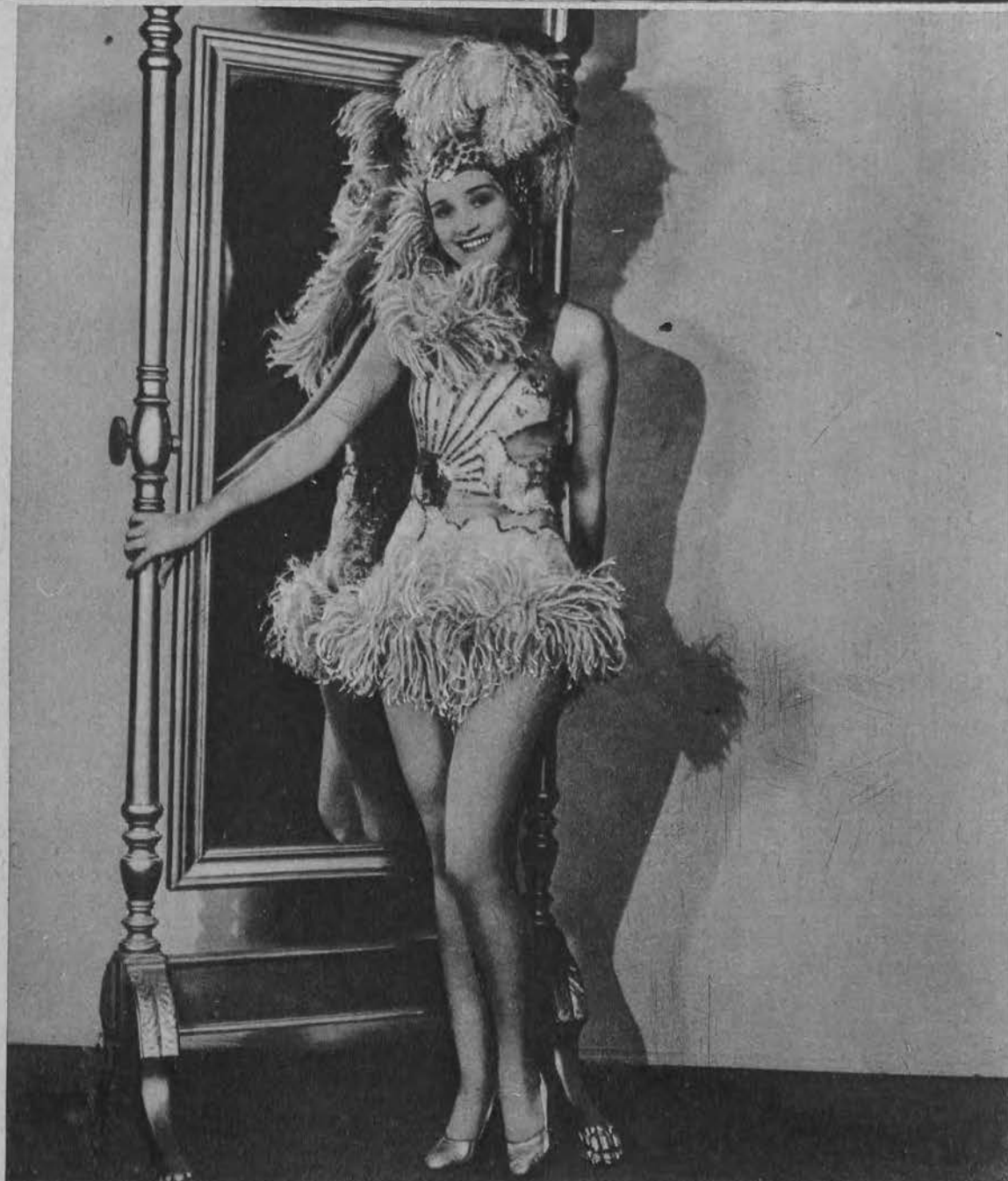
Piękny rekrut „Talkiesu”, Marion Marsh w kostjumie w którym wystąpiła w pierwszym swym filmie „50 milionów Francuzów”.