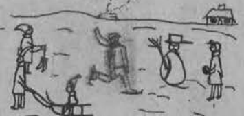
„Zabawy zimowe“ rys. Julia Czarcińska