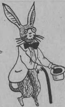
„Kajszaki wielkani“ (rys. Edzia P.)