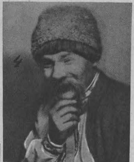
5. Pieśni cygańskie.