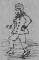
„Na lodzie“ rys. Paulina Swarcówna