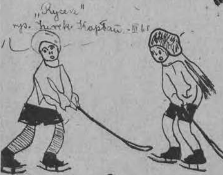
„Rycers“ rys. „Hroki Hapdaw“ - III kl.