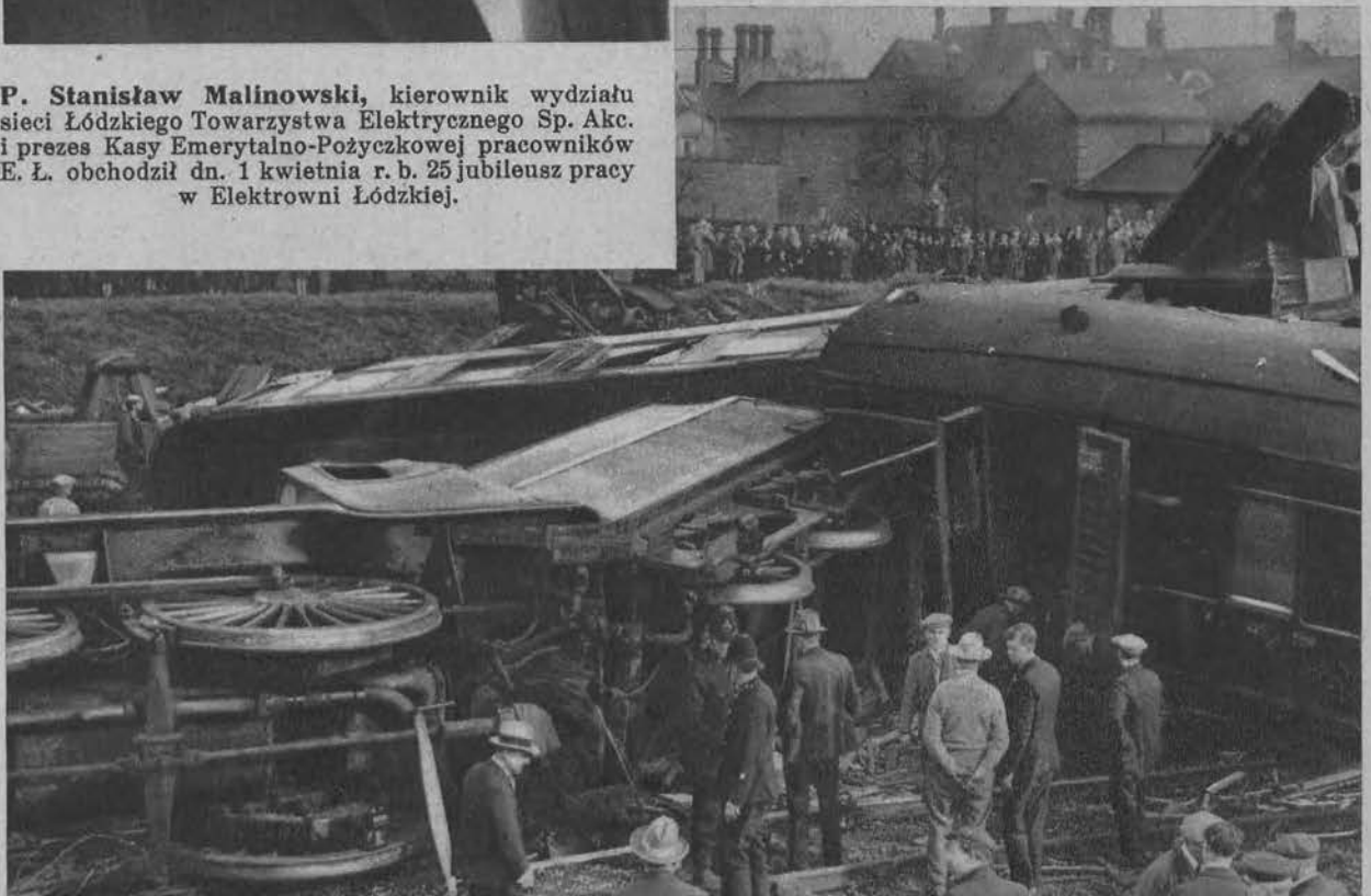
Poniżej: Obrazek z przerażającej katastrofy pociągu pospiesznego „Royal Scot” pod Londynem.