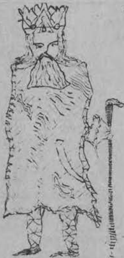
„Król czołdacy“ rys. „P. J.“