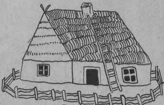
„CHATA WIEJSKA“ (rys. Maliny Wojdyławskiej)