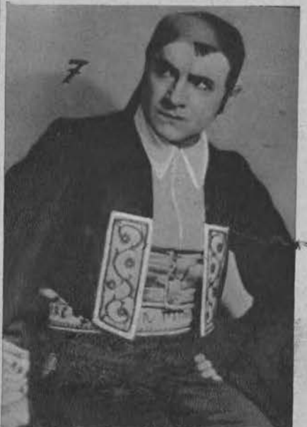
7. Pieśni hiszpańskie.