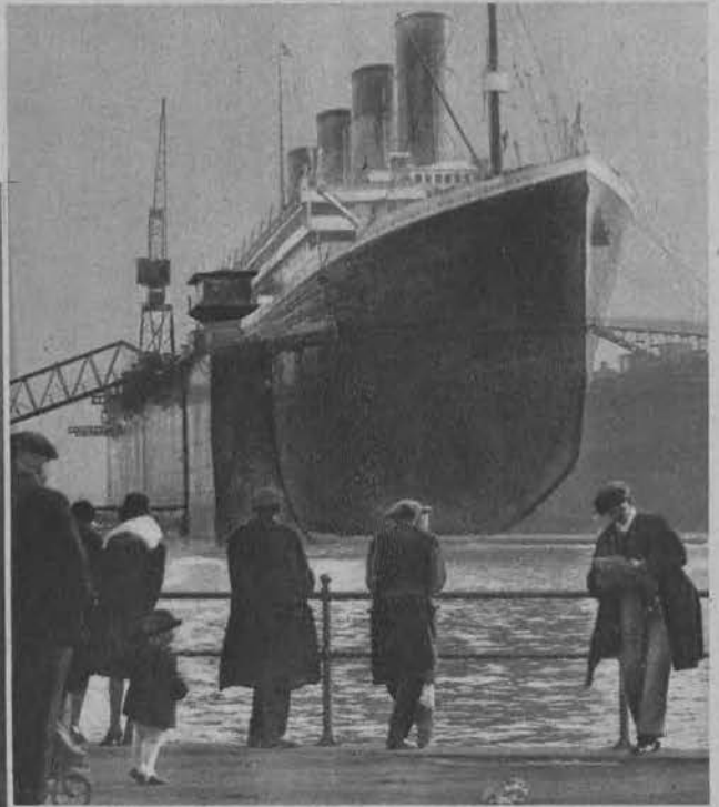
Olbrzymi okręt pasażerski „Olympia” w dokach Southampton, który zaatakowany w czasie wojny przez łódź podwodną zatopił ją.