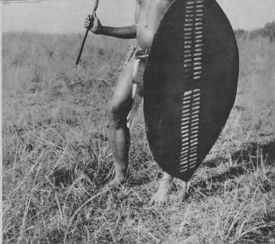
Zulus z N. Zelandji w codziennym stroju, który składa się z pasa z wyprawionej skóry, z tarczy i kija.