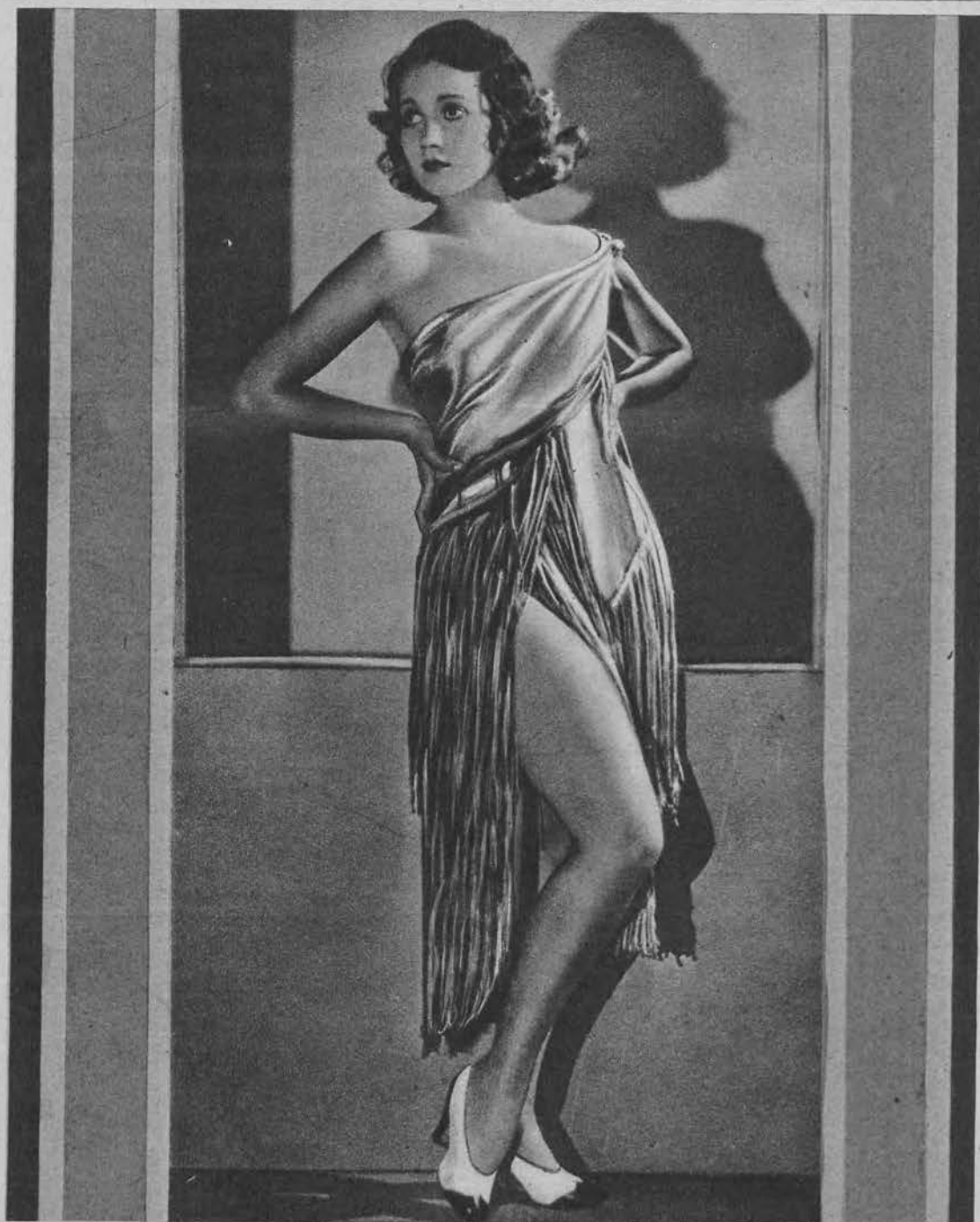
Gwiazda filmowa Harriet Lake.