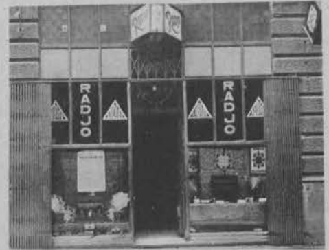
Jedno z najstarszych przedsiębiorstw radjotechnicznych w naszym mieście „RADIO-AUDION“, ul. Traugutta 1 cieszące się w sferach radioamatorów zasłużonym zaufaniem obchodziło w tych dniach 5-cio lecie swego istnienia. Powyżej zdjęcie sklepu wymienionej firmy.