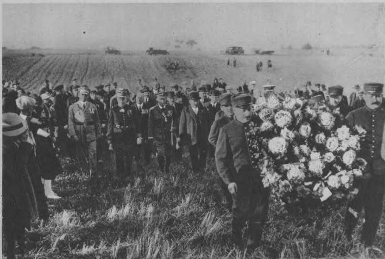
Delegacja ang. min. lotnictwa oraz uratowani pasażerowie z okropnej katastrofy sterowca R. 101, udają się w rocznicę wypadku na żałobne nabożeństwo na miejscu katastrofy we Francji.

Wszędzie do nabycia, gdzie niema, wprost: APTEKARZ DRANCZ I SKA., BIELSKO. WYRÓB KRAJOWY