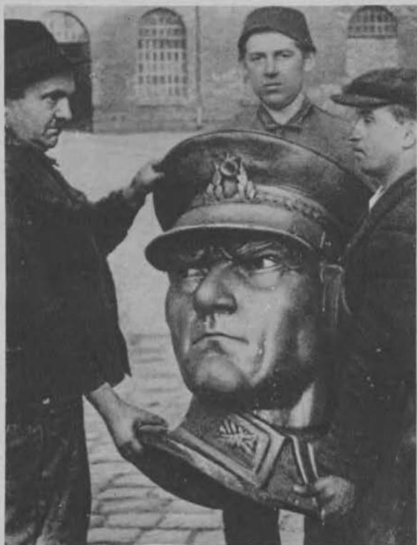
Głowa z rozmontowanego pomnika tureckiego dyktatora Kemala Paszy, który z Wiednia przesłany będzie do miasta Samsun przez Hamburg.

Na prawo: Gwiazda filmowa w uroczym negliżu.