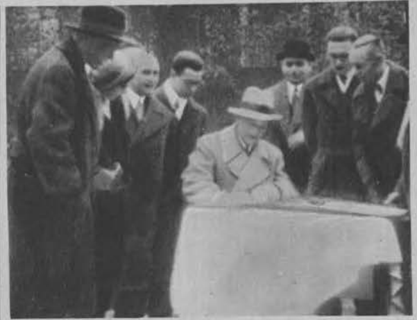
Harry Liedtke w Łodzi rozdziela autografy swym wielbicielom.