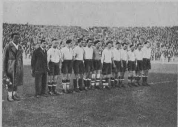
Reprezentacja piłkarska Polski.