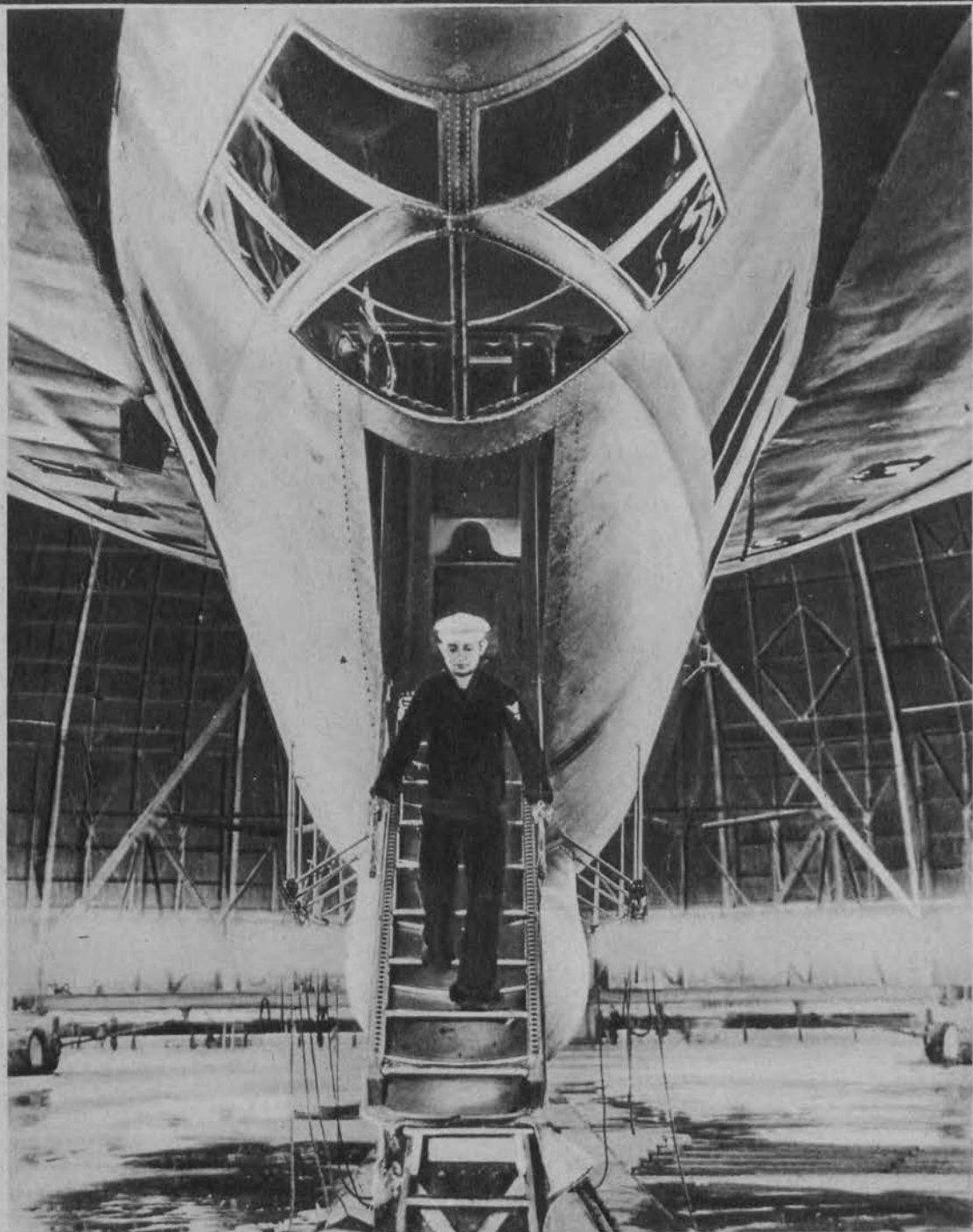
Wejście do gigantycznych rozmiarów sterowca amerykańskiego „Akron“, który obecnie odbywa swe pierwsze udane próbne loty. Żołnierz załogi opuszczający gondole maszynistów