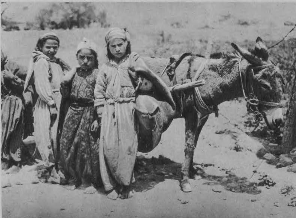
Dzieci tureckie w Dobrudzy.