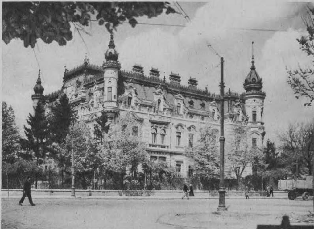
Gmach ministerstwa spraw zagranicznych w Bukareszcie.