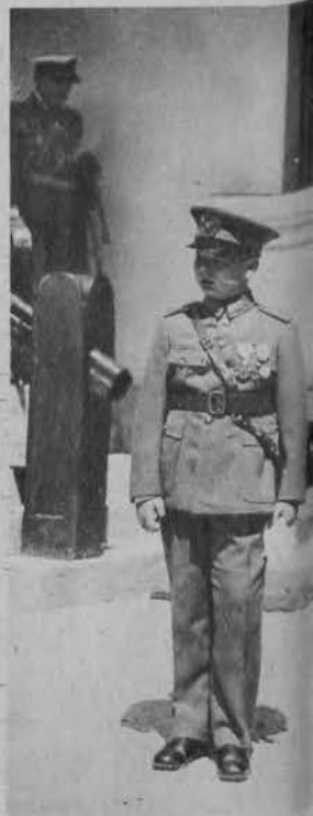
Król Karol i nas