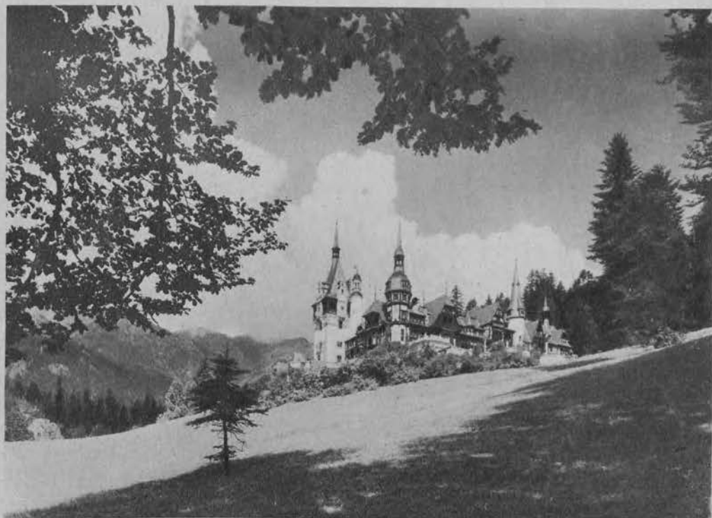
Letnia rezydencja królewska w Sinaja.