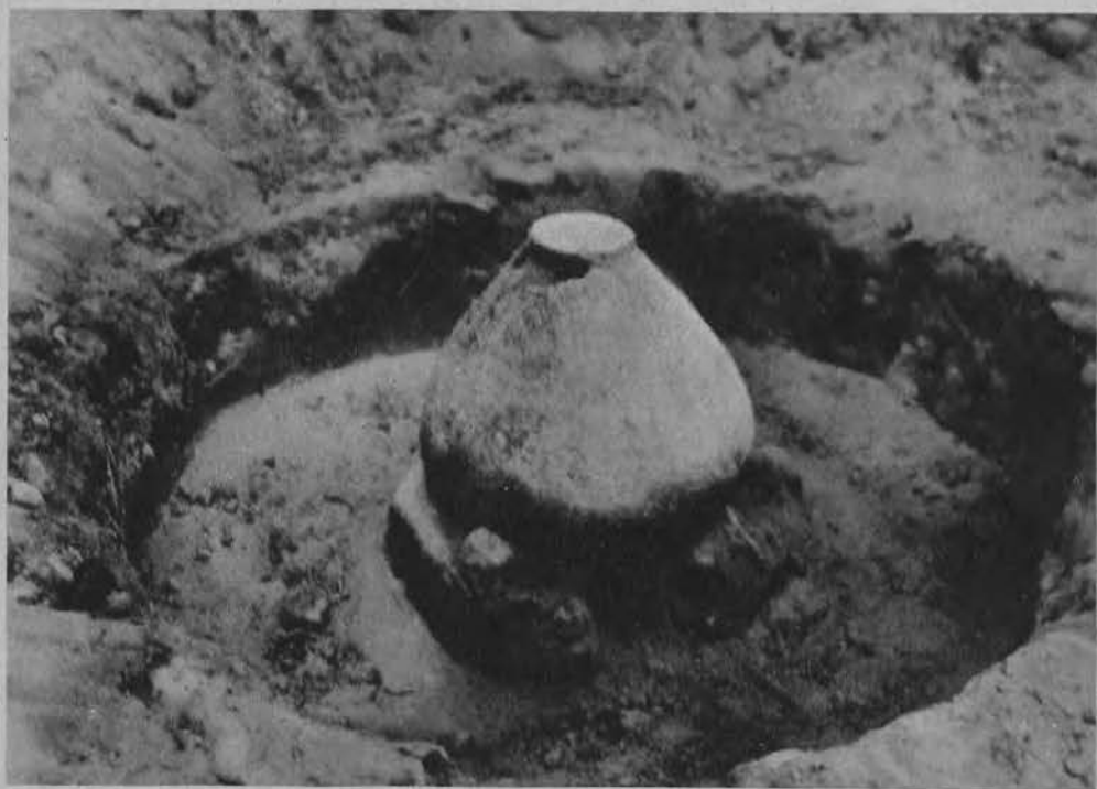
Grób podkloszowy odsłonięty w Tumie pod Łęczycą z okresu późniejszego, bo pochodzący z 2-go wieku przed Chrystusem, a więc liczący „tylko” 2.000 lat. (Patrz artykuł w dzisiejszym numerze „Głosu Porannego”).