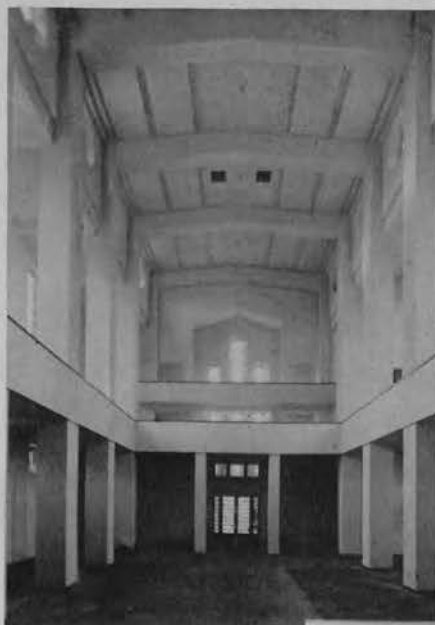
Wnętrze kościoła garnizonowego i szkolnego w Katowicach. — Widok na nawę główną i chór.

Na lewo u góry: W stolicy województwa śląskiego w Katowicach wykończono budowę nowego kościoła garnizonowego i szkolnego. Uroczysta konsekracja kościoła odbędzie się z końcem listopada br.