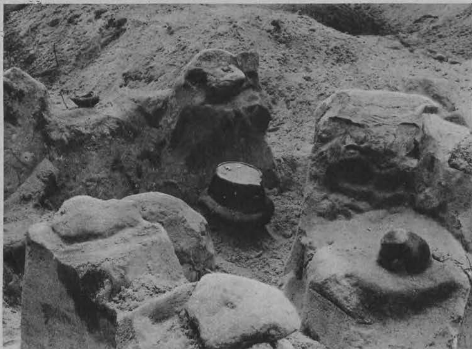
Urna z prochami, pochodząca z 12-go wieku przed Chrystusem. Obok słupy ziemi, kryjącej dalsze groby.