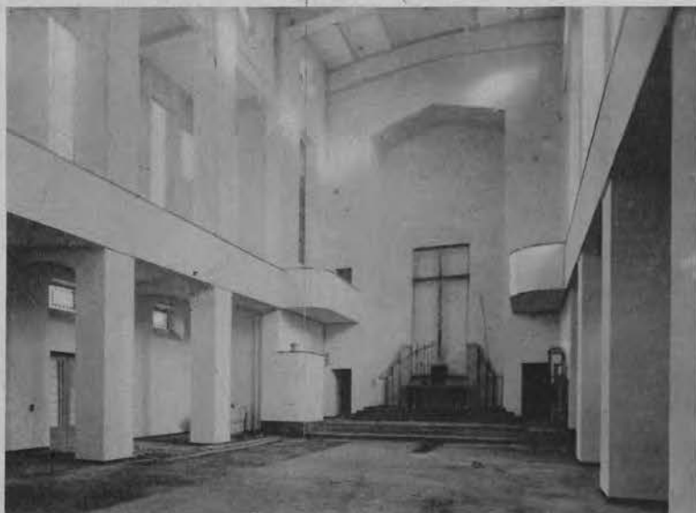
Kościół garnizonowy i szkolny w Katowicach. — Widok na presbiterjum i ołtarz główny. (Budowa w stanie surowym).

Na lewo u góry: W stolicy województwa śląskiego w Katowicach wykończono budowę nowego kościoła garnizonowego i szkolnego. Uroczysta konsekracja kościoła odbędzie się z końcem listopada br.