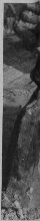
Urna na wana do zd