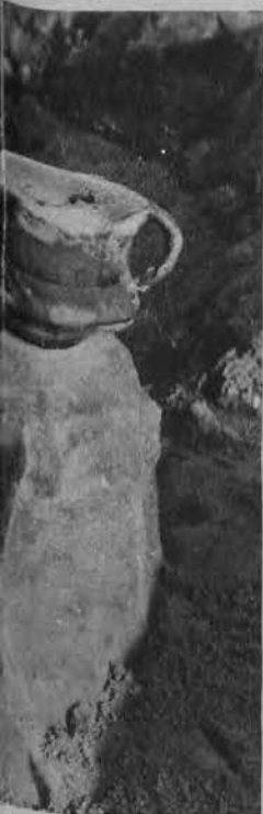
Słupie ziemi przygotowane do odkrycia