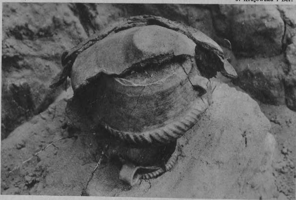
Urna z ornamentem, z pokrywą i przystawką na jedzenie dla zmarłego.