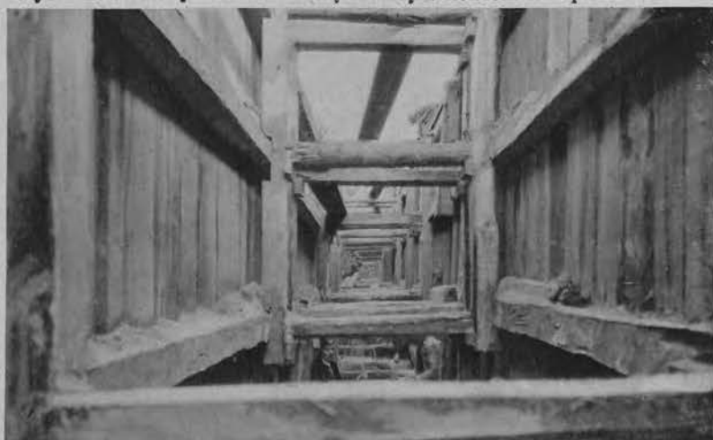
W najbliższym czasie Polska uzyska bezpośrednie kablowe połączenie telefoniczne z państwami Zachodu. Z przeprowadzanych obecnie prac przy układaniu kabla Warszawa—Cieszyn podajemy fragment z odcinka pod Mysłowicami.

Na prawo: W nowoczesnym budownictwie stal i żelazo wypierają „przestarzałe” materiały budowlane. Oto stalowy szkielet garażu autobusowego Śląskich linii Autobusowych w Katowicach, który pomieści 50 autobusów 30 i 50-osobowych, obsługujących centrum przemysłowe wojew. śląskiego.