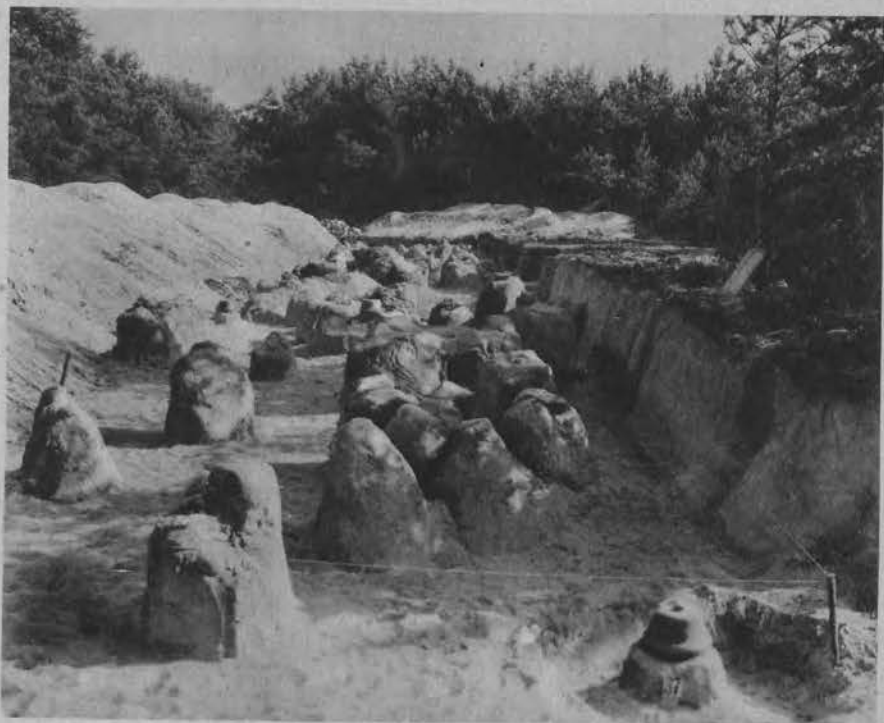
Część odkopanego cmentarzyska ciałopalnego w Sierpowie koło Łęczycy.