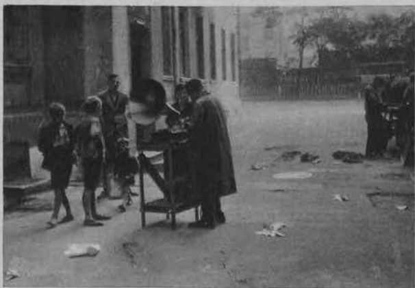
Zamiast kataryniarza — „Gramofoniarz”.

Na prawo: M. Boruciński: Hucul z Żabiego.