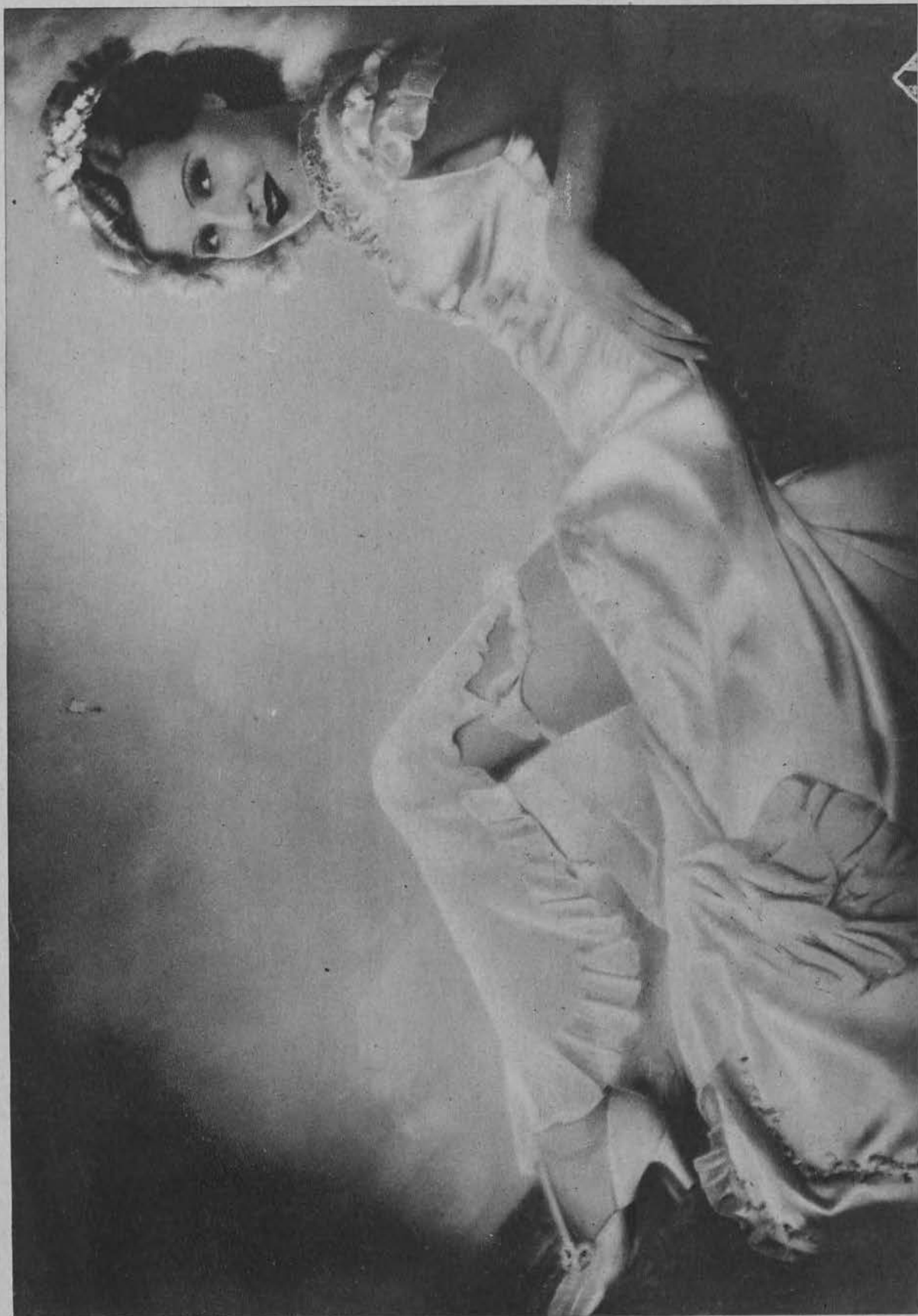
Liljan Harvey w filmie „Kongres tańczy”.