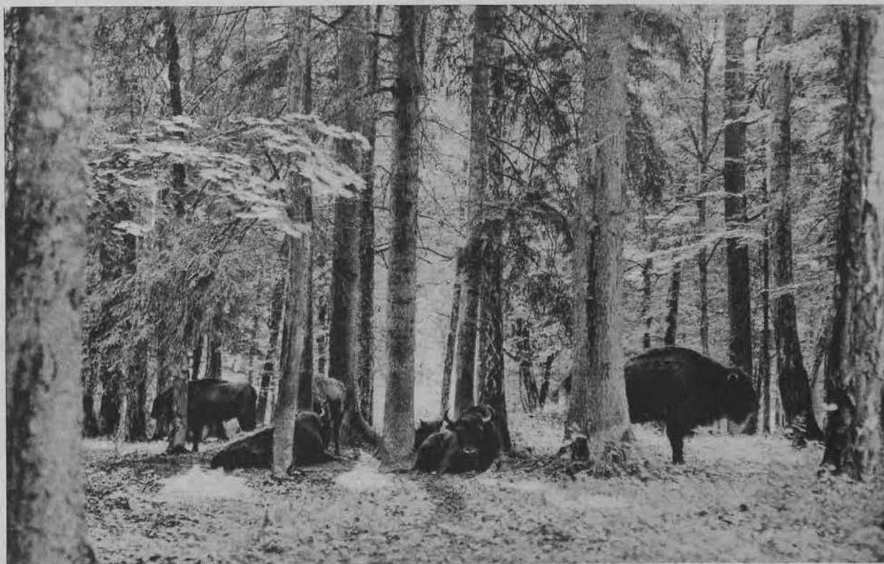
Żubry w puszczy Białowieskiej.