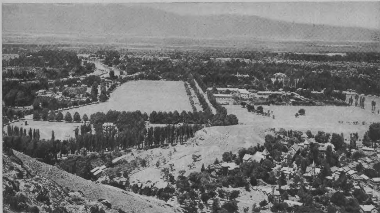
Malowniczy widok Srinagaru w Kaszmirze (Indje ang.) gdzie wybuchły obecnie rozruchy antyrządowe.