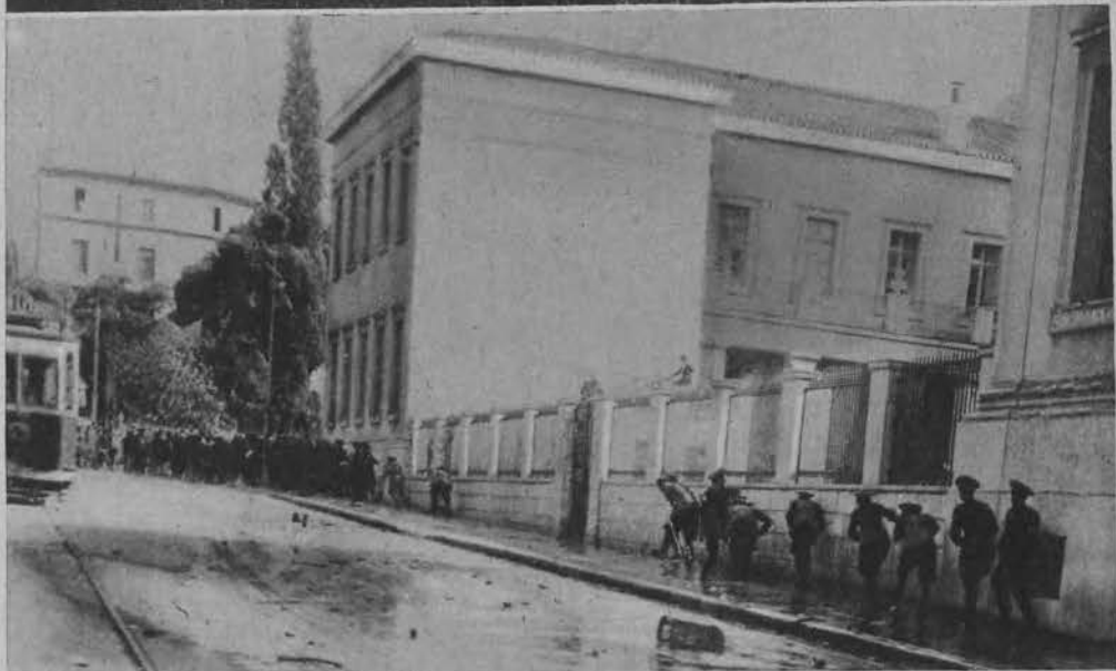
Na lewo poniżej: Obrót w Atenach na rzecz powstania się przed demonstrantami.