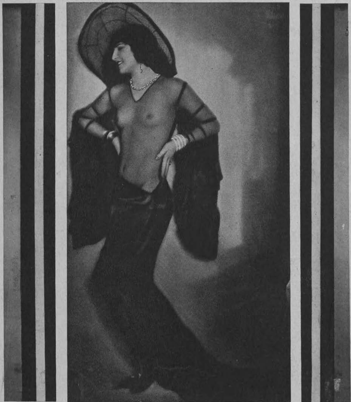
„Ekstrawagantka“. (Studjum fotograficzne).