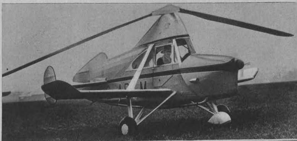
Na lewo: Nowy model samolotu, który może się prawie prostopadle do ziemi.