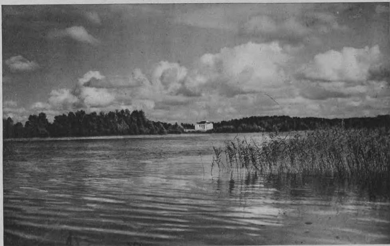
Jezioro Trockie i pałac w Zatróczu na Wileńszczyźnie.