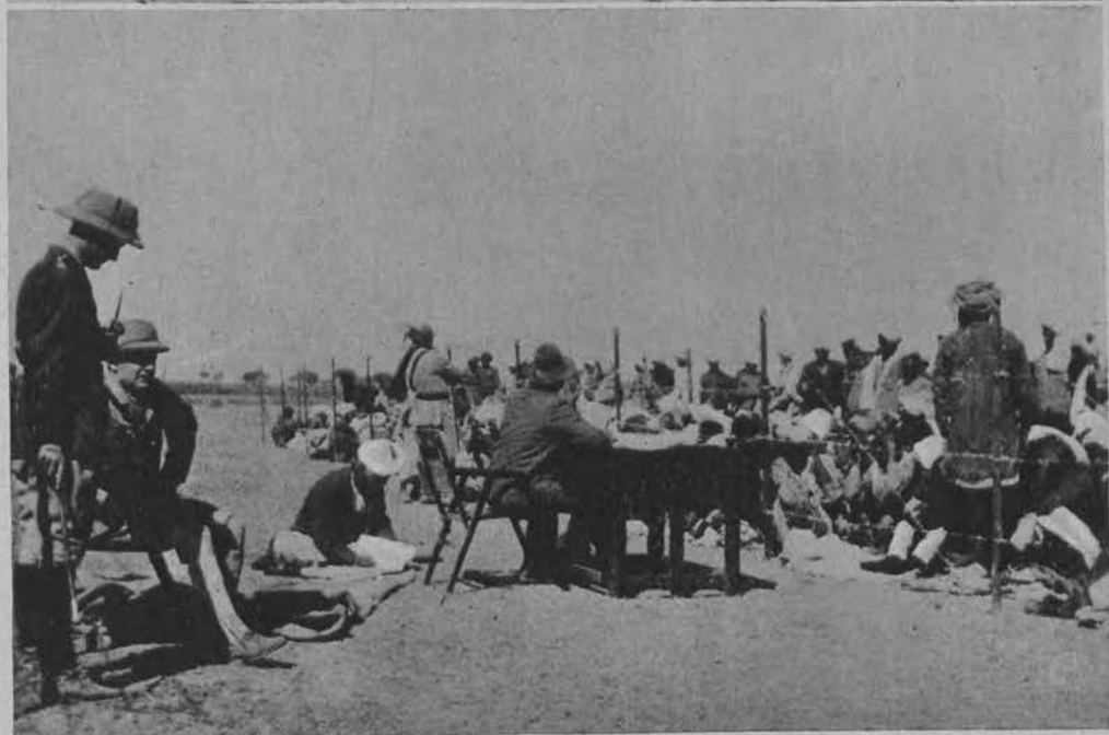
Na lewo: Obrazek z terenów powstania, w których ang. zawezwanego w porządku.