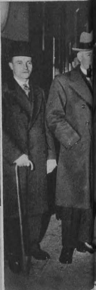
Generał Dawes amerykański przyjeżdża do Paryża na konferencję.