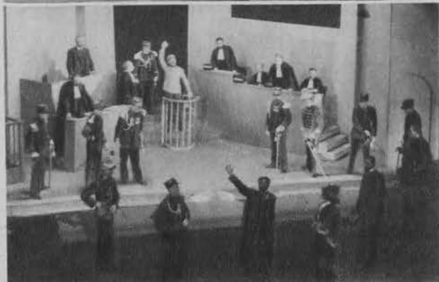
Proces Zoli przed sądem cywilnym w Paryżu (Obraz IV).