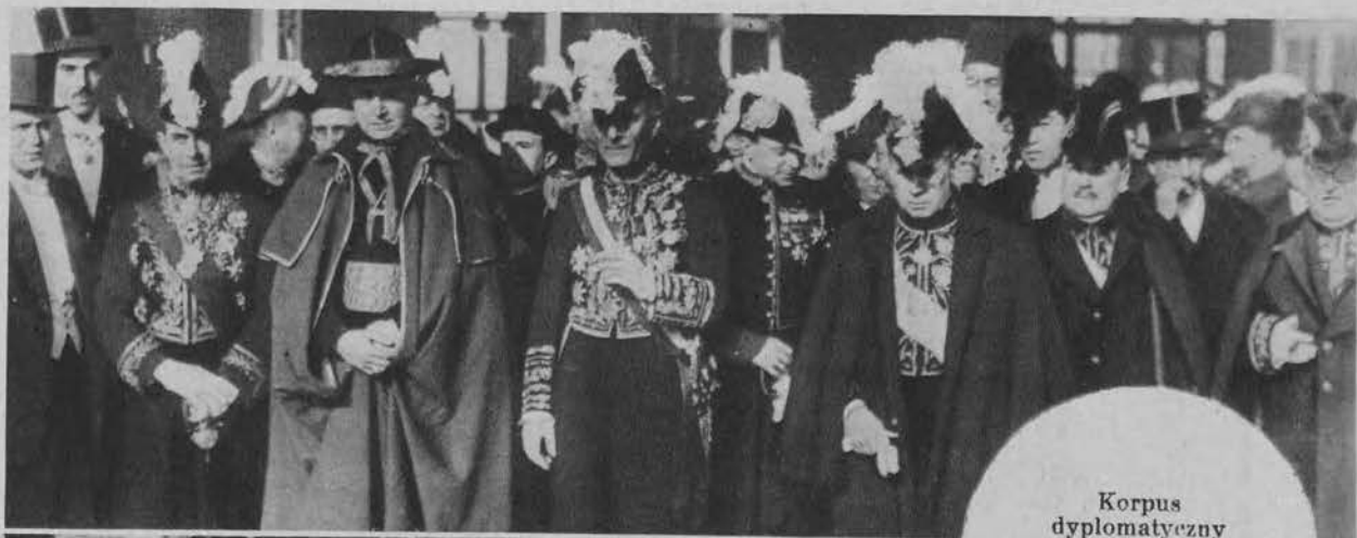
Korpus dyplomatyczny odwiedza pierwszego prezydenta Hiszpanji, Zamorę.