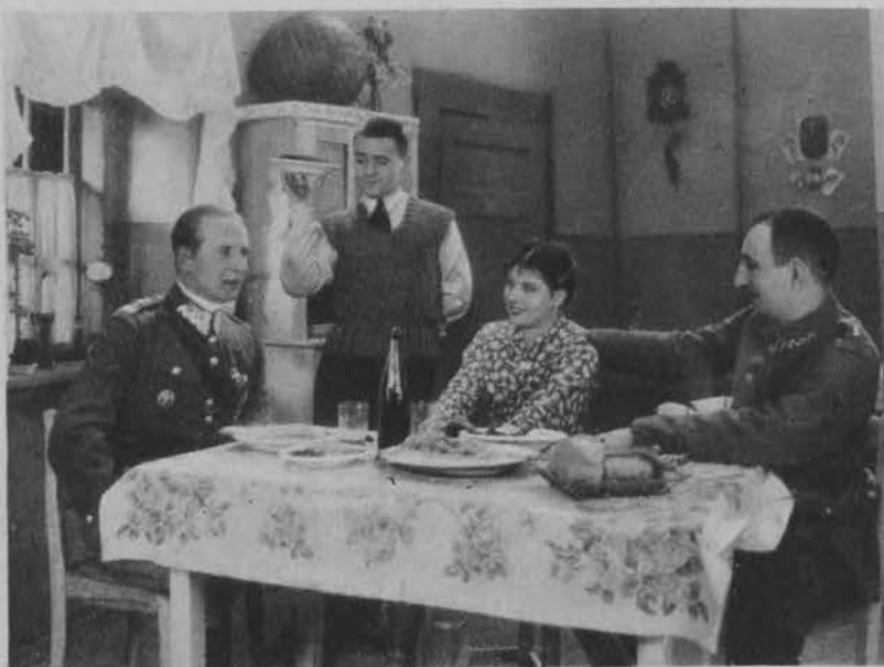
Bol. Wieniawa-Długoszowski mianowany ostatnio generałem brygady zajmuje się również działalnością literacką. Ostatnio napisał scenariusz filmowy do komedii dźwiękowej polskiej. Widzimy go pośród jej wykonawców Dymyzy, Pogorzelskiej i Krukowskiego.