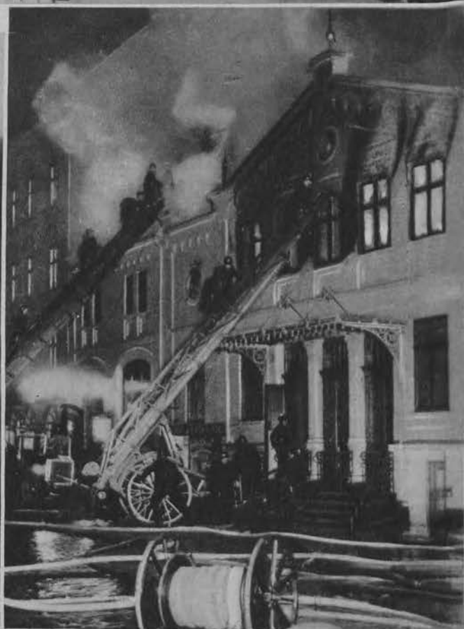
Pożar najstarszego „teatru rewjowego“ Norrebrog w Kopenhadze.

Na lewo: Słynna mistrzyni tenisa Helen Wills-Moody udaje się w dłuższą podróż na daleki wschód.