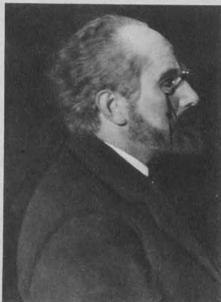
Emil Zola (Jerzy Woskowski).