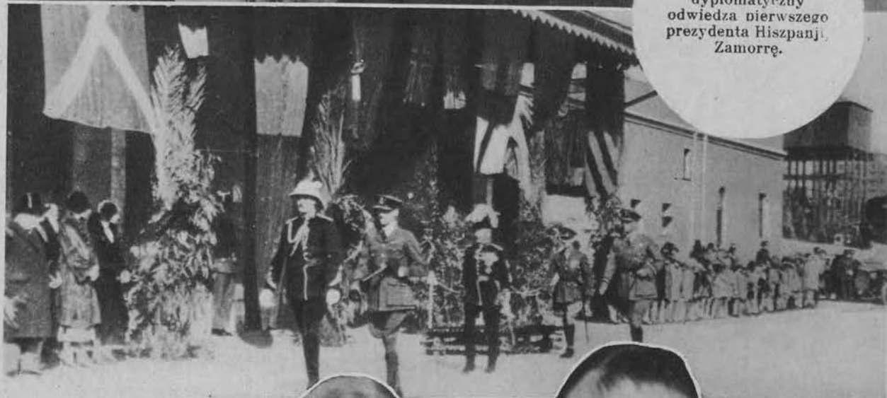
Nowy komisarz Pa- lestyny sir Artur Wan- hope obejmuje władzę.