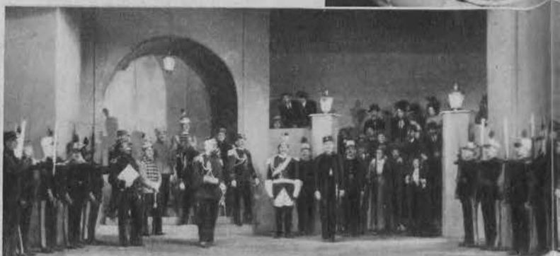
Degradacja kpt. Dreyfusa na dziedzińcu szkoły wojennej (Prolog)