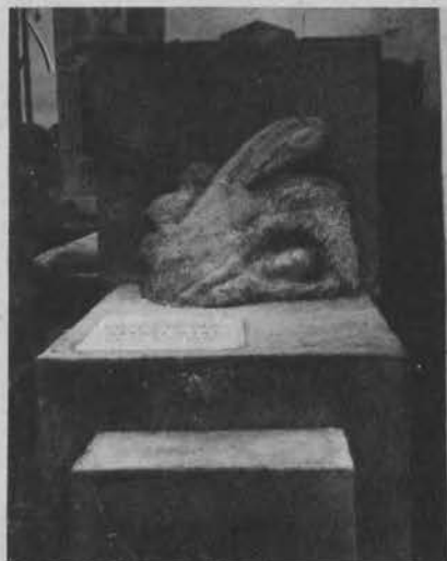
„Konający Iabędź“. Nowoczesny pomnik na cmentarzu w Łodzi, dłuta rzeźbiarza M. Chojnowicza.

Na prawo: Największy skarbiec (tresor) bankowy otworzono w Londynie.