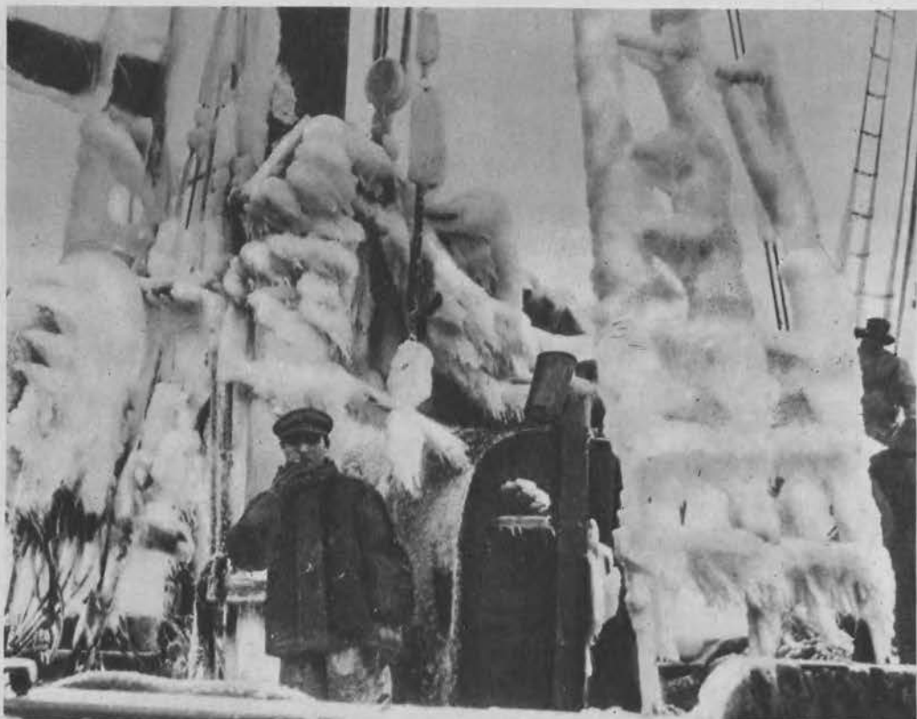
Powrót z połowu ryb na dalekiej północy. Okręt rybacki zakuty w lodowe kleszcze.