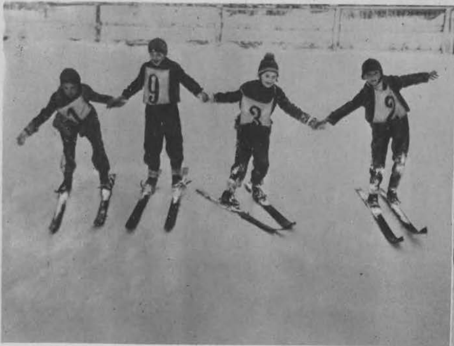
Nowy Rok 1932 pod znakiem sportu w Europie.