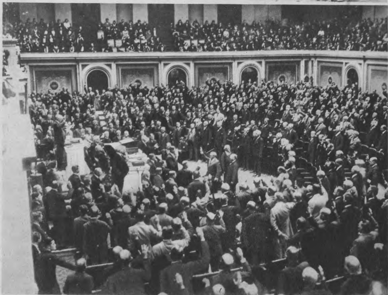
Życie Kapitolu w Waszyngtonie w czasie uroczystego otwarcia 72 sesji am. kongresu. Głosowanie nad przyjęciem planu moratorium Hoovera które przeszło 21 głosami przeciwko 4.