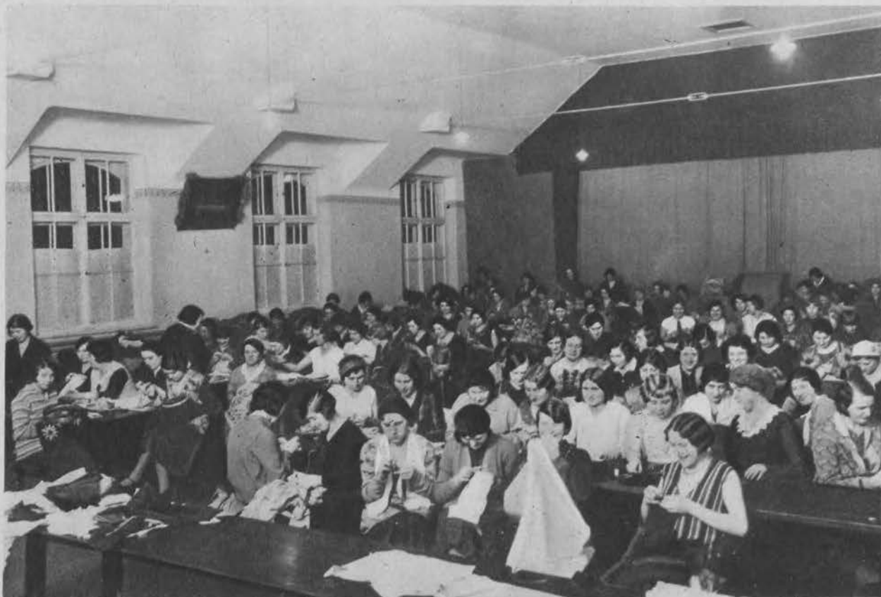
Wzorowo urządzony współczesny kurs szycia, haftu i wszelkich robót kobiecych dla robotnic, istniejący przy Łódzkiej Fabryce Nici Sp. Akc. w Łodzi (ul. Niciarniana 1).