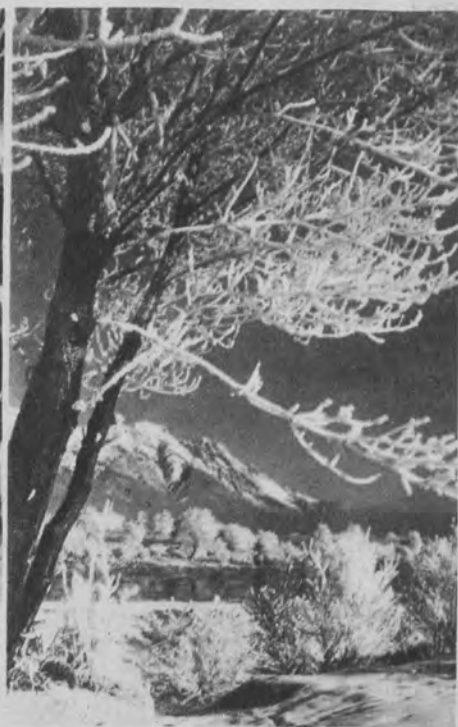
Samolot australijskiego pilota Kingsford Smith'a spadł między drzewa owocowe w hrabstwie Kent w Anglii. Lotnik został ciężko ranny. Na prawo: Pejzaż górski w władaniu królowej zimy.