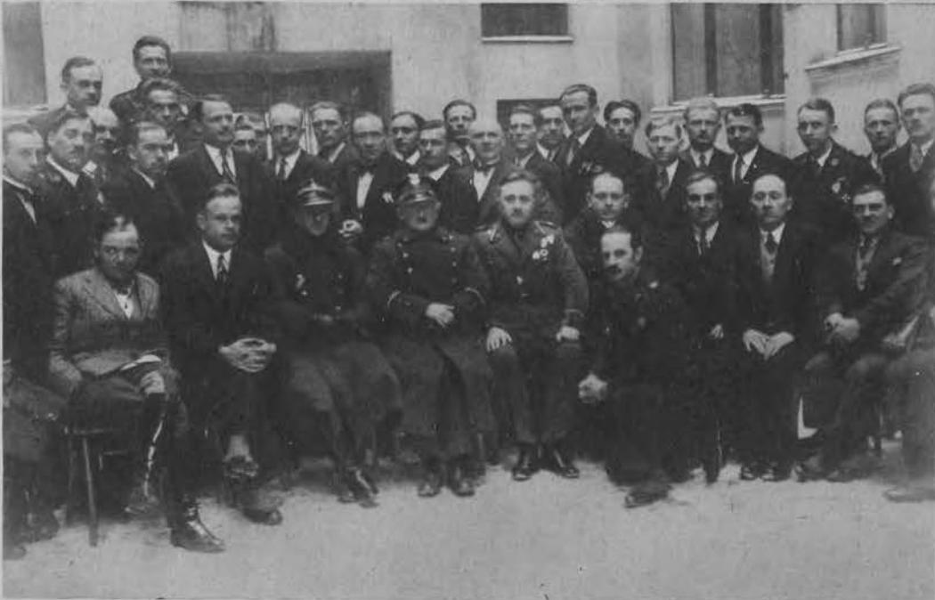
Uczestnicy Okręgowej Konferencji Związku Rezerwistów w Łodzi w dniu 14 lutego 1932 r.