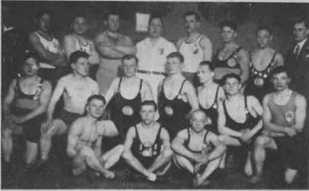
Finaliści w zapasach.