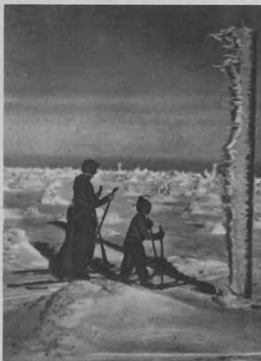
Narciarze w bezludnej w zimową szatę obleczoną okolicy gór Izerskich leżących na granicy Czech i Śląska Pruskiego.

Na lewo: Tańczymy „Rumbę” czyli złe czasy.