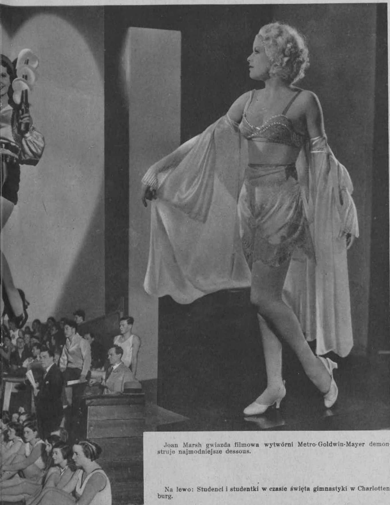
Joan Marsh gwiazda filmowa wytwórni Metro-Goldwin-Mayer demonstruje najmodniejsze dessous.