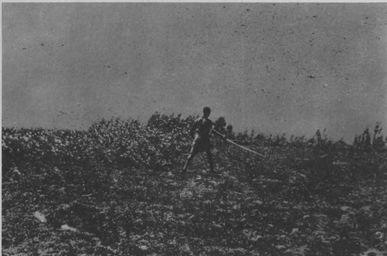
Abisynję nawiedziła plaga szarańczy. Oto murzyn usiłujący bezskutecznie ocalić plon swego pola od zagłady.