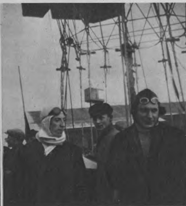
Studenci berlińscy Suckstorff i Schütze wzniesli się w stratosferę na wysokość 9000 m.

Na lewo: Były król Saksonji Fryderyk August zmarł w swej posiadłości Sibyllenort w wieku 67 lat.