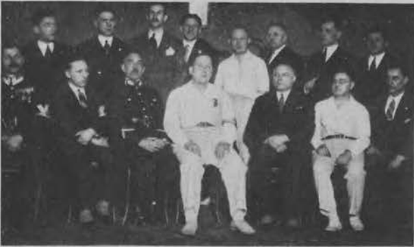
Zarząd Ł. O. Z. A., który sprawnie przeprowadził mistrzostwa Łodzi.