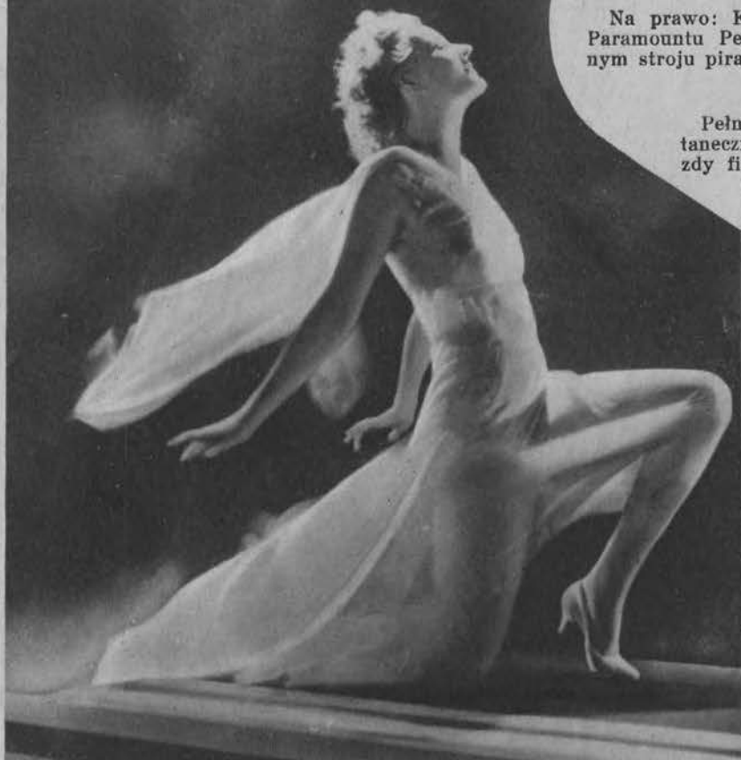
Pełna wdzięku poza tancezna sławnej gwiazdy filmowej Juliette Compton.