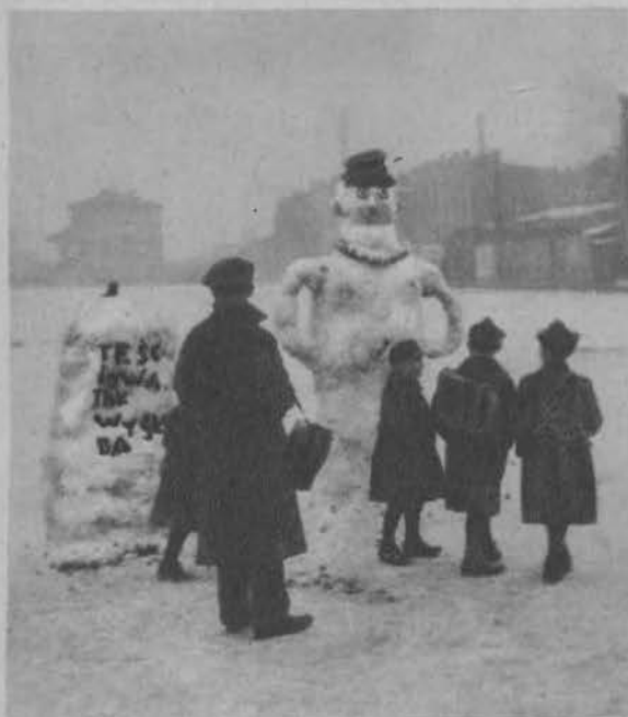
„Tak wygląda teściowa!“ Bałwan ze śniegu na łódzkim placu powęglowym z „tablicą objaśniającą“.