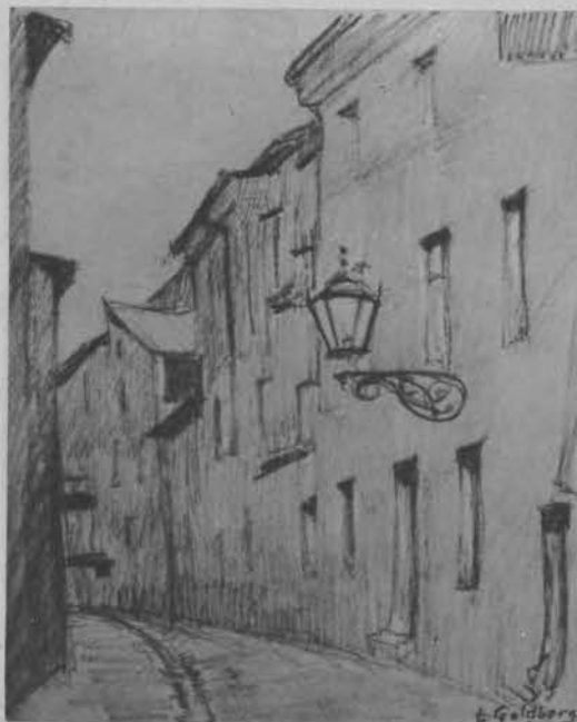
Z teki artystów Łódzkich (cztery zdjęcia)