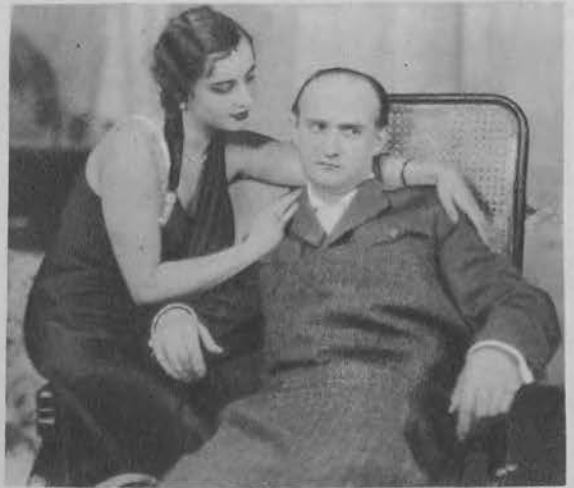
Ankwiżówna i Biegański („Święty płomień“).