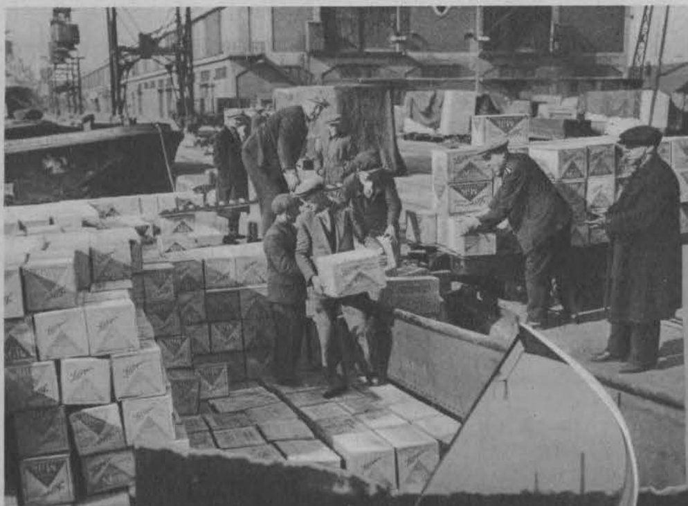
Na lewo: Przed wprowadzeniem celi ochronnych w Anglii. Transport mleka kondenzowanego w porcie Londynu.