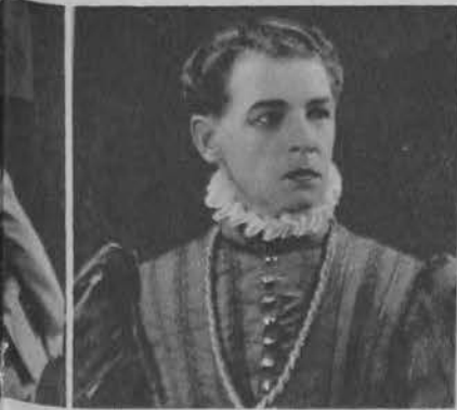
Juljusz Osterwa jako Don Carlos.