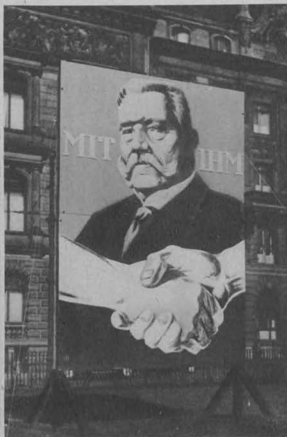
Z agitacji przed wyborami prezydenta Rzeszy Niemieckiej. Olbrzymi plakat z podobizną Hindenburga.