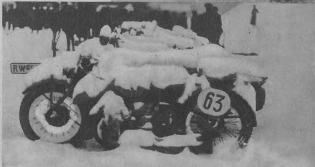
Na lewo: Konkurs wytrzyma- łości motocykli przez pozostawie- nie ich na noc dzia- łaniu zimna i śnie- gu. Rano odbył się konkurs szybkości przyrowadzenia ich do stanu użyt- kowego.