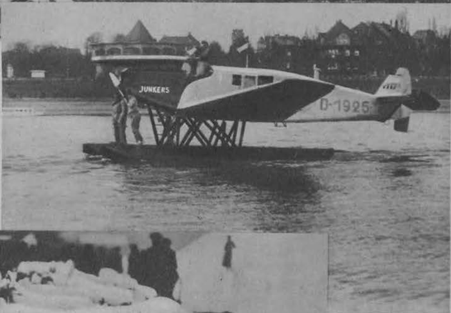
Na prawo: Kapitan niem. Bertram z za- łogą na swoim hydroplanie na Renie pod Kolonją przed lotem do wschodniej Azji.