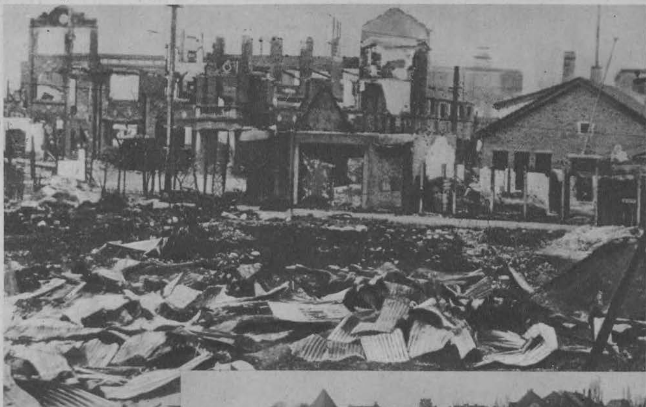
Ruiny chińskiego miasta Czapei po zdobyciu go przez japończyków.