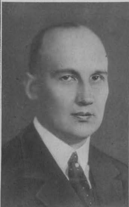
Szwedzki król zapalczany Ivar Kreuger popełnił samobójstwo.