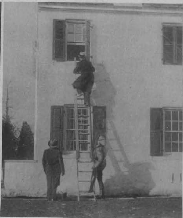
Policja rekonstruuje scenę uprowadzenia dziecka.