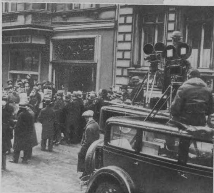
Ministrowie Rzeszy niemieckiej udają się do lokalu wyborczego.