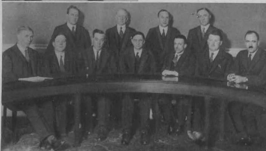
Na prawo: Nowy gabinet irlandzki de Valery, który po objęciu rządów, wydał natychmiast szereg radykalnych zarządzeń antyangielskich.