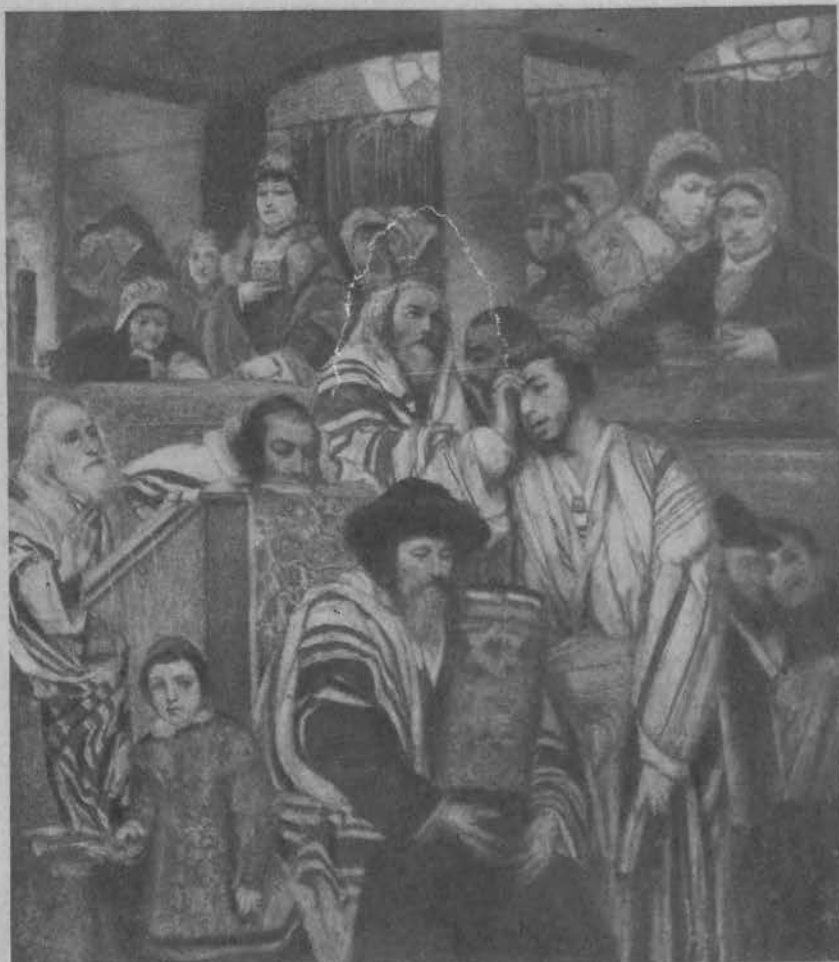
Żydzi modlący się. (Wł. Iwana Blocha, Zurych).