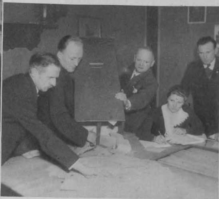
Liczenie kartek wyborczych rozpoczyna się.