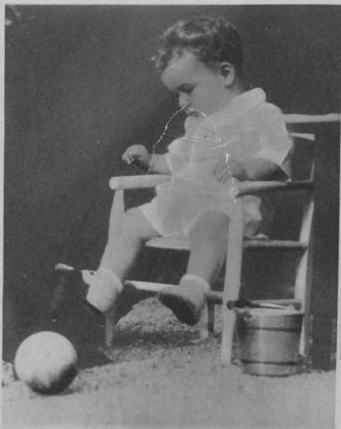
Jedno z ostatnich zdjęć dziecka.