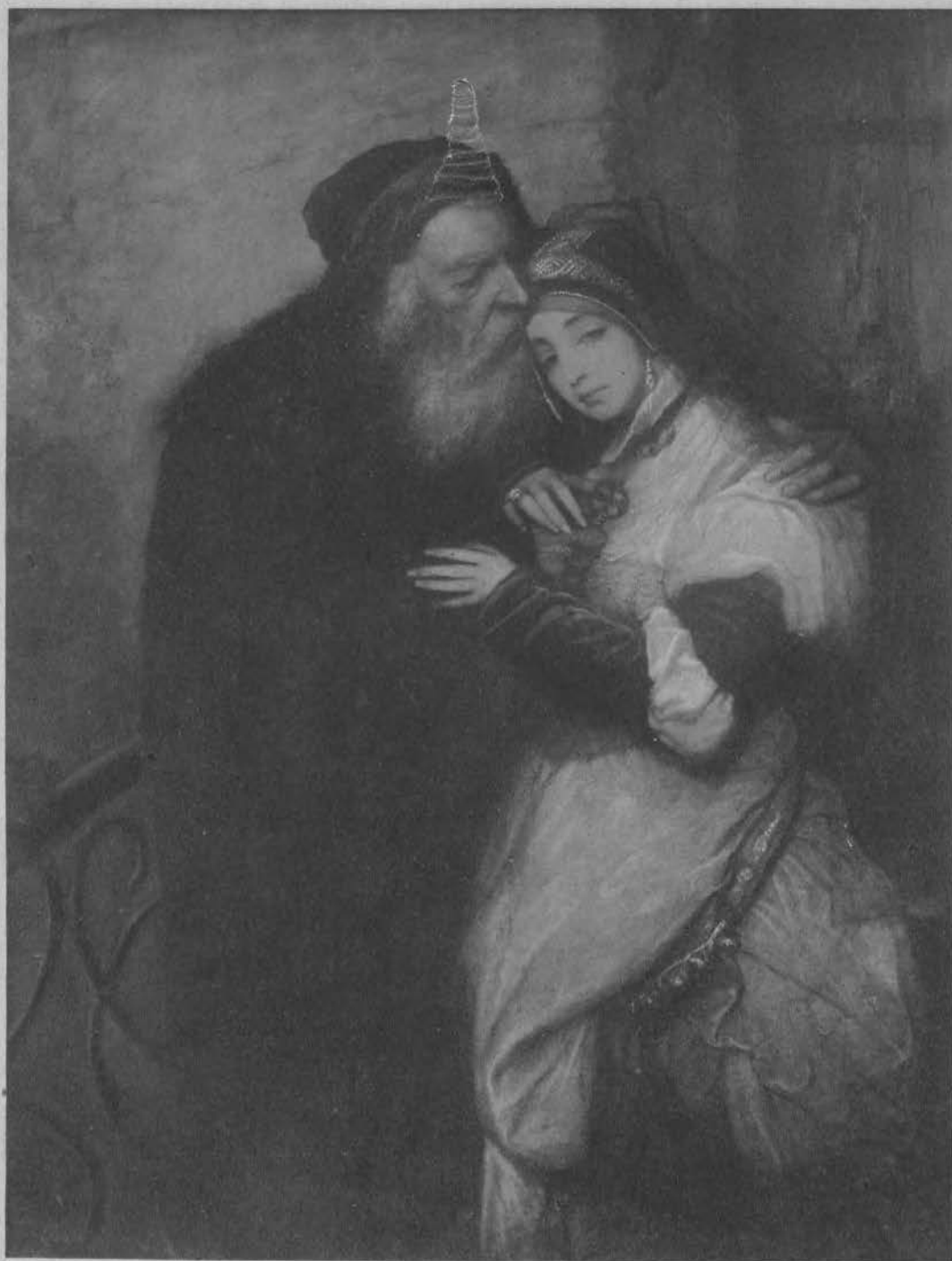
Shylok i Jessyka. (Wł. Z. Tabęckiej, Warszawa).

Na prawo: Druciarz. (Wł. Dra R. Beresa, Kraków).