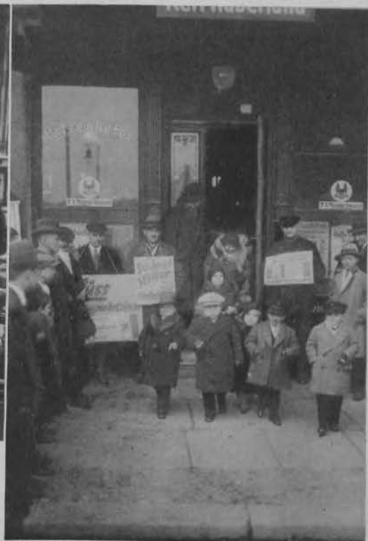
Na prawo: Grupa lilliputów po wypełnieniu swego obowiązku obywatelskiego.