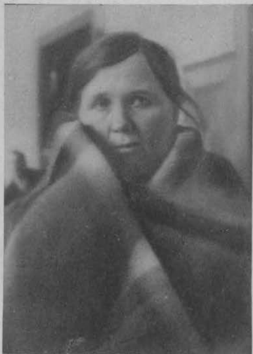
Pierwsza kobieta bandytka Helena Stójkowska skazana została na 5 lat ciężkiego więzienia.