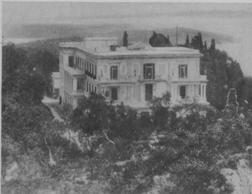
Na lewo: Były zamek cesarzowej Elżbiety a później ces. Wilhelma II, t. zw. Achilleion na Korfu, został przez rząd grecki zamieniony na hotel.