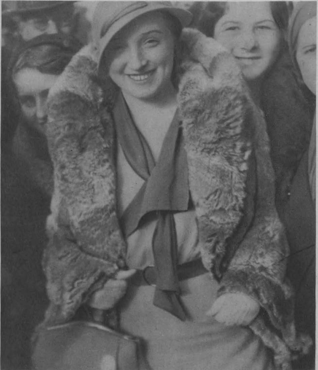
Hanka Ordonówna w Łodzi. Zdjęcia dokonano po koncercie przed salą Filharmonji.