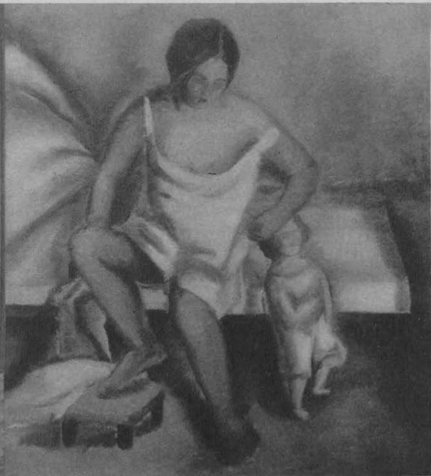
Z wystaw łódzkich: Jedno z dzieł Mane Katza i na lewo portret Picassa.