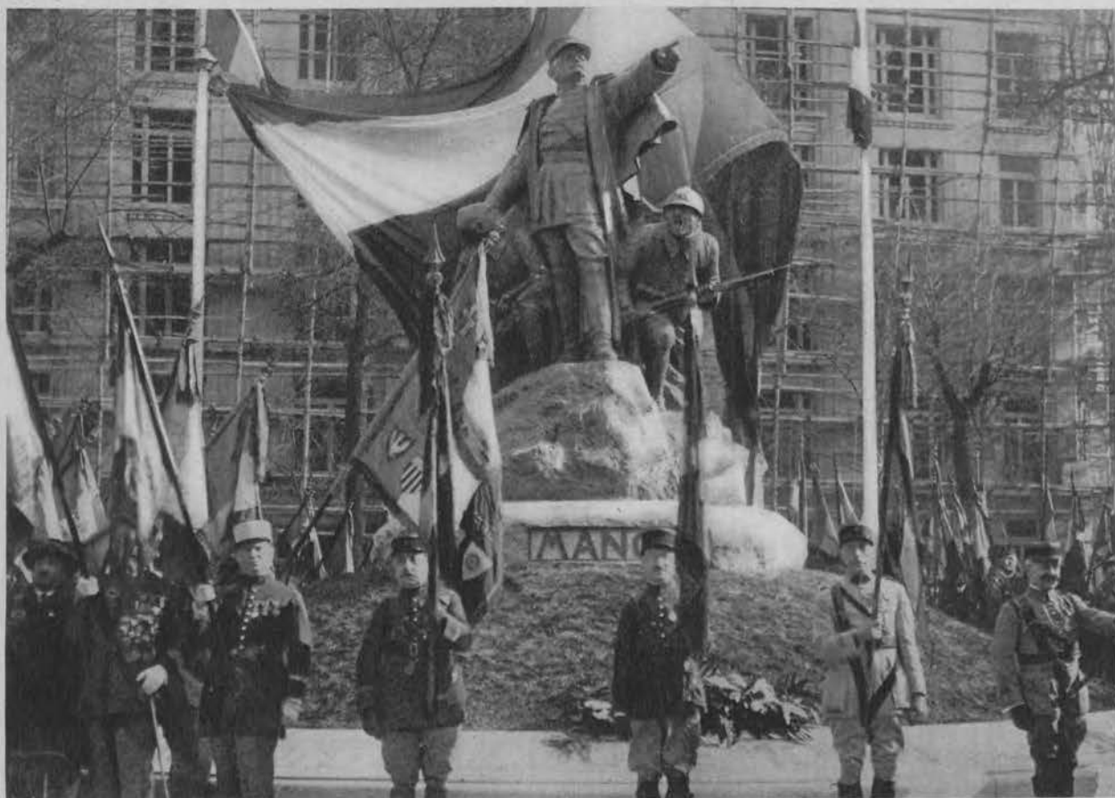
Odświeżenie pomnika generała Mangina na bulwarze de la Tour Maubourg, w Paryżu. Wśród wielu sztandarów na pierwszym planie zauważyć można zbiorowy sztandar państw obcych (widzimy m. in. Orła Polskiego.)