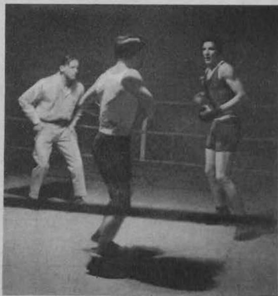
Najlepszy u gości Kuura wygrał zasłużenie z Kempą.