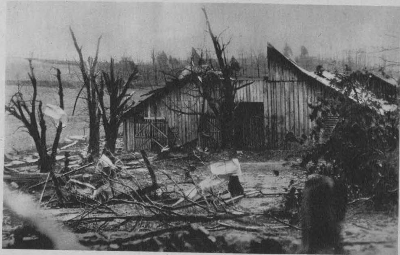
Na farmie am. po przejściu tornada.