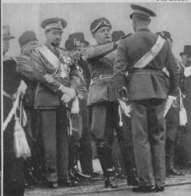
Mussolini dekoruje orderami lotników w 9-tą rocznicę założenia włoskiej obrony powietrznej.

Na lewo: Mistrz świata gry w bilard w N. Jorku. Poensgen w partii konkursowej zawodów.