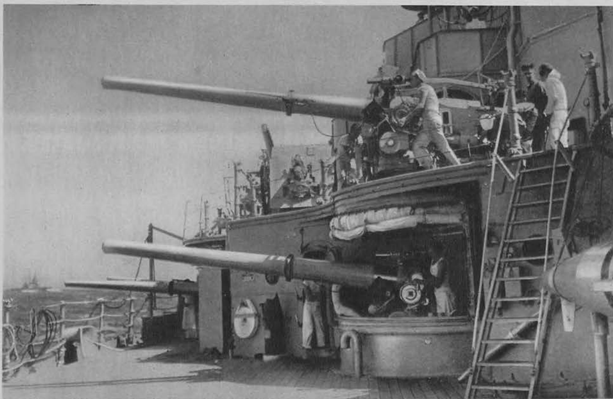
Momentalne zdjęcie z pancernika am. „Oklahoma”. Marynarze ćwiczą się w celowaniu z armat.