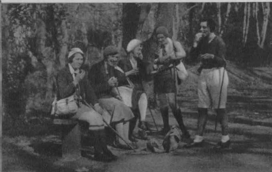
Pierwsza wycieczka wiosenna poza miasto angielskich dziewczątek.