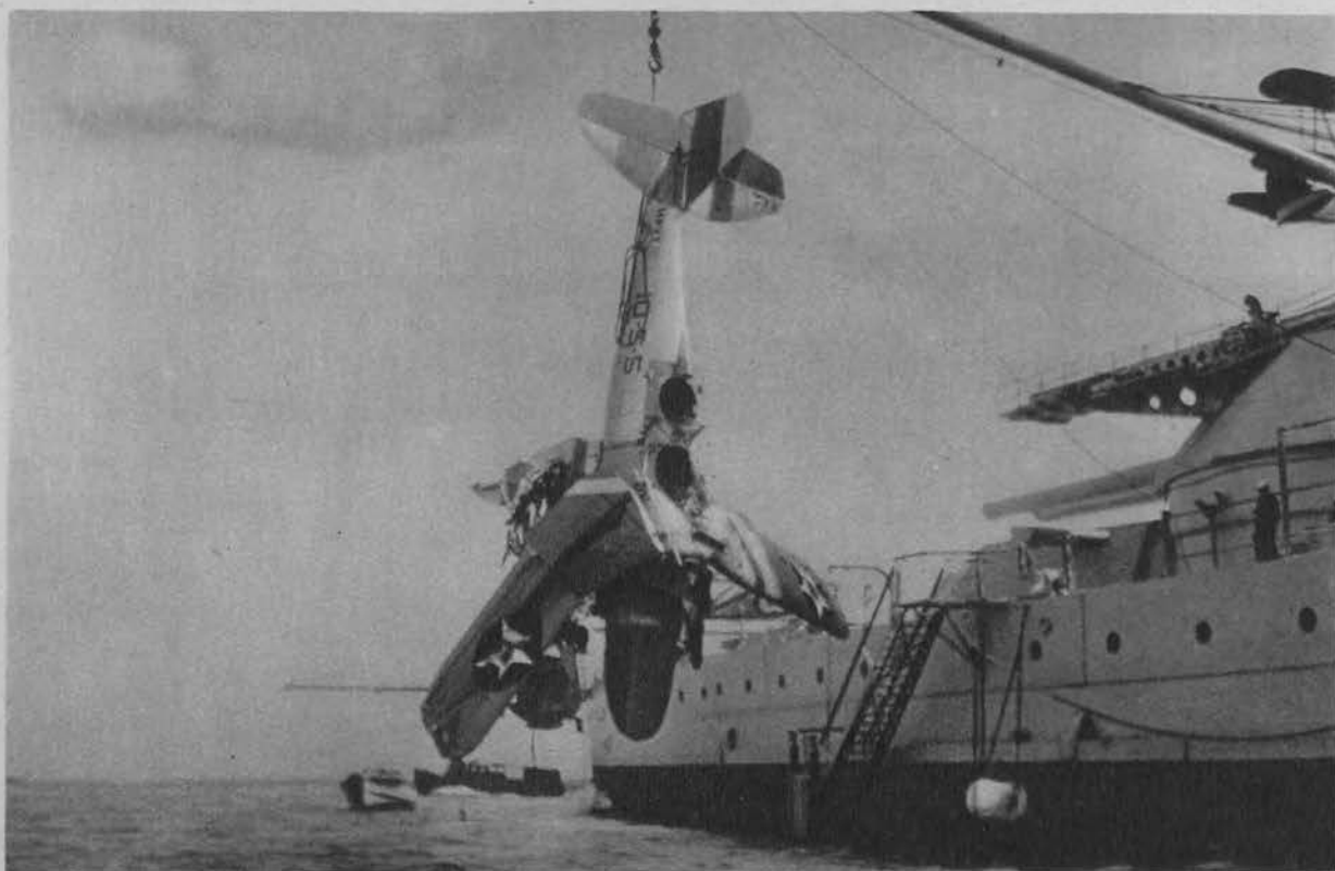
Nieszczęśliwy wypadek w czasie ćwiczeń am. floty wojennej koło wysp Hawaj. Ciężko uszkodzony samolot z eskadry wojennej wyciągnięty z morza po zderzeniu się z innym.