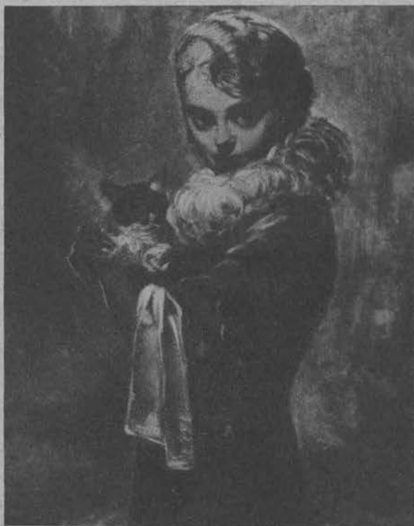
Portret żony artysty.