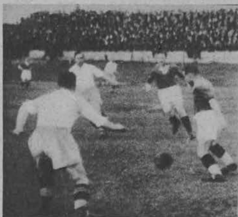
Na lewo i na prawo: Dwa emocjonujące momenty walki o piłkę.