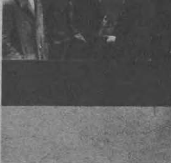
W Niemczech, dzieci wstępujące po raz pierwszy do szkoły otrzymują książeczki zdrowia w których przez cały okres nauki notują lekarze szkolni stan zdrowia uczniów. Badanie malca.