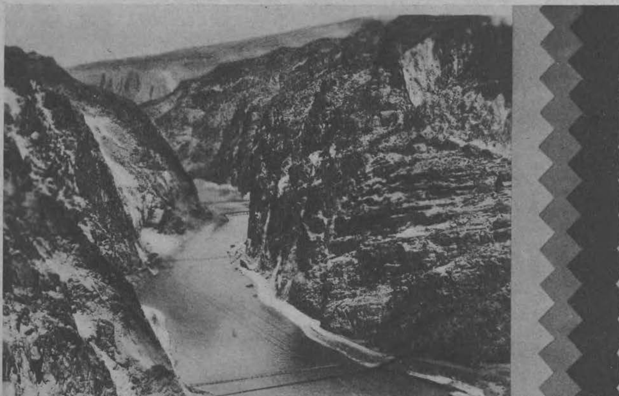
Jar rzeki Colorado w Stanach Z. Am., w którym ma powstać gigantyczna tama Hoovera, wysoka na 223 m., która rocznie dostarczać będzie 4 miljardy kilowatów prądu elektrycznego.