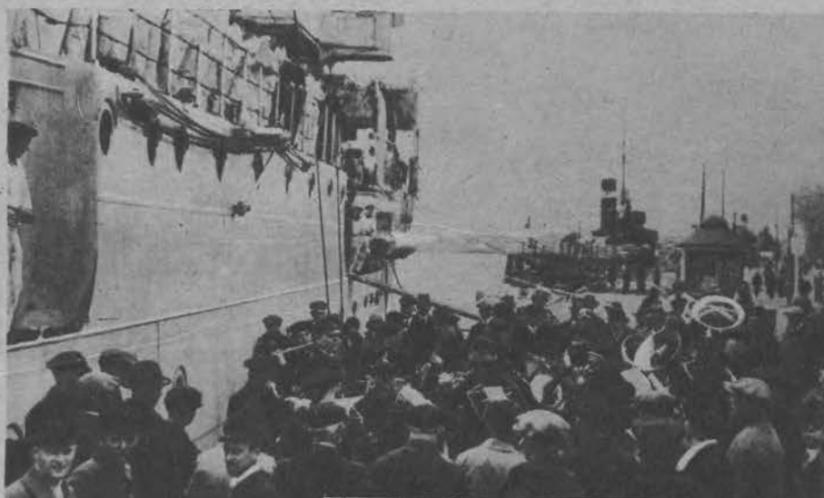
Uroczysty przegląd floty w Świnoujściu. Kapela okrętu „Königsberg“ przygrywa wesołe melodje.