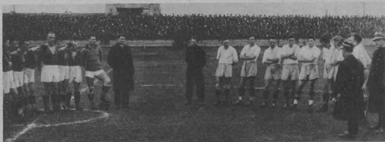
Obie drużyny po powitaniu z prezesami na czele.