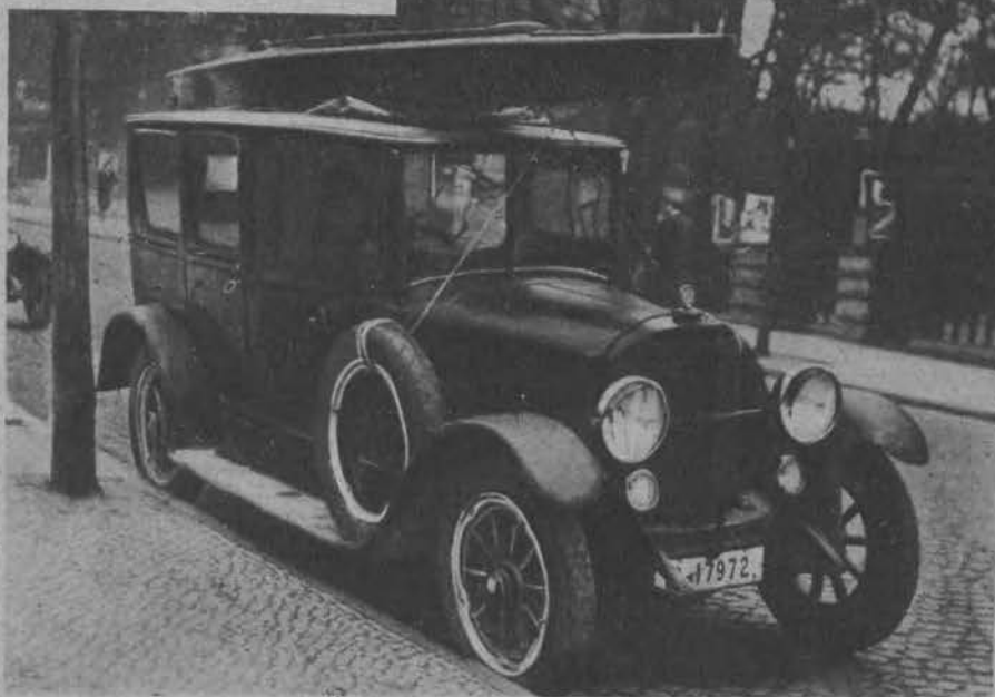
Sezon kajakowy zaczął się. Przygodny obrazek auta, którym właściciel przewozi swój kajak.