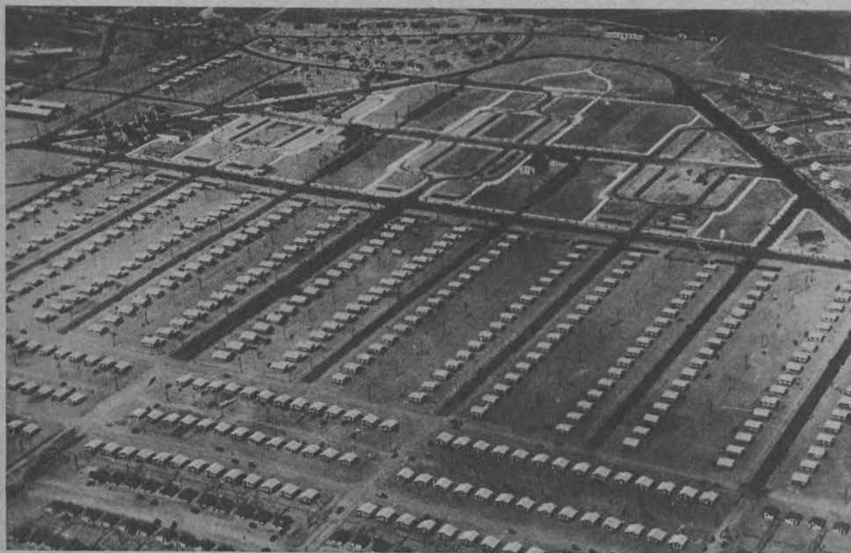
Widok kolonji robotników pracujących koło budowy tamy Hoovera.