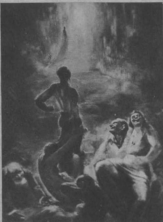
Na prawo: Dążenia.