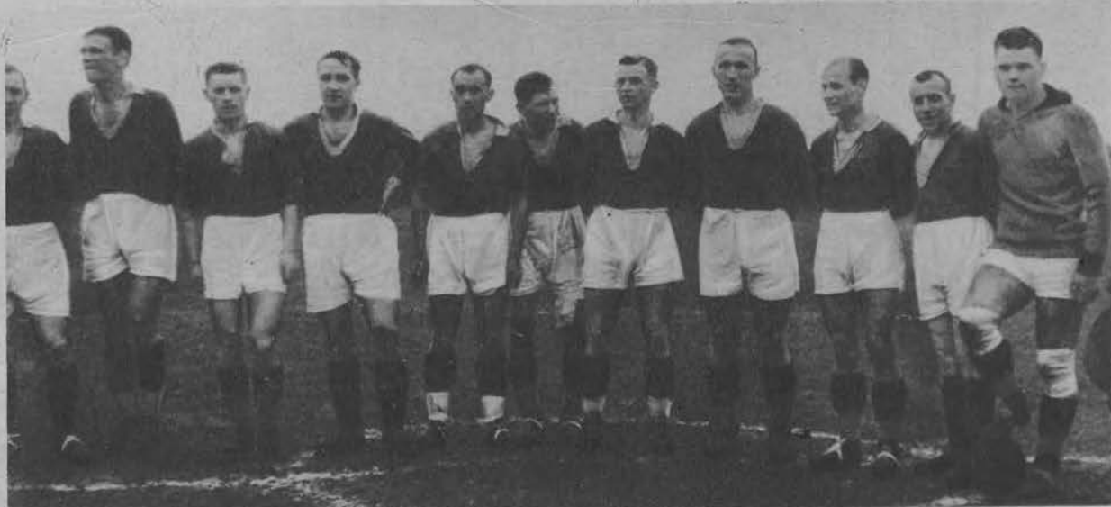
Ł. K. S. w pełnym składzie zwyciężył 22 pp. 4:1.