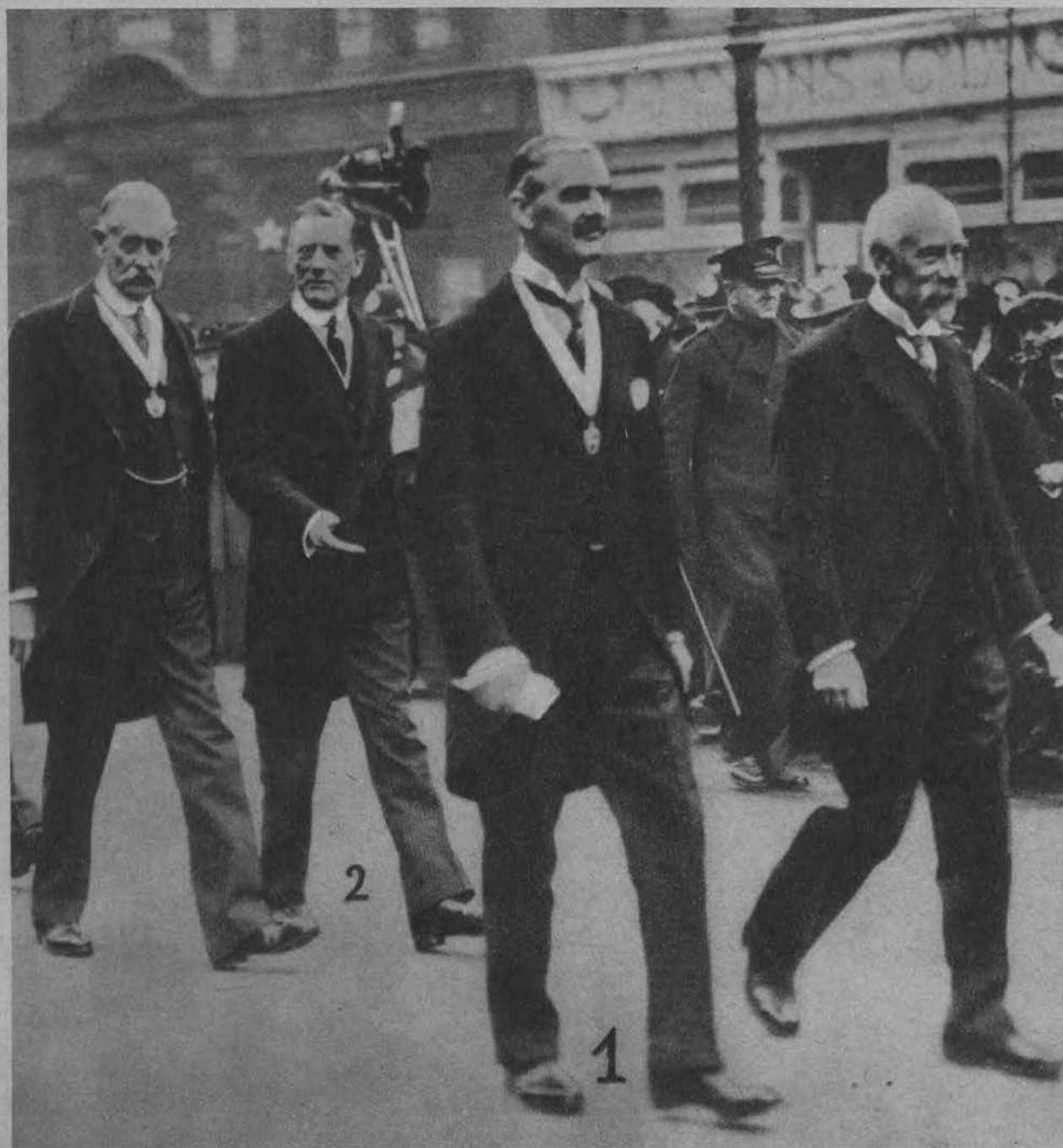
Ang. min. skarbu Neville Chamberlain (1) z bratem Austen'em Chamberlainem długoletnim ministrem spraw zagr. w drodze z magistratu miasta Birmingham, gdzie wręczono mu uroczyste dyplom honorowego obywatela miasta. Z prawej str. burmistrz miasta Birmingham.