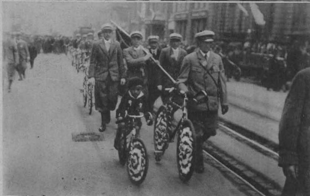
Najmłodszy uczestnik pochodu.