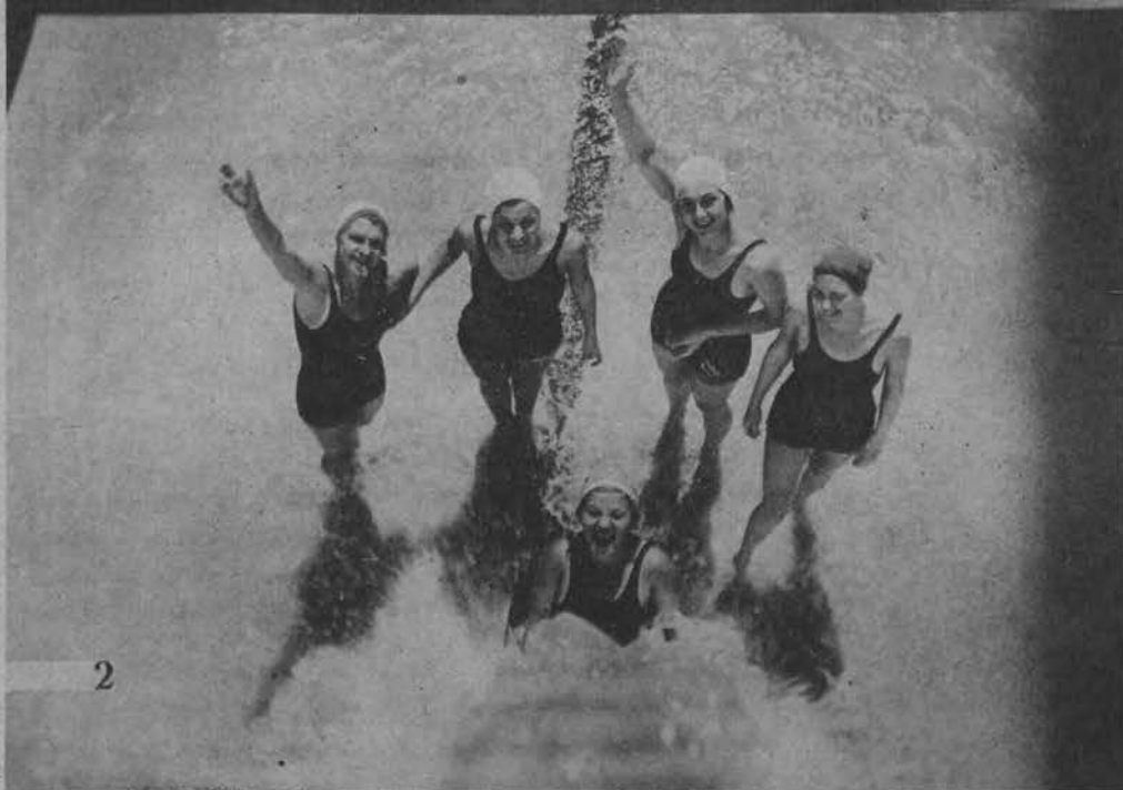
2. Pływaczki am. oceanicznego wypełnienia