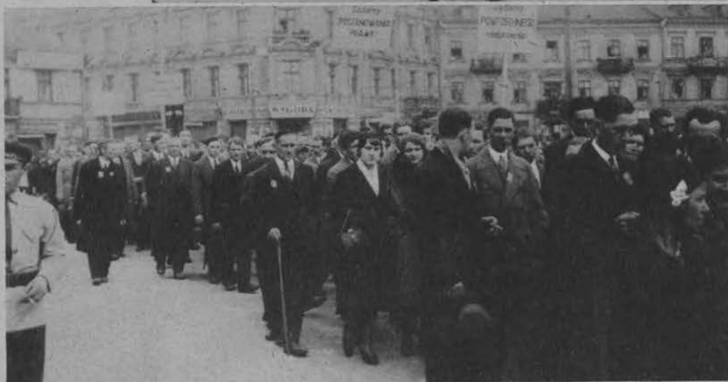
Na lewo: Pochód socjalistyczny przechodzi przez plac wolności w drodze na Polesie Konstantynowskie.