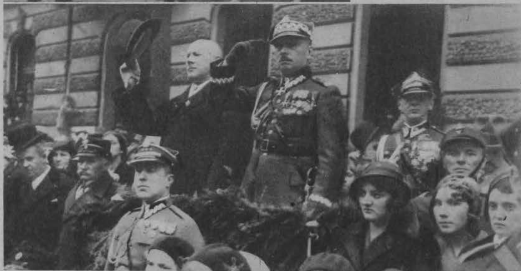
Wojewoda Jaszczółt i gen. Małachowski przyjmują defiladę.