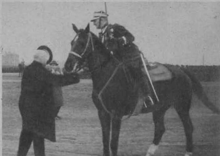
Woj. Jaszczółt pozdrawia gen. Olszynę-Wilczyńskiego na placu rewji.