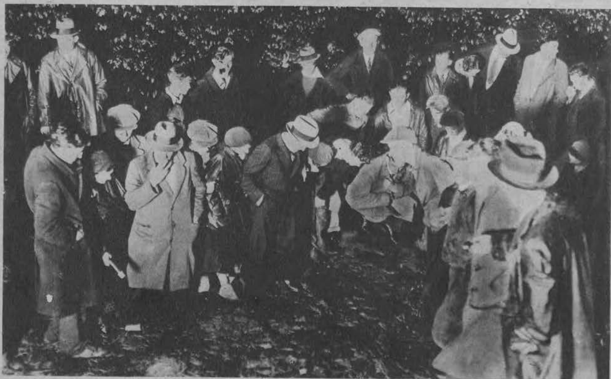
Miejsce gdzie zwłoki synka Lindbergha zostały znalezione, otoczone detektywami i dziennikarzami.