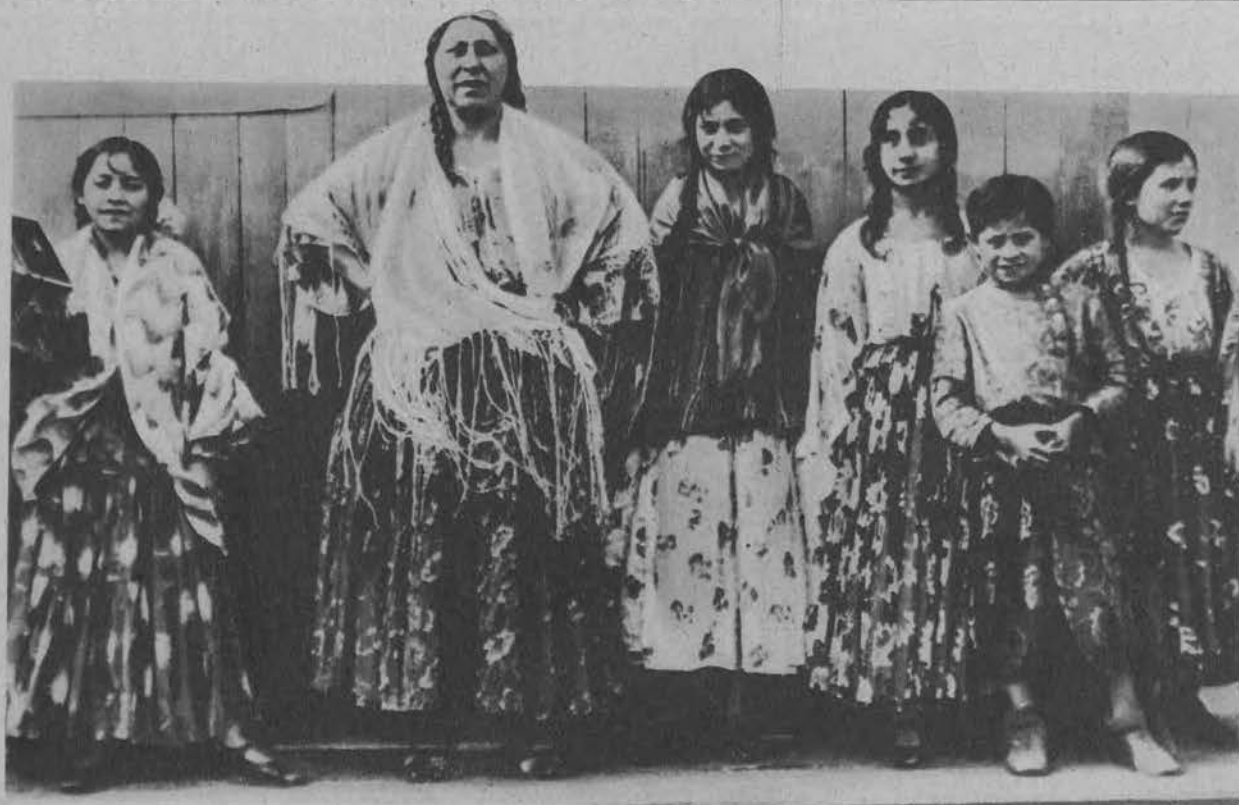
Cyganki w Łodzi popisują się w Luna Parku.