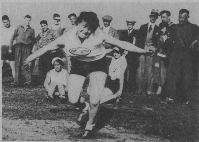
Wajsówna w chwili rekordowego rzutu dyskiem (40, 39 m)