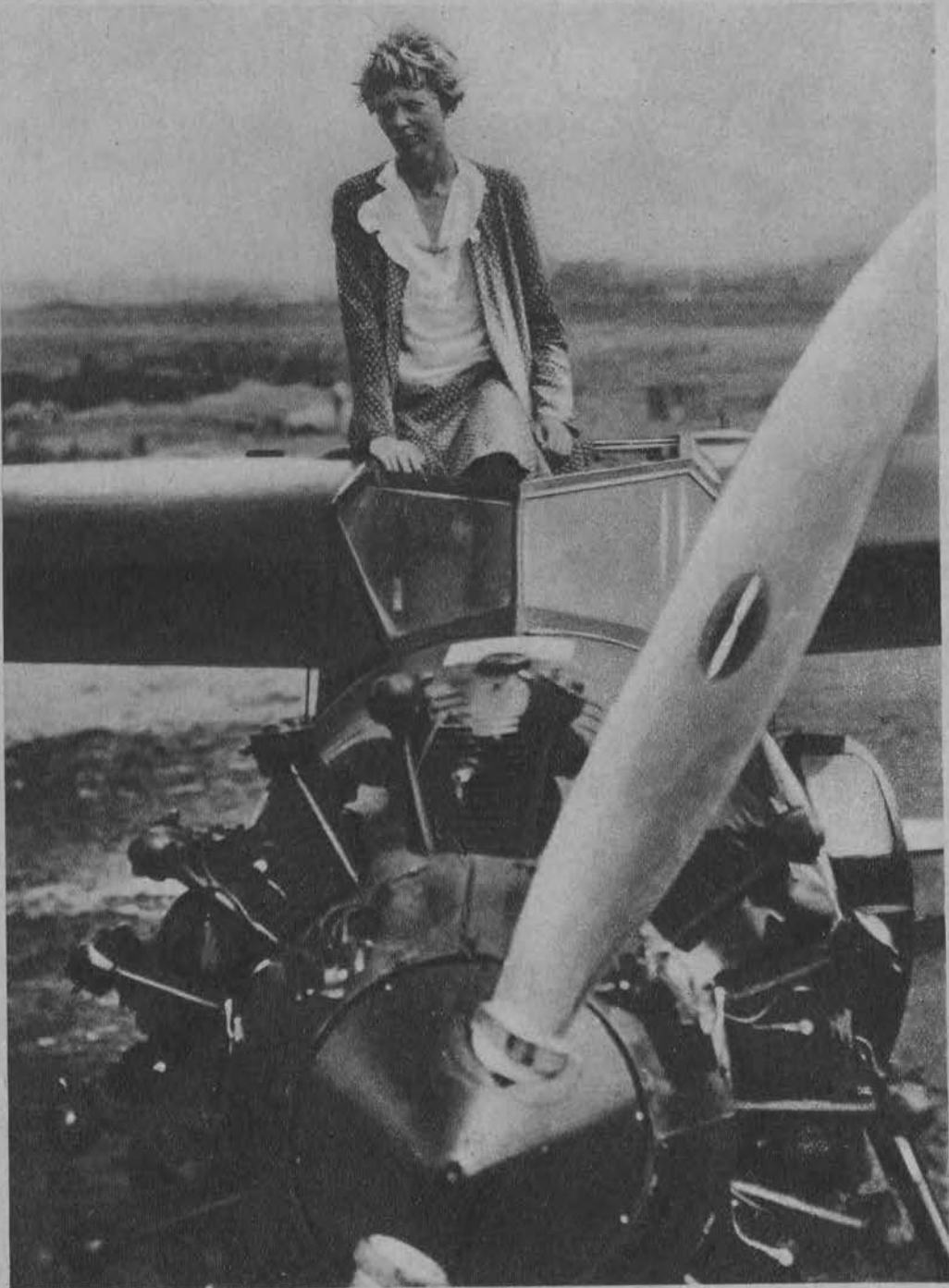
Am. lotniczka Amelia Earhart pierwsza kobieta która przeleciała samotnie Atlantyk.