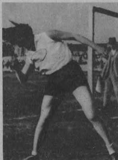
Wajsówna w rzucie kulą.