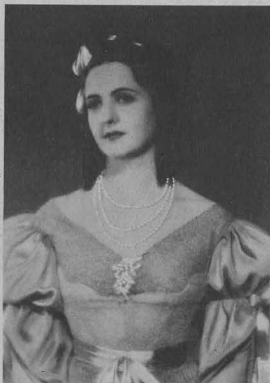
Jadwiga Smosarska w roli tytułowej.