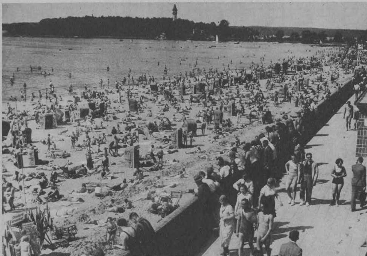
Tak wyglądała plaża na jeziorze Wannsee pod Berlinem w Zielone Świąta.