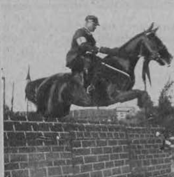
wykazały wśród naszych oficerów wspaniałą technikę jeźdźca i konia.