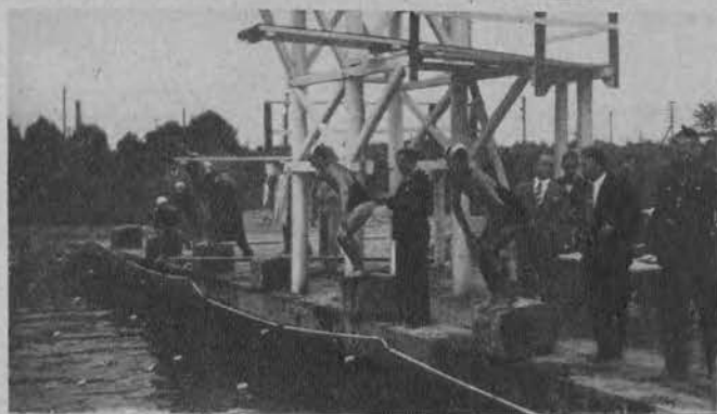
Zawody pływackie w basenie Ł. K. S. Start do biegu na 300 m.