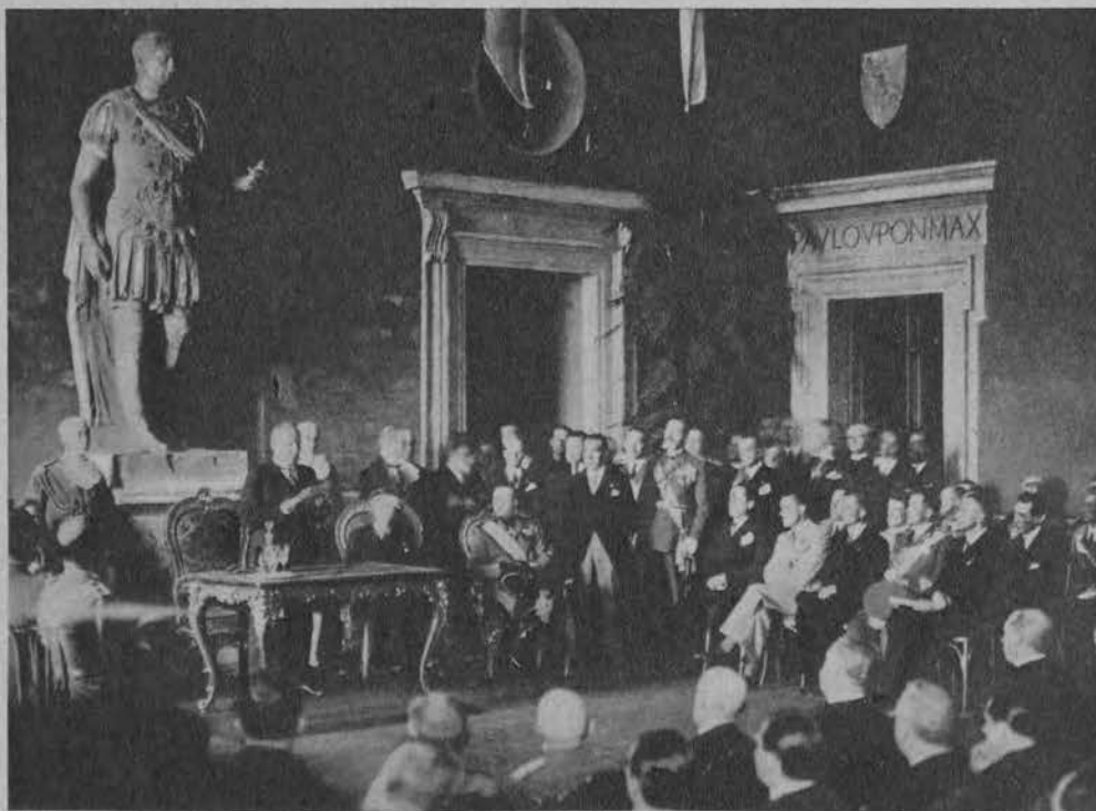
Na lewo: Kongres zdobywców Oceanu w Rzymie. Mussolini pozdrawia lotników w imieniu rządu.