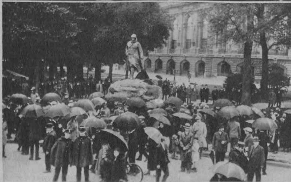
Na lewo: Odślonięcie pomnika Clemenceau w Paryżu, odbyło się prawie po cichu, ponieważ krewni wnieśli opozycję przeciw wystawieniu, źle wykonanego i niepodobnego pomnika.