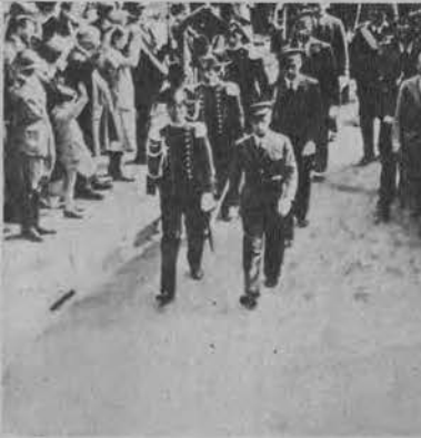
Pogrzeb węgierskiego lotnika oceanicznego Endresza w Rzymie w którym wziął udział Mussolini z przybyłymi na kongres lotnikami.