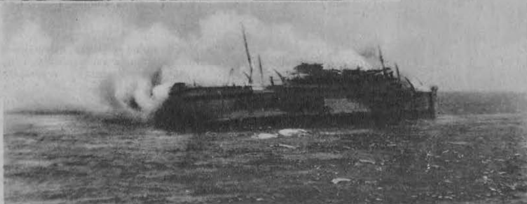
Na prawo: Płonący okręt George Philippar w którym około 60 osób straciło życie.