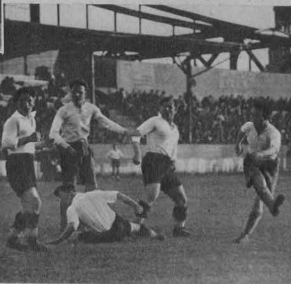
Interesujący moment z meczu „Garbarni“ w Berlinie przeciw klubowi „Hertha“.