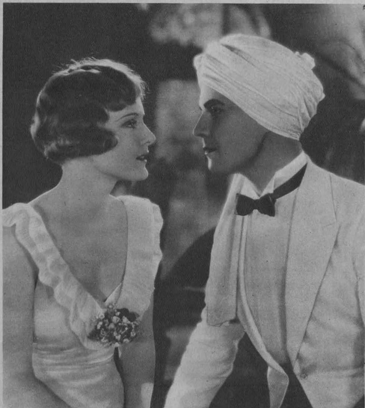
Ramon Novarro i Madge Evans w filmie „Syn Indyj”.