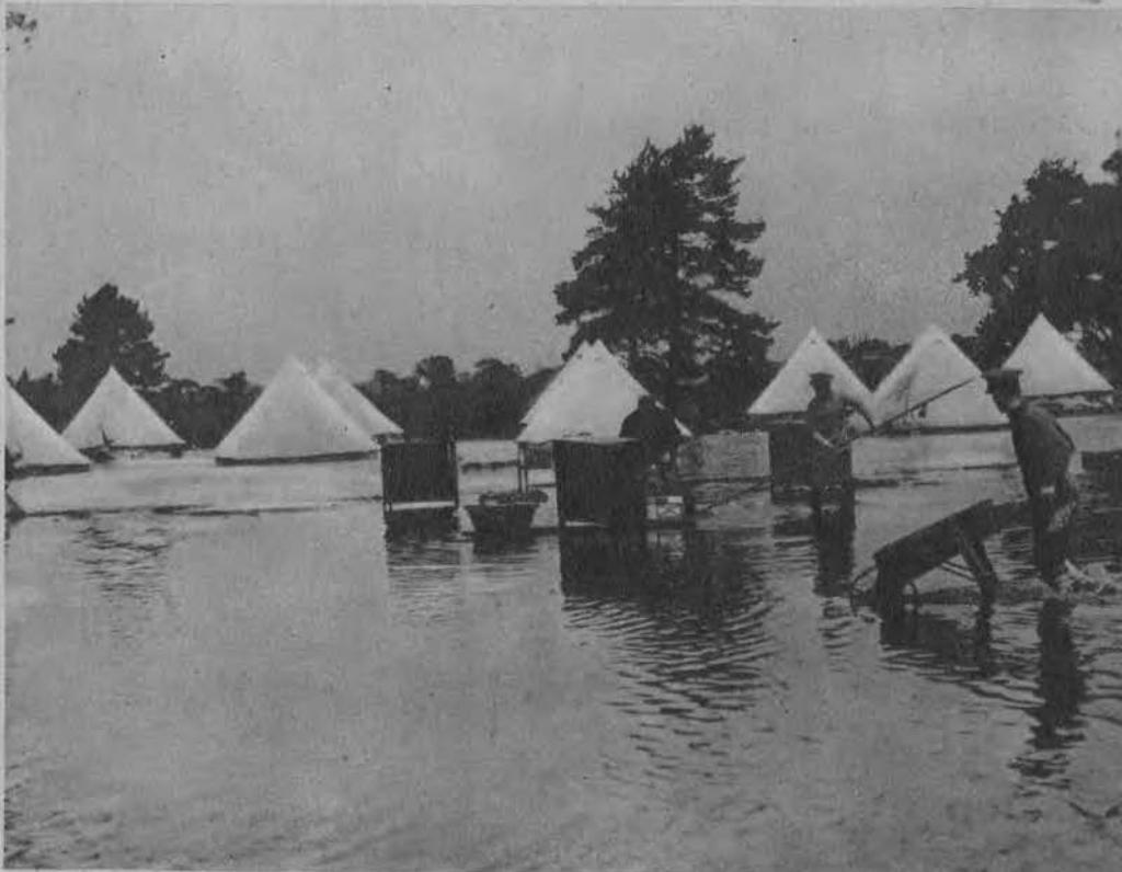
Na lewo: Obrazek z powodzi w Anglii. Nagły przypływ wody zalał biwakujących w namiotach żołnierzy, którzy tymczasem pospieszyli z pomocą ludności cywilnej przewożąc rzeczy w bezpieczne miejsce.