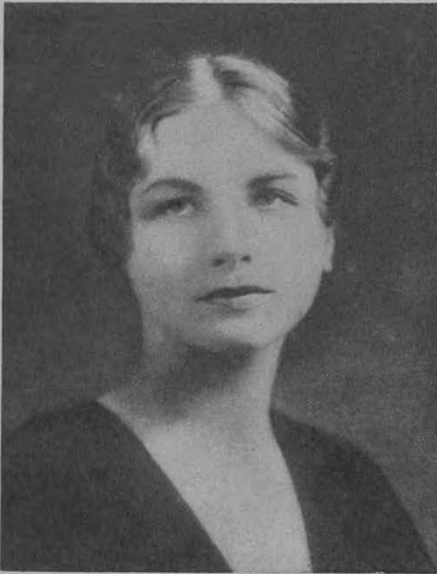
Mistrzyni świata w tenisie Helena Wills-Moody.