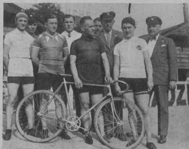
Na lewo: Grupa kolarzy łódzkich, która brała udział w zawodach o mistrzostwo.