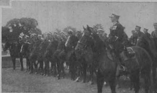
Na prawo: Defilada jeźdźców przed zawodami.