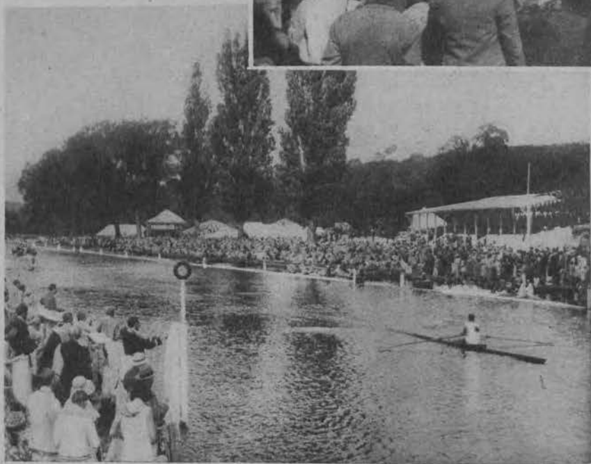
Zdjęcie z wielkich regat w Henley.

Na prawo: W tych dniach ludność Francji obchodzi 250-tą rocznicę narodzin szampana t. j. w tym roku mija 250 lat od czasu jak dom Perignon wynalazł sposób fabrykacji i konserwacji win musujących.