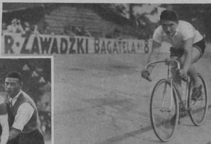
Einbrod na torze warszawskim.