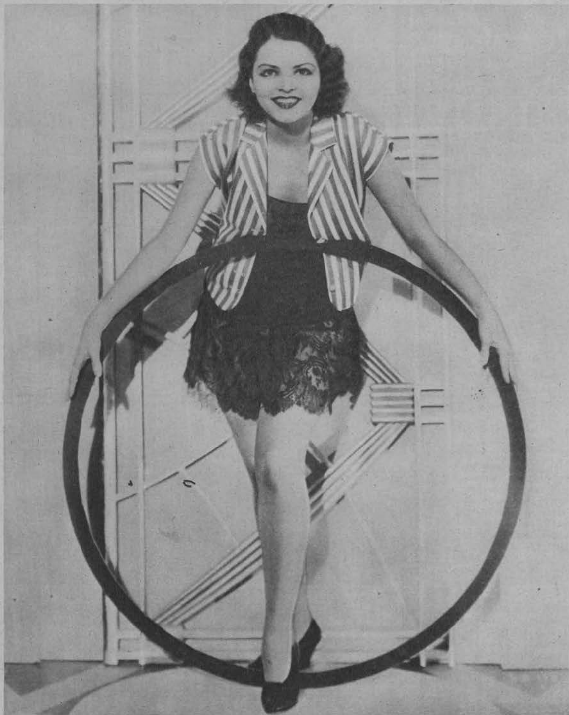
Nowa gwiazda filmowa Lillian Bond, z zapałem ćwiczy się w skakaniu przez koło