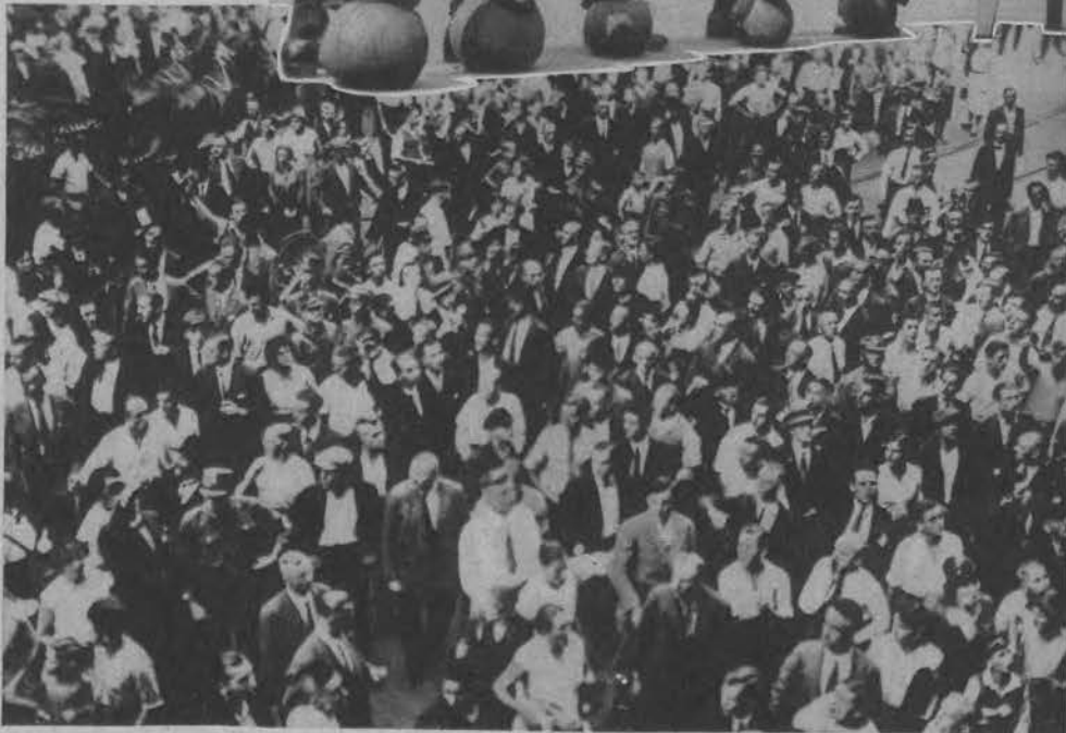
Na lewo: Tłumy demonstrantów przed budynkiem sądu w Bytomiu po ogłoszeniu wyroku śmierci na pięciu bandytów w procesie Piecucha.