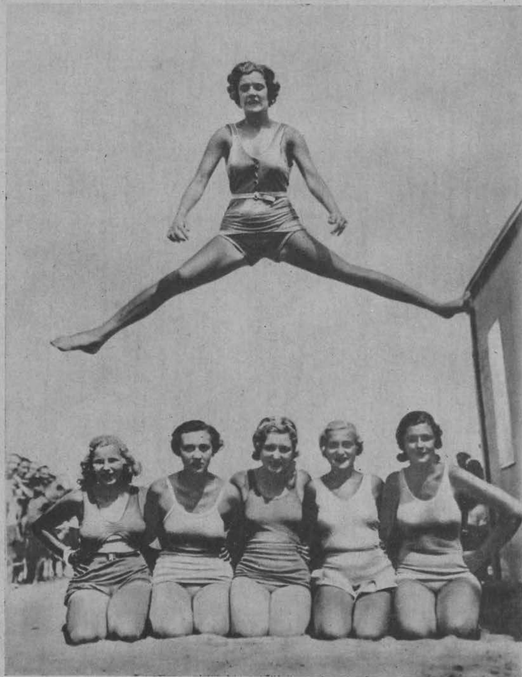
Am. tancerka popisuje się na plaży wspaniałymi skokami.