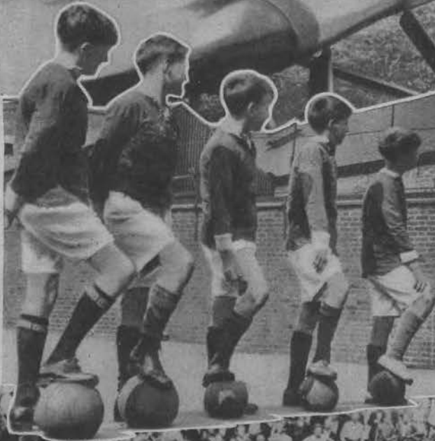
Teoretyczny wykład gry w piłkę nożną w angielskiej szkole, w jaki sposób można najłatwiej zdobyć bramkę.