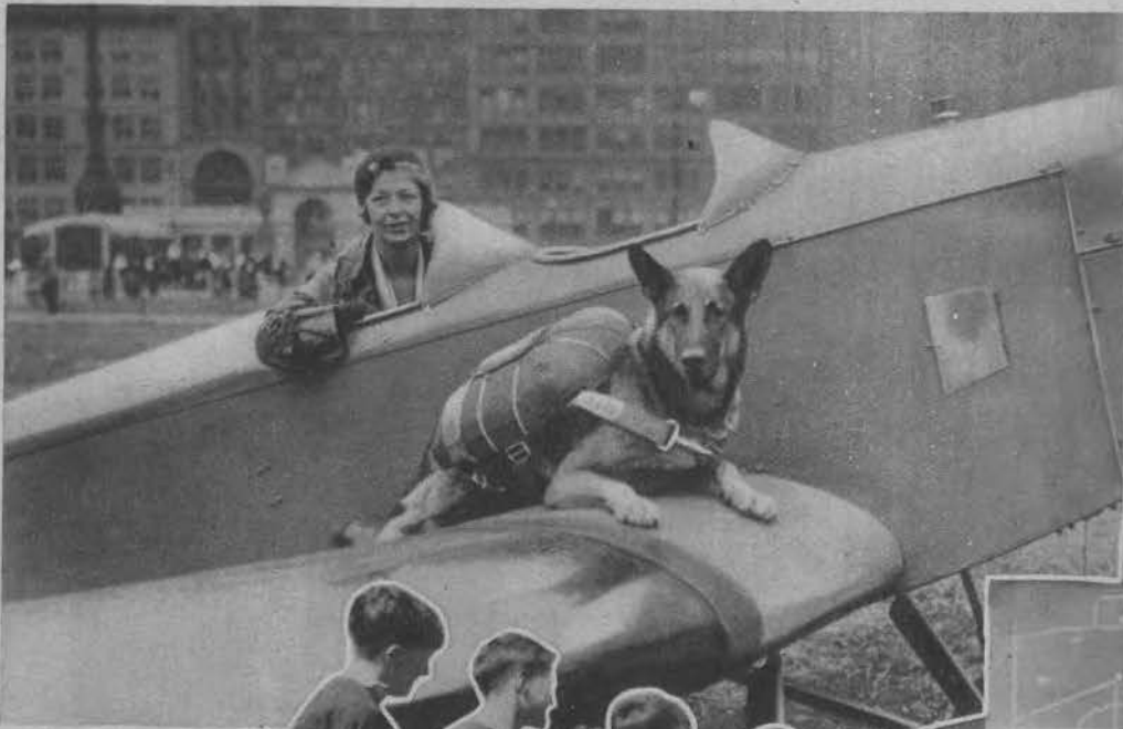
Amerykańska lotniczka Elinor Smith przed startem na lotnisku Ohrenmühle do próby skoku psa ze spadochronem. Eksperyment wypadł pomyślnie.