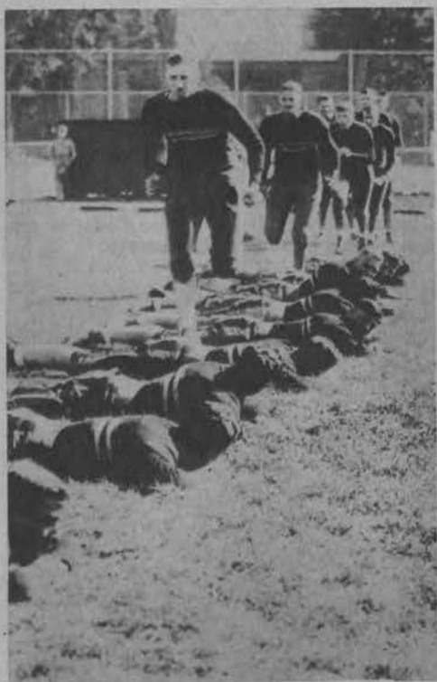
Trening członków drużyny „rugby”. Wzajemne dreptania się, wyrabia wkrótce u wszystkich lekki chód.