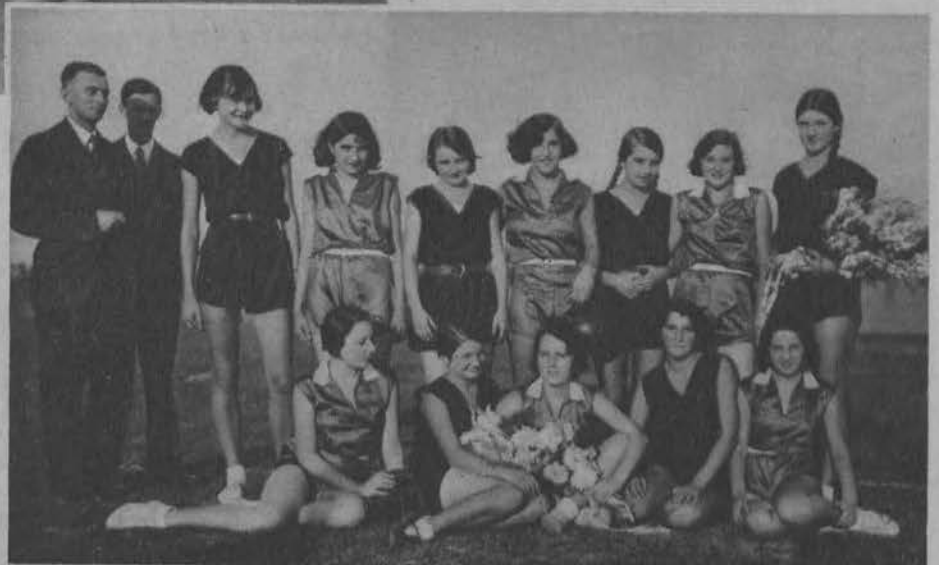
Drużyny siatkówki gimnazjum Sobolewskiej i gimnazjum Szczanieckiej wzięły udział w festiwalu akademickim.