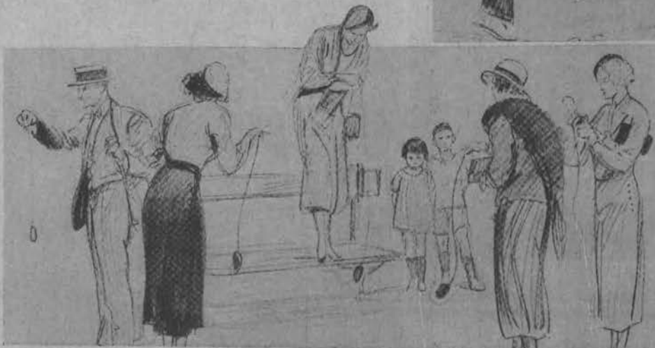
Egzotyczni szampioni Yo-Yo popisują się swymi fenomenalnymi sztuczkami.