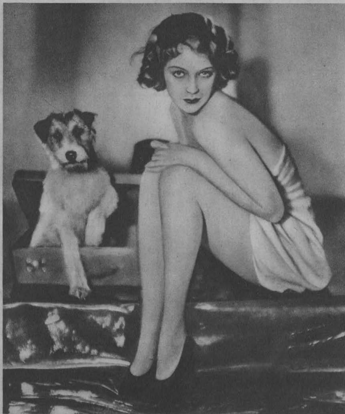
Kobieta i pies