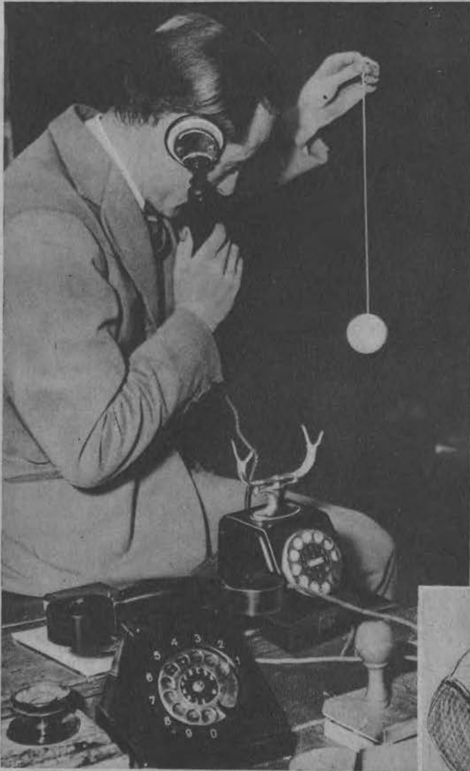
Nawet w biurze przy pracy nie jest „Yo-Yo“ przeszkodą.