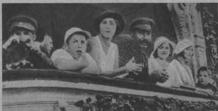
Wyścigi konne w Moskwie. Generał Budienny z rodziną w łoży.