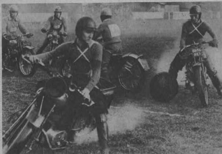
Moment z turnieju „polo” na motocyklach w Paryżu.