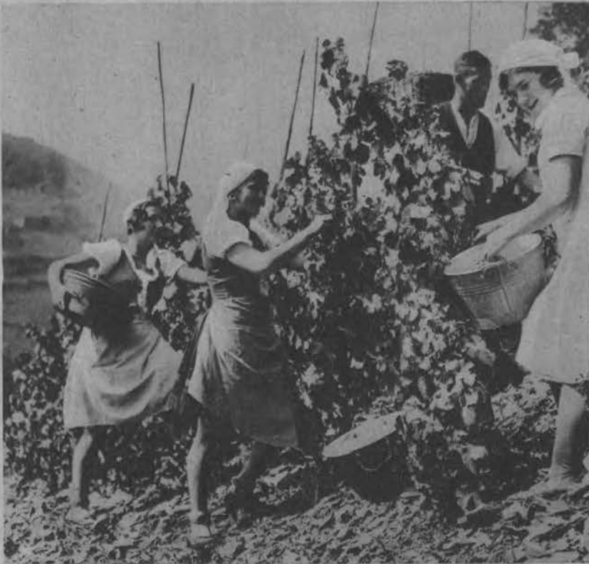
Scena z winobrania nad Renem.