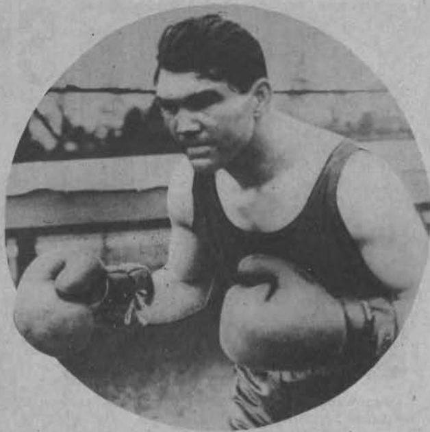
B. mistrz świata Schmeling (w kole na prawo) i Mickey Walker walczyli w N. Jorku o prawo walki z obecnym mistrzem Sharkeyem. Zwyciężył Schmeling.