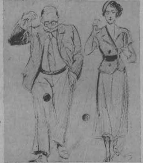
Fanatyczni zwolennicy Yo-Yo w Paryżu ćwiczą się nawet na ulicy.