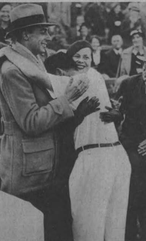
Zawodowy tenisista francuski Plaa pada z radosnym okrzykiem w ramiona swej żony, po sensacyjnym zwycięstwie nad Tildenem.