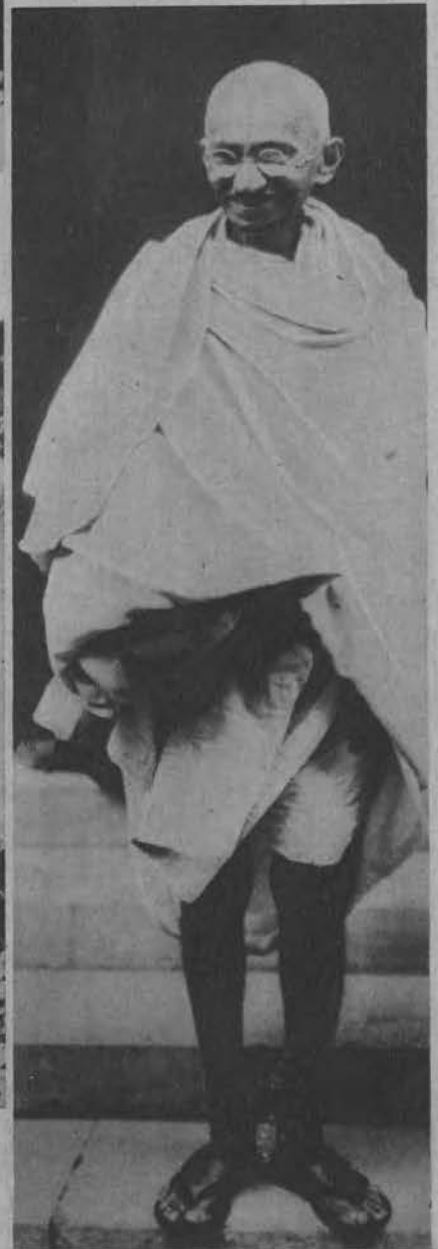
Na prawo: Mahatma Gandhi ku zadowoleniu całego świata zakończył głodówkę.