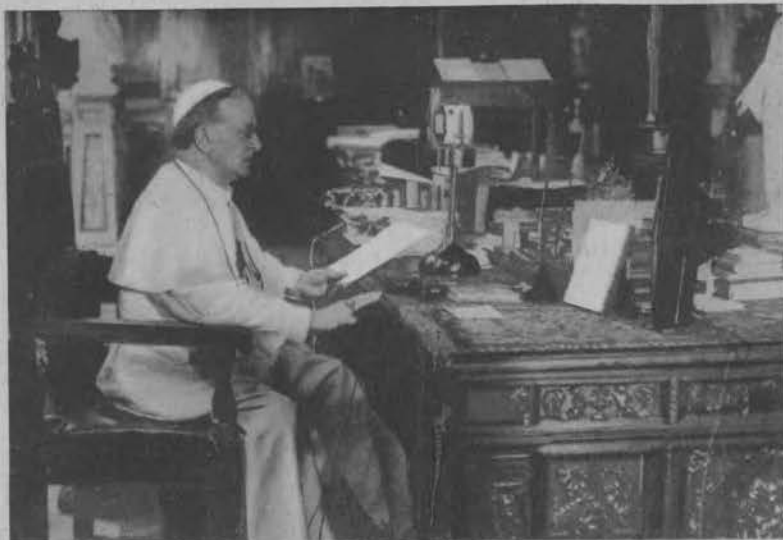
Ojciec Święty przed mikrofonem radjowym przemawia w dzień wigilii do wiernych.

Na prawo: Tom Sellers skacze z 40-metrowej wieży do basenu Biltmore w Miami (Floryda).