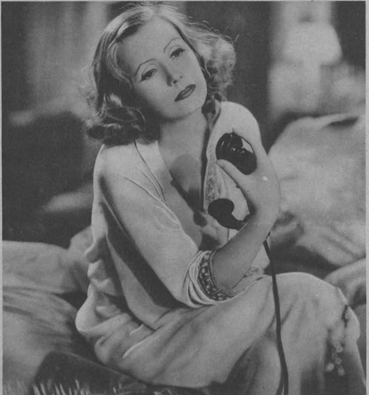
Greta Garbo ciągle jeszcze nie rezygnuje ze stanowiska „królowej ekranu“. Oto jej zdjęcie w roli tancerki Gruzińskiej z filmu „Ludzie w Hotelu“ wg. powieści Vicki Baum.