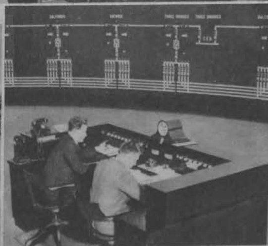
Linja Kolejowa Londyn-Brighton została zelektryfikowana. Stację kontrolną tej linii obsługuje tylko dwu ludzi. Jasne linje wskazują miejsca, gdzie znajdują się pociągi.