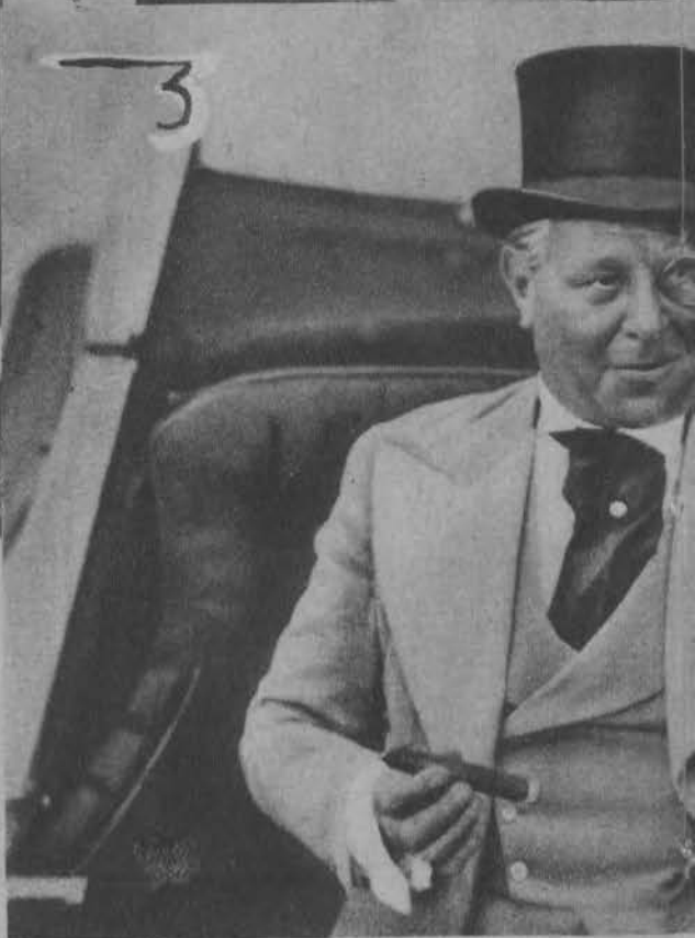
Na prawo: Emil Jannings jedzie na bal — wystarczy spojrzeć na jego zadowolone oblicze.