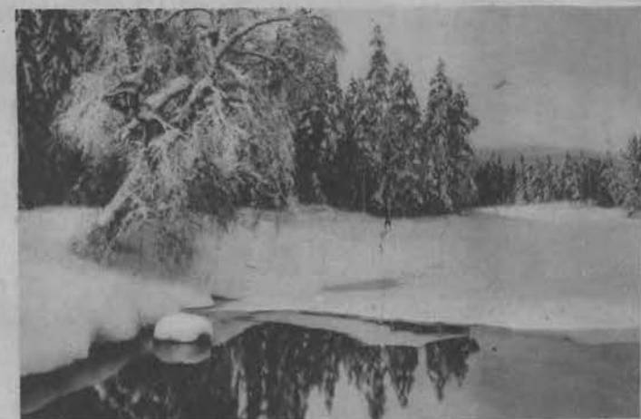
Uroczy obrazek z gór norweskich.