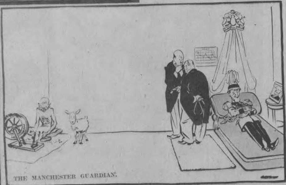
THE MANCHESTER GUARDIAN.

Przepowiednie na 1933 r. Lord Willington z polecenia MacDonalda rozpocznie strejk głodowy, aby zmusić Gandhiego do przyjęcia nowej konstytucji dla Indji.