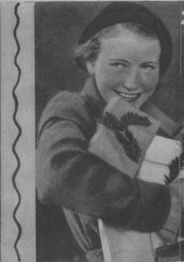
U góry na prawo: Obładowana podarunkami noworocznymi powraca młoda dziewczyna ze sprawunków.