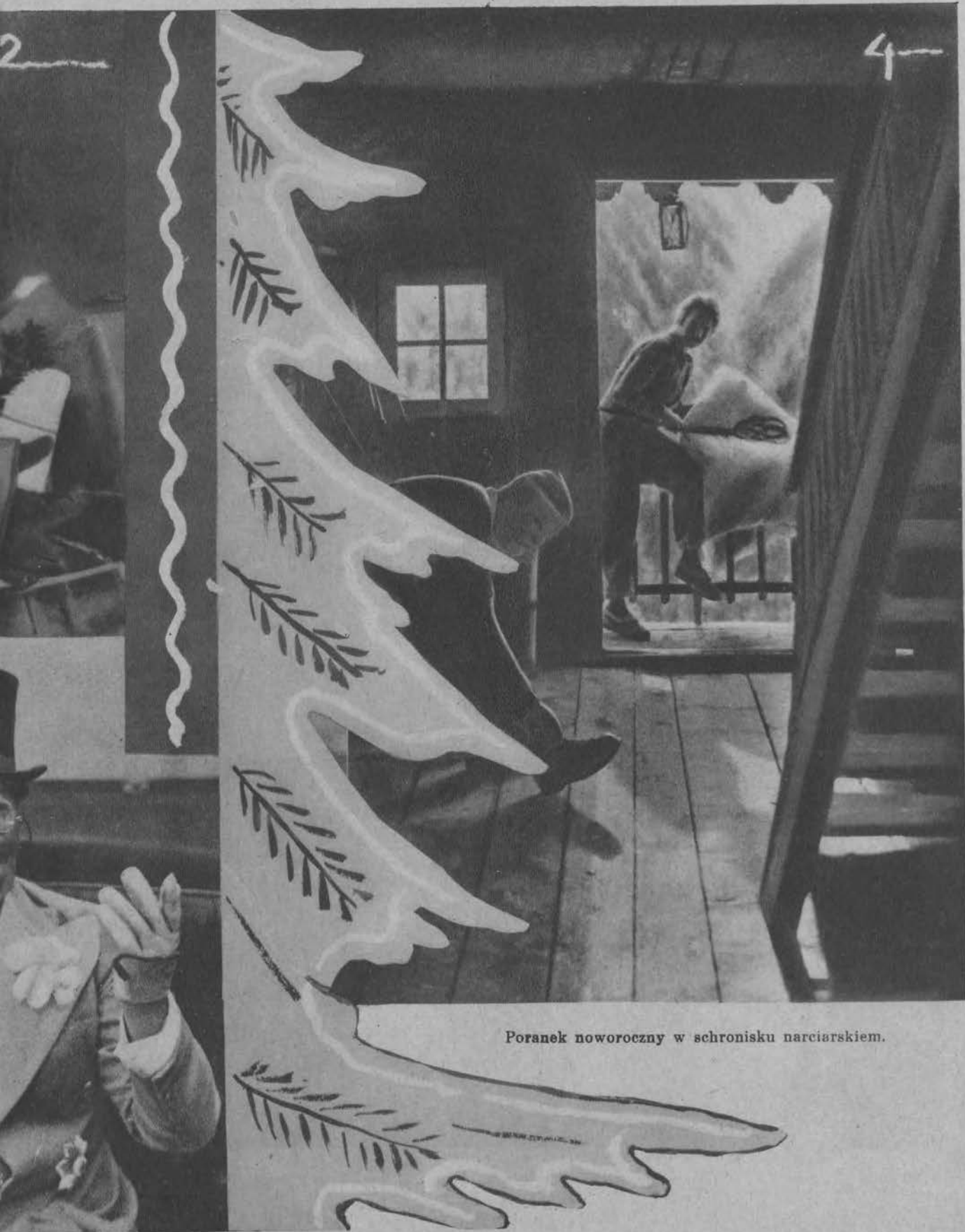
Poranek noworoczny w schronisku narciarskiem.