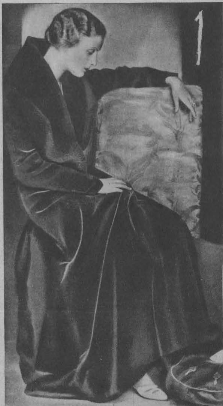
U góry: Piękna dama po powrocie z balu sylwestrowego duma nad swymi przeszłymi i ... przyszłymi przeżyciami i podbojami.