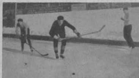
Wypad na bramkę.