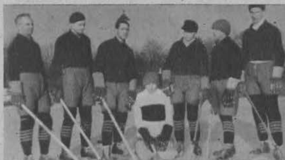
Na lewo: Drużyna „Unionu”.