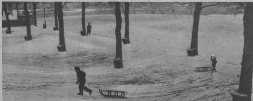
W berlińskim parku miejskim wyłożono drzewa workami z sianem, celem zapobieżenia nieszczęśliwym wypadkom.