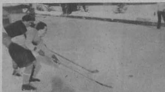
Walka o krążek.