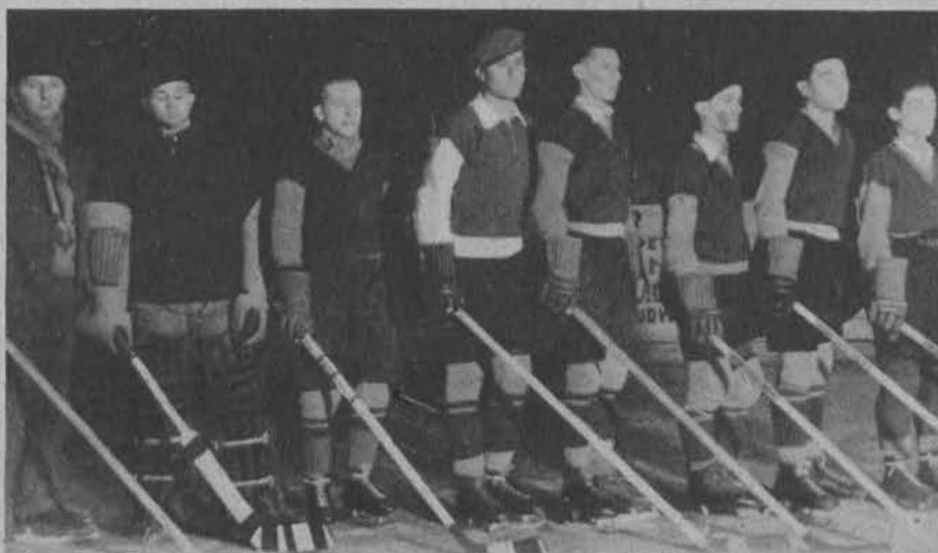
Na lewo: Warszawska drużyna hokejowa „Skra” zwyciężyła w Łodzi drużynę Ł. K. S.