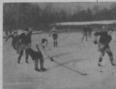
Na prawo: Kto pierwszy?