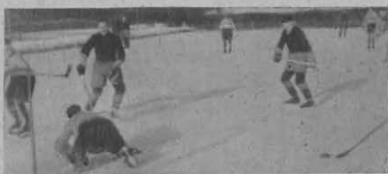
Skuteczna obrona bramki.