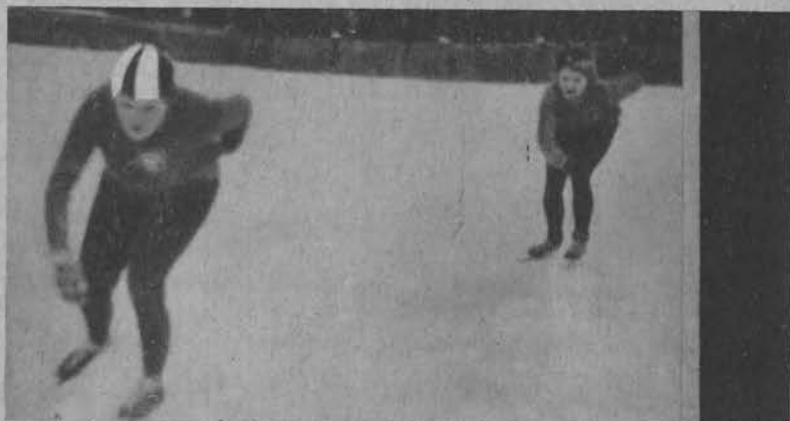
Na lewo: Nehringowa i Lena w biegu na 5 km.