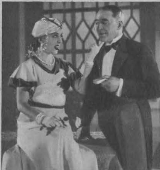
Malicka i Junosza-Stępowski w „Pierwszej sztuce Fanny” w teatrze Narodowym w Warszawie.

Za pięć lat. „Babuniu, chyba nie chcesz nas przekonywać, że w takim stroju pokazywałaś się ludziom!”