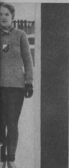
Mała łyżwiarka naga pod pseudo- Lena".