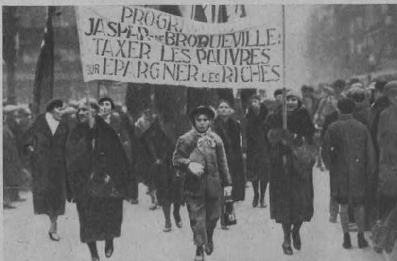
Kobiety belgijskie demonstrują w Brukseli przeciw nowym podatkom.