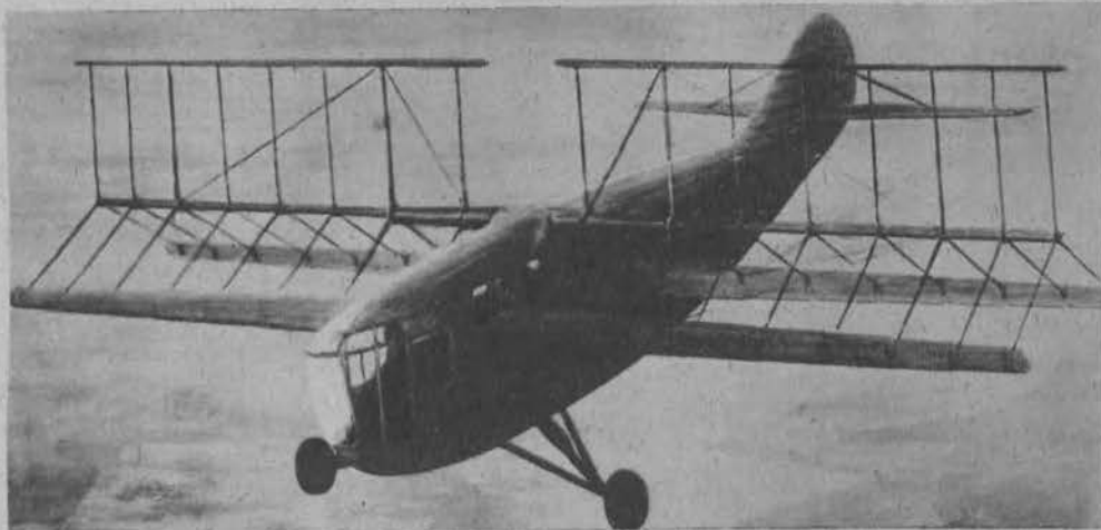
Na lewo: Nowy samolot Rohrbacha, z skrzydłami ruchomymi na wzór wiatraków młyńskich, mogący startować i lądować zupełnie pionowo.