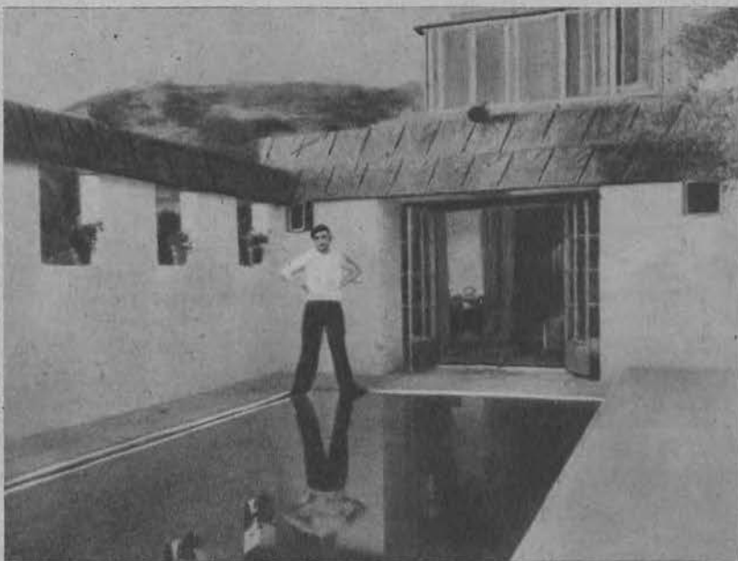
Ramon Novarro w swem mieszkaniu kawalerskiem w Hollywood.