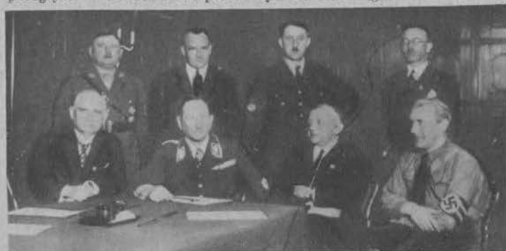
Bawarski rząd komisaryczny. Drugi od lewej siedzi gen. komisarz generał v. Epp