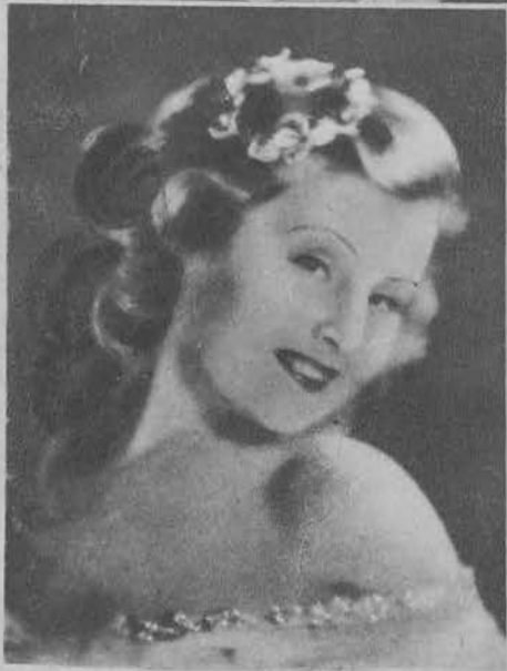
Lilian Harvey u góry w wersji amerykańskiej jako wielka dama; u dołu w wersji europejskiej jest trzępiotowatą dziewczęciem.