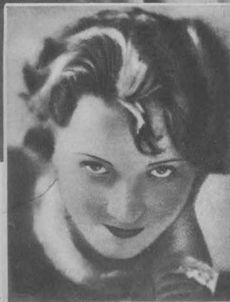
Marlena Dietrich u góry kobieta-sfinks w obrazach amerykańskich Sternberga; u dołu w początkach swej kariery w Niemczech.