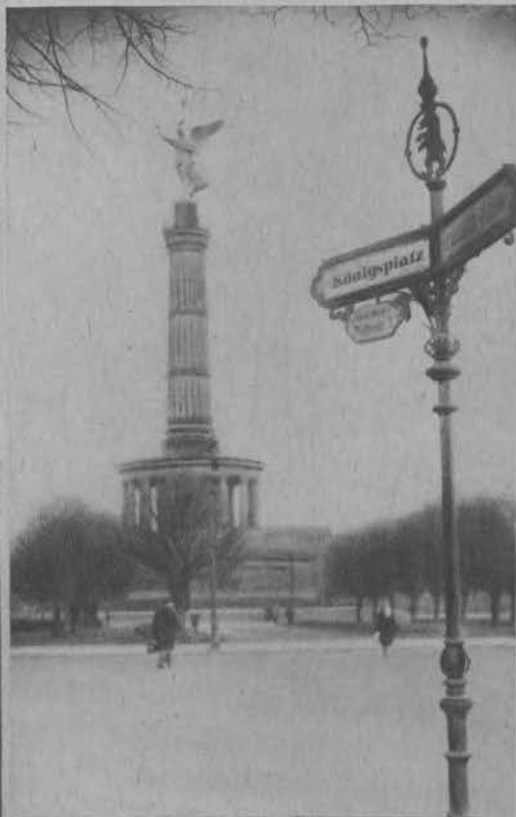
Plac Republiki w Berlinie przemianowany z powrotem na „Königsplatz“.