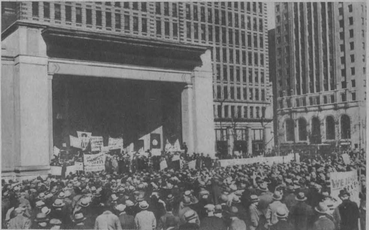
Demonstracje bezrobotnych przed magistratem w Filadelfji.