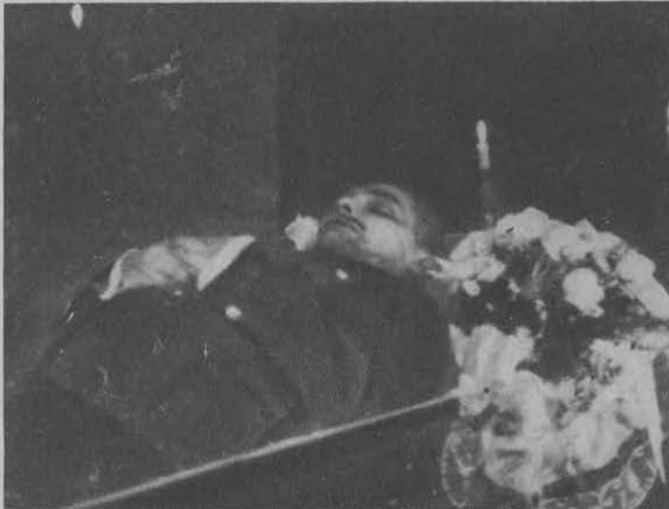
Zwłoki mjr. Gwiazdowskiego na katafalku.