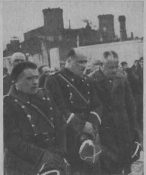
Gen. Małachowski na czele oficerów garnizonu łódzkiego w kondukcje pogrzebowym.