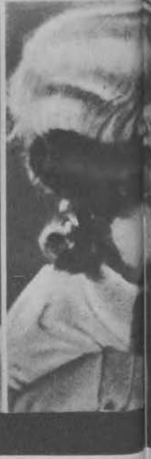
Kami... po niemiecku — po am...