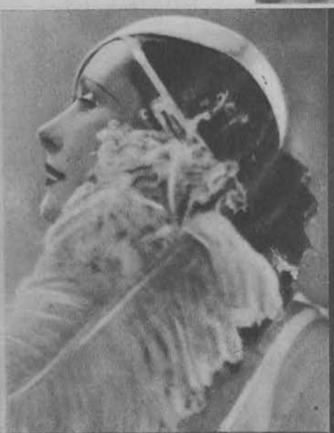
Marlene Dietrich w stylu amerykańskim — niemieckim.