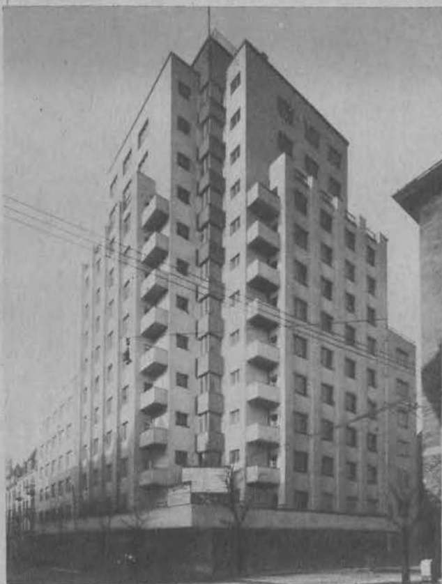
Pierwszy drapacz chmur w Polsce. 14-piętrowy gmach Urzędu Skarbowego w Katowicach będzie wkrótce oddany do użytku.