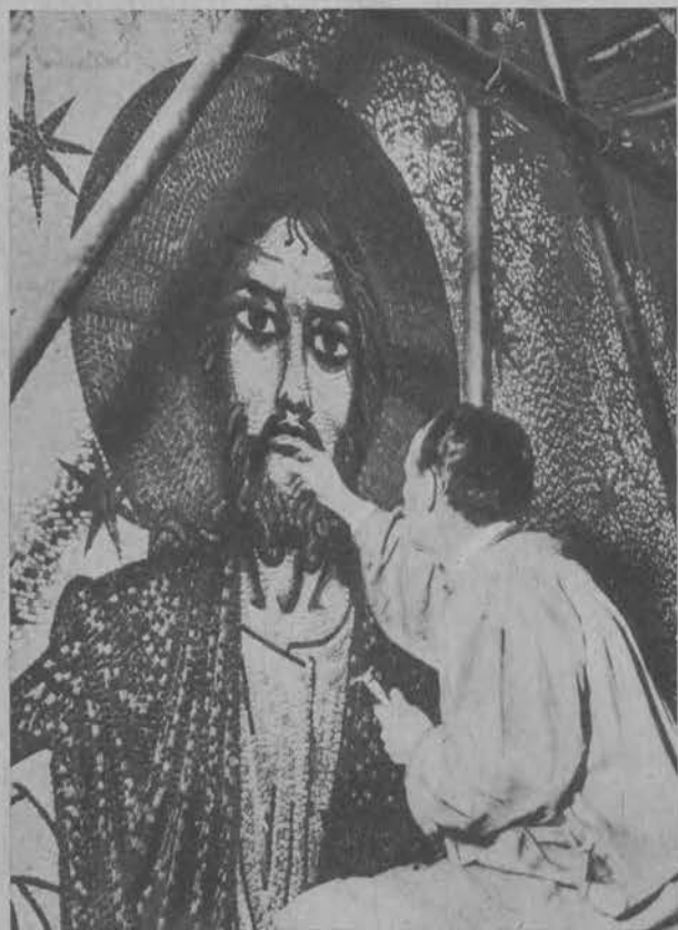
Prace koło olbrzymiej mozaiki, przeznaczonej dla katedry westminsterskiej w Londynie.