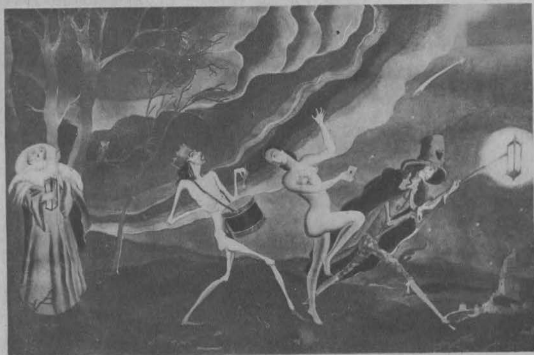
E. Kunke: Taniec śmierci.