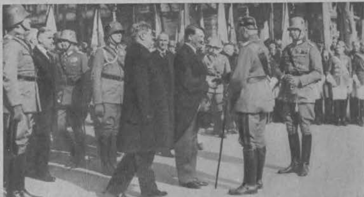
Kancelarz Hitler i prez Hindenburg na uroczystości ku czci poległych w Berlinie. Na prawo syn Hindenburga.