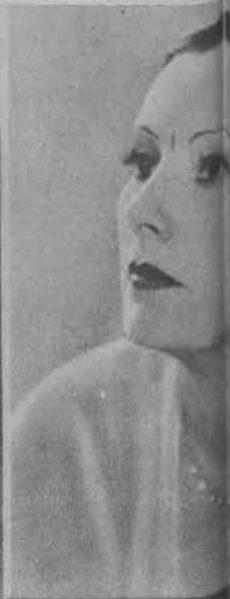
Lil D... w filmie francuskim — am...