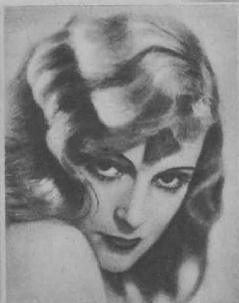
Marlene Dietrich w stylu amerykańskim — po francusku