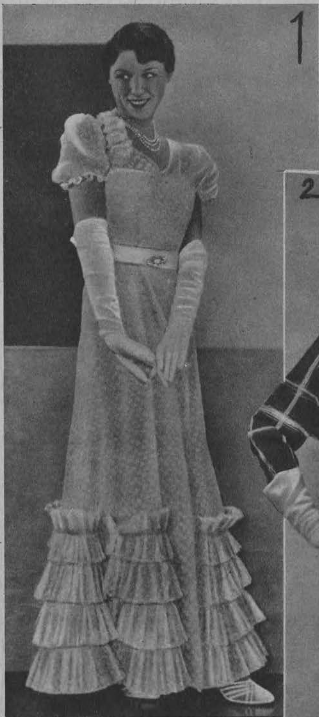
1. Letnia suknia wieczorowa.