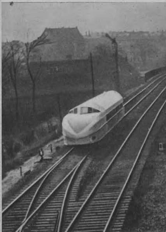
Nowy „Zeppelin“ na szynach kursujący między Berlinem a Hanowerem.