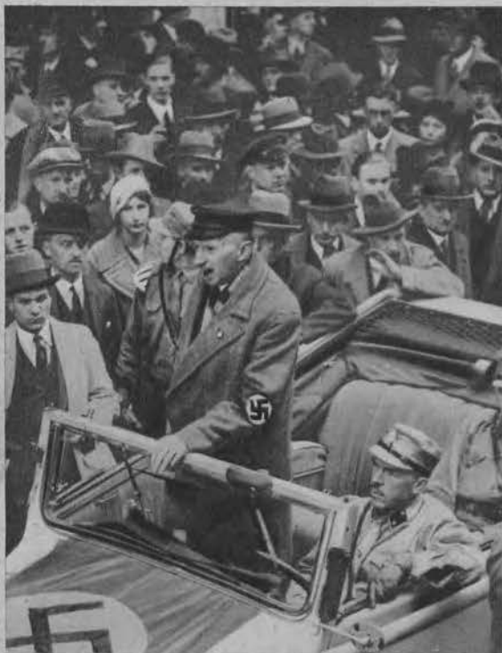
Scena z akcji bojkotowej w Berlinie. Mowa agitacyjna na ulicach.

Na lewo: Hitler w arji z „Żydówki“ w operze Krolla w Berlinie.