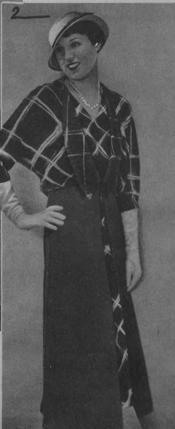
2. Suknia popołudniowa.