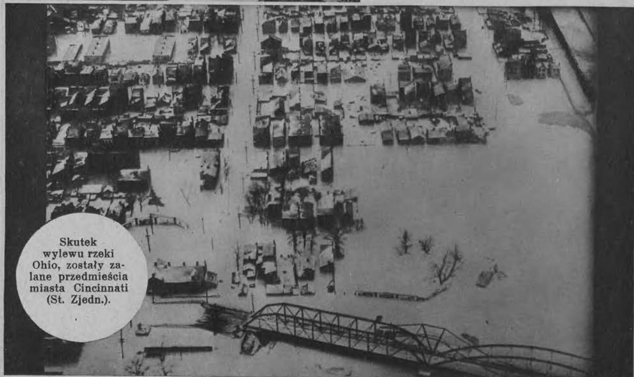
Skutek wylewu rzeki Ohio, zostały zalane przedmieścia miasta Cincinnati (St. Zjedn.).