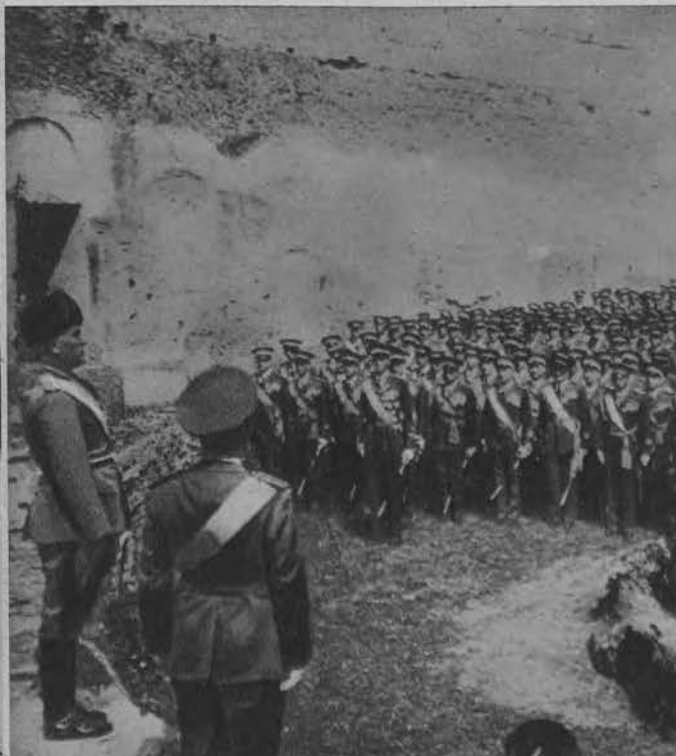
Mussolini przemawia do 4000 lotników w dziesięciolecie założenia italskiej floty powietrznej.