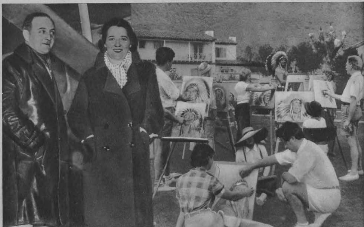
Lotniczka francuska Maryse Hilsz wystartowała do lotu Paryż—Tokio.

Na prawo: Szkoła malarska pod gołym niebem w Palm Springs w Kaliforniji.