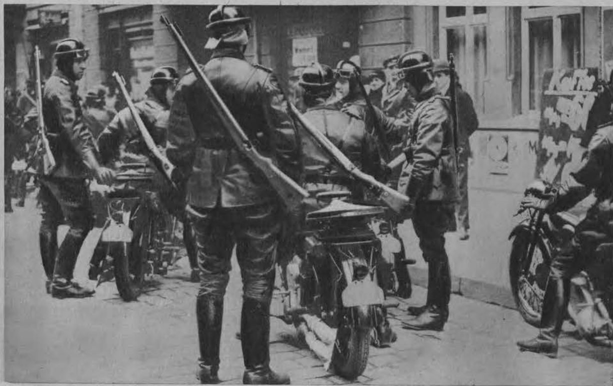
Policja polityczna przeprowadza rewizję w podejrzanych lokalach.

Na lewo: Hitler w arji z „Żydówki“ w operze Krolla w Berlinie. (rys. Dobrogórski)