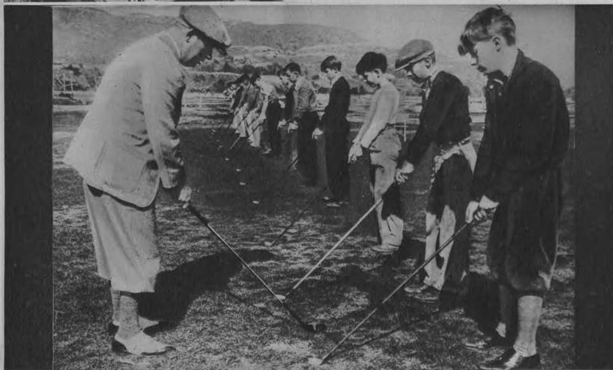
W Kalifornji udziela się dzieciom bezpłatnej nauki gry w golfa.