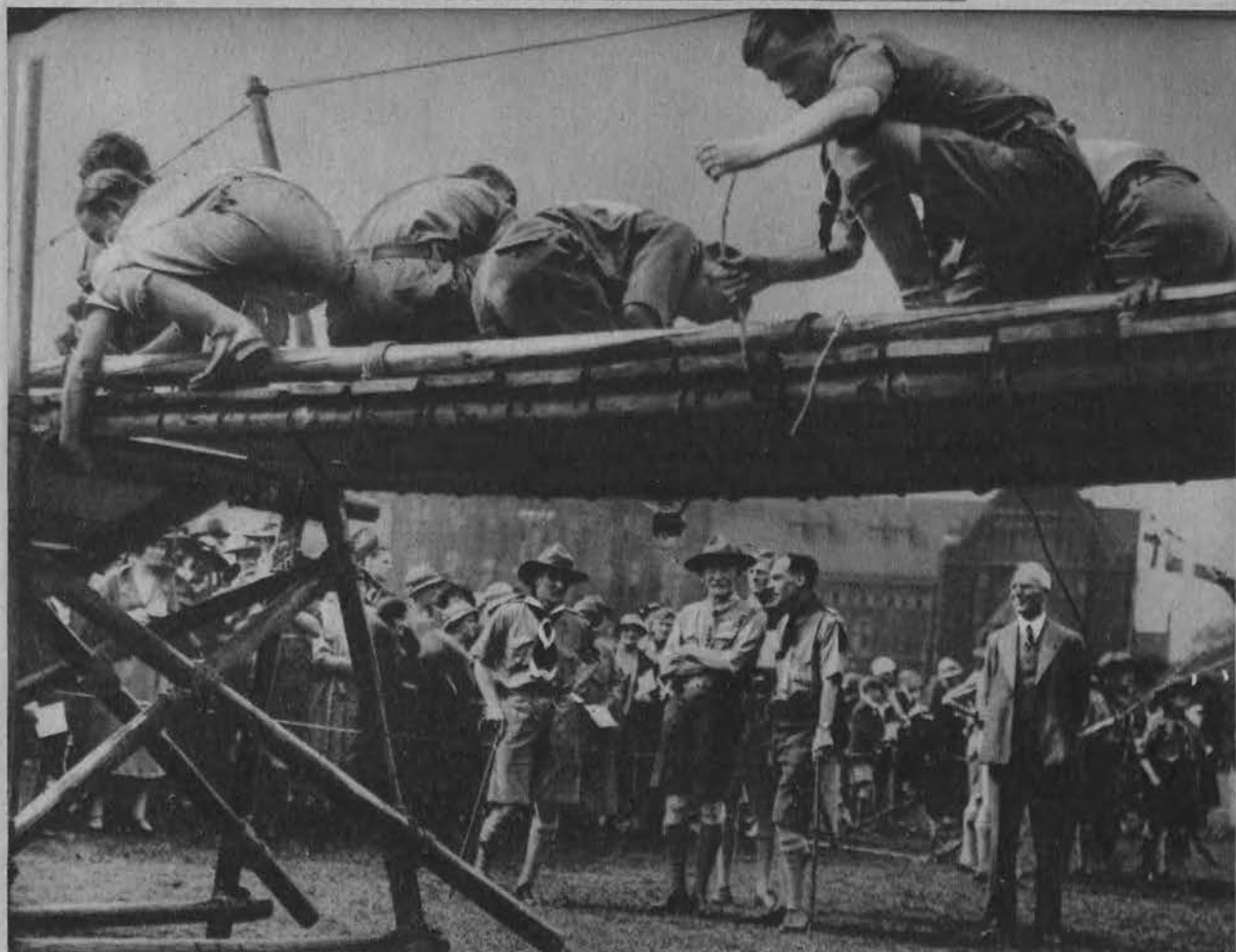
Twórca skautingu lord Baden-Powell przypatruje się ćwiczeniom skautów londyńskich.