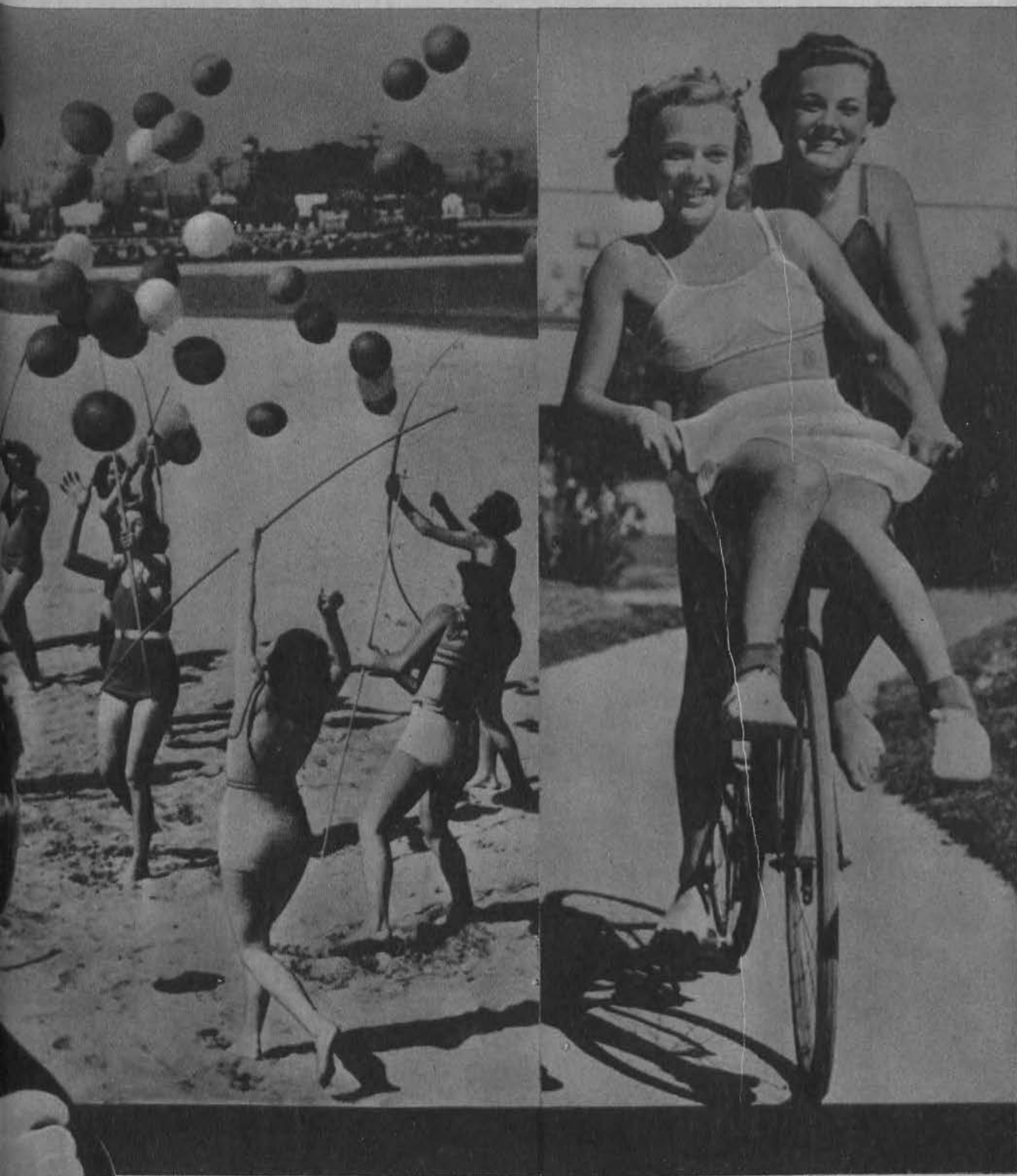
Strzelanie z łuku do balonów — nowy sport na plażach amerykańskich.