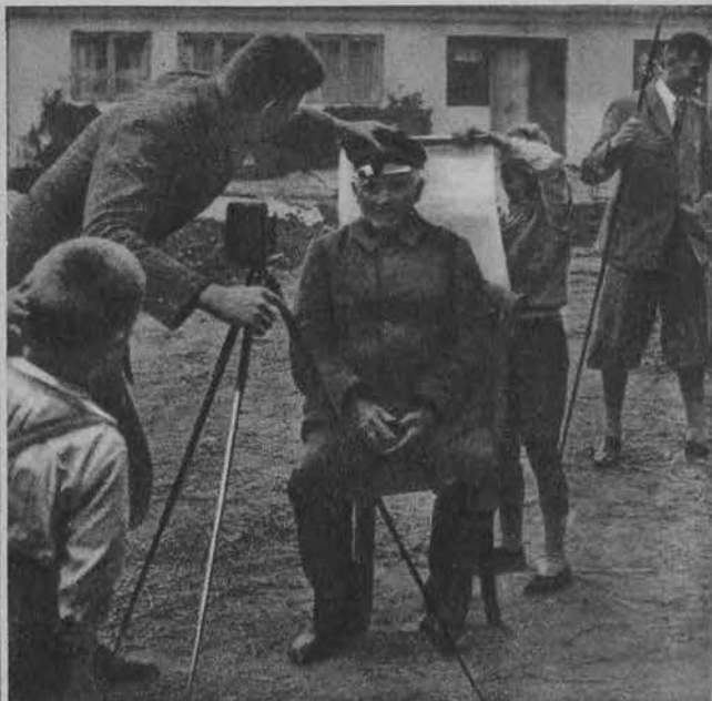
Aby ustalić typ czystej rasy germańskiej. Instytut antropologiczny uniwersytetu w Kilonji, wysłał studentów na wieś, aby ustalić dokładnie wymiary ciała typowego włościanina w północnych Niemczech.