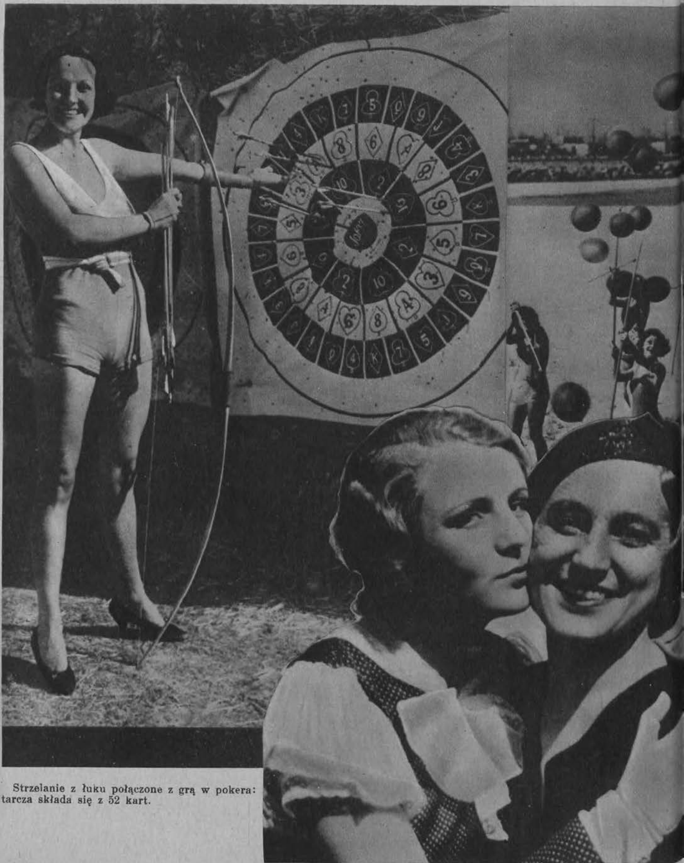
* Strzelanie z łuku połączone z grą w pokera: tarcza składa się z 52 kart.