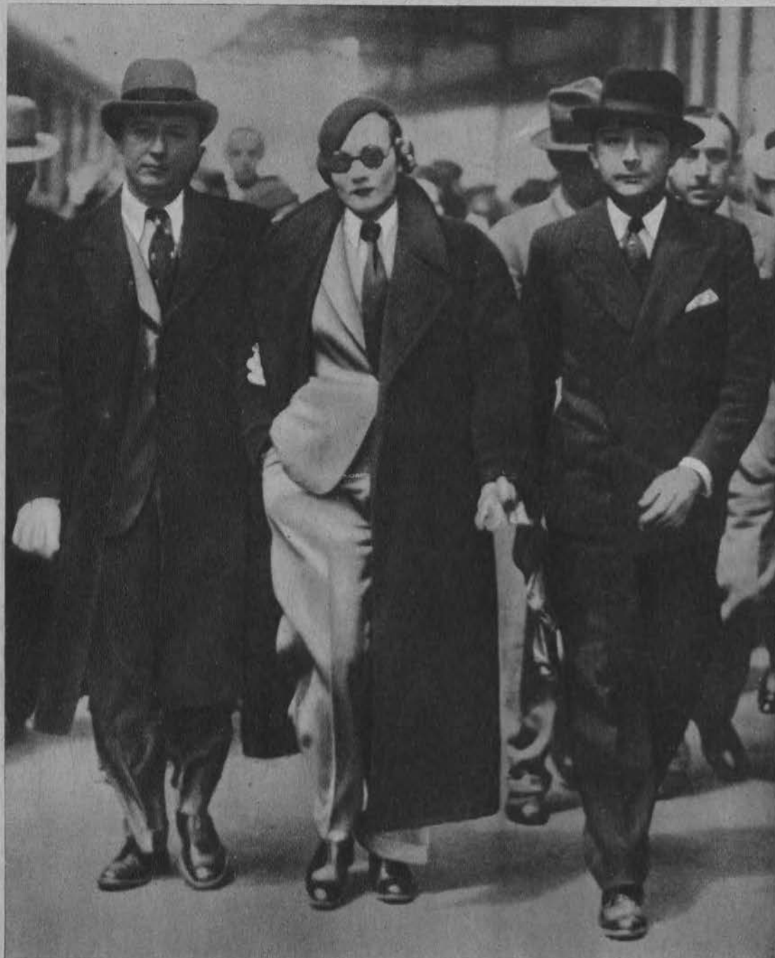
Znakomita artystka Marlena Dietrich przybyła z swym mężem Sieberem do Paryża. Artystka używa stale stroju męskiego.