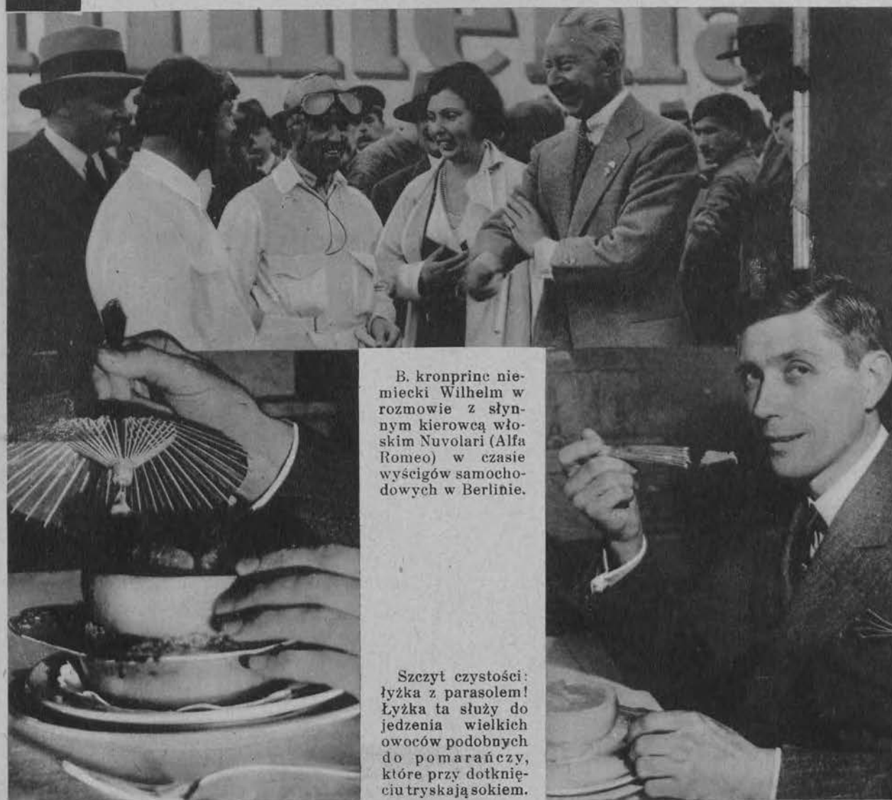
B. kronprinz niemiecki Wilhelm w rozmowie z słynnym kierowcą włoskim Nuvolari (Alfa Romeo) w czasie wyścigów samochodowych w Berlinie.