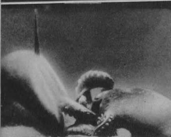
Dramatyczna walka na dnie morza, rekina z olbrzymią mętwą. Mistrzowskie zdjęcie filmowe dokonane koło Jawy.