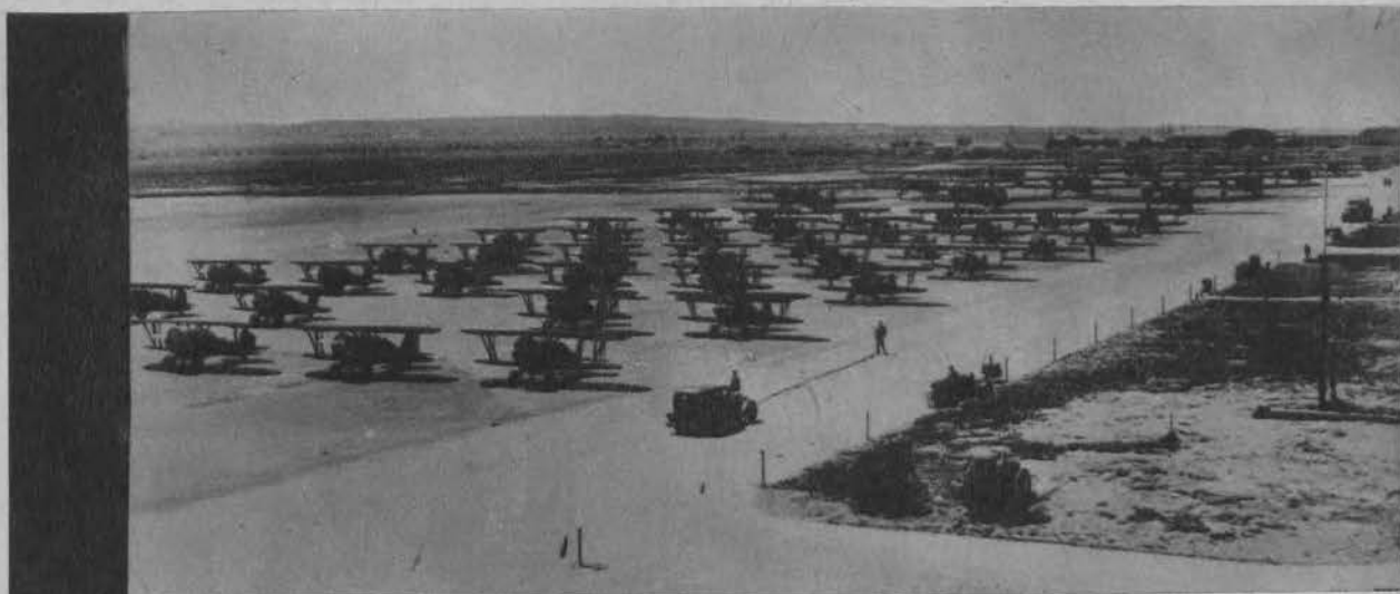
Amerykańska „armada” lotnicza złożona z 350 samolotów, startuje do 3 tygodniowych manewrów.