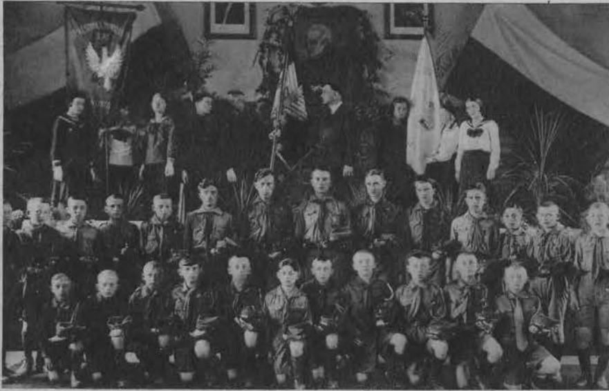
Poświęcenie sztandaru w szkole powszechnej Nr. 42 im. Staszica w Łodzi.