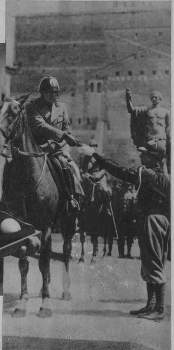
Na prawo: Mussolini w dzień 18-tej rocznicy przystąpienia Italji do wojny wręcza odznaczenia awangardystom.