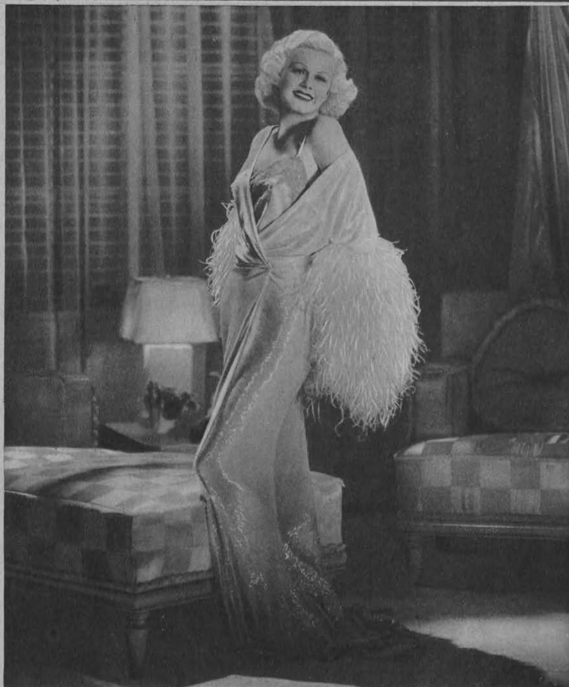
Jean Harlow platynowa blondynka w swym najnowszym filmie.