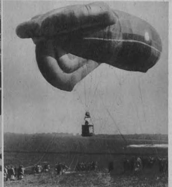
Balon obserwacyjny nowego typu na francuskich manewrach w Compiègne.

Na lewo: Studentki uniwersytetu w Pasadena (Kalifornia) używają przejażdżki w czasie przerwy między wykładami.