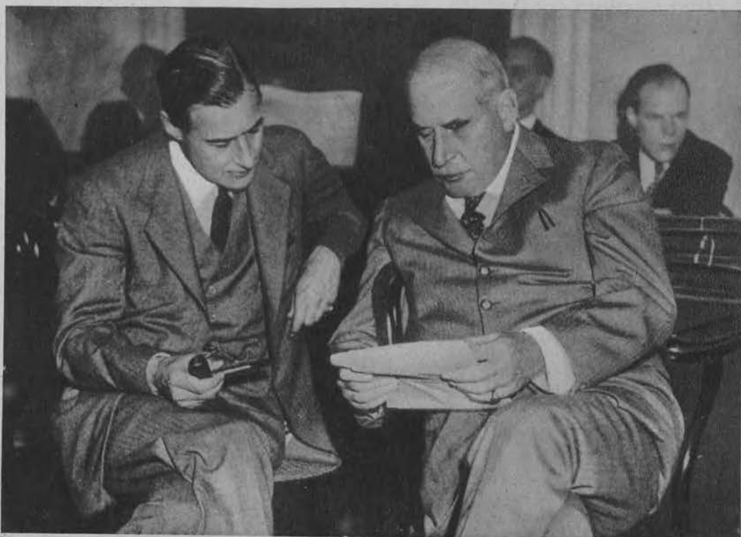
Na lewo: Najpotężniej- szy bankier świata John Pierpont Morgan na- radza się z synem w cza- sie rozprawy w Waszyng- tonie.