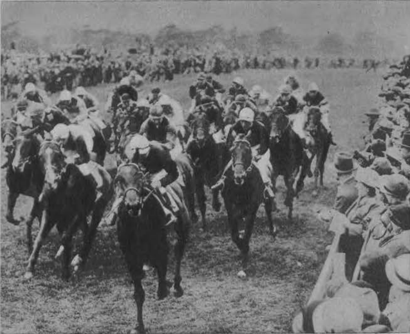
Widok pola wyścigowego w tegorocznym „derby“ w Epsom w Anglii. Widzów było 600.000.

Na prawo: W Ameryce wznowiono słynny proces Toma Mooney skazanego na dożywotnie więzienie za rzekomy udział w zamachu dynamitowym w San Francisco.