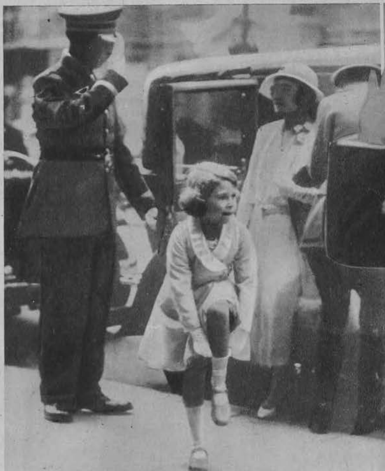
Najstarsza wnuczka króla angielskiego udaje się z swą matką na turniej wojskowy.