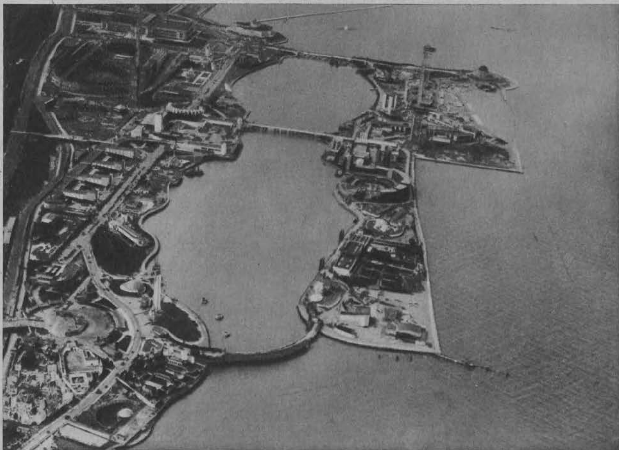
Zdjęcie z lotu ptaka olbrzymich obszarów wystawy światowej w Chicago.