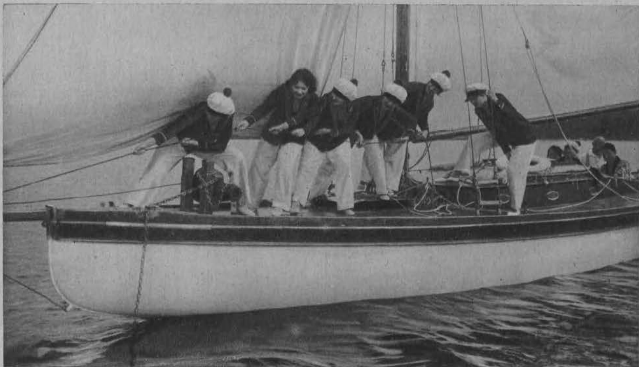
Uroczą załogę żaglowca, nad którą każdy kapitan chętnie objąłby komendę.