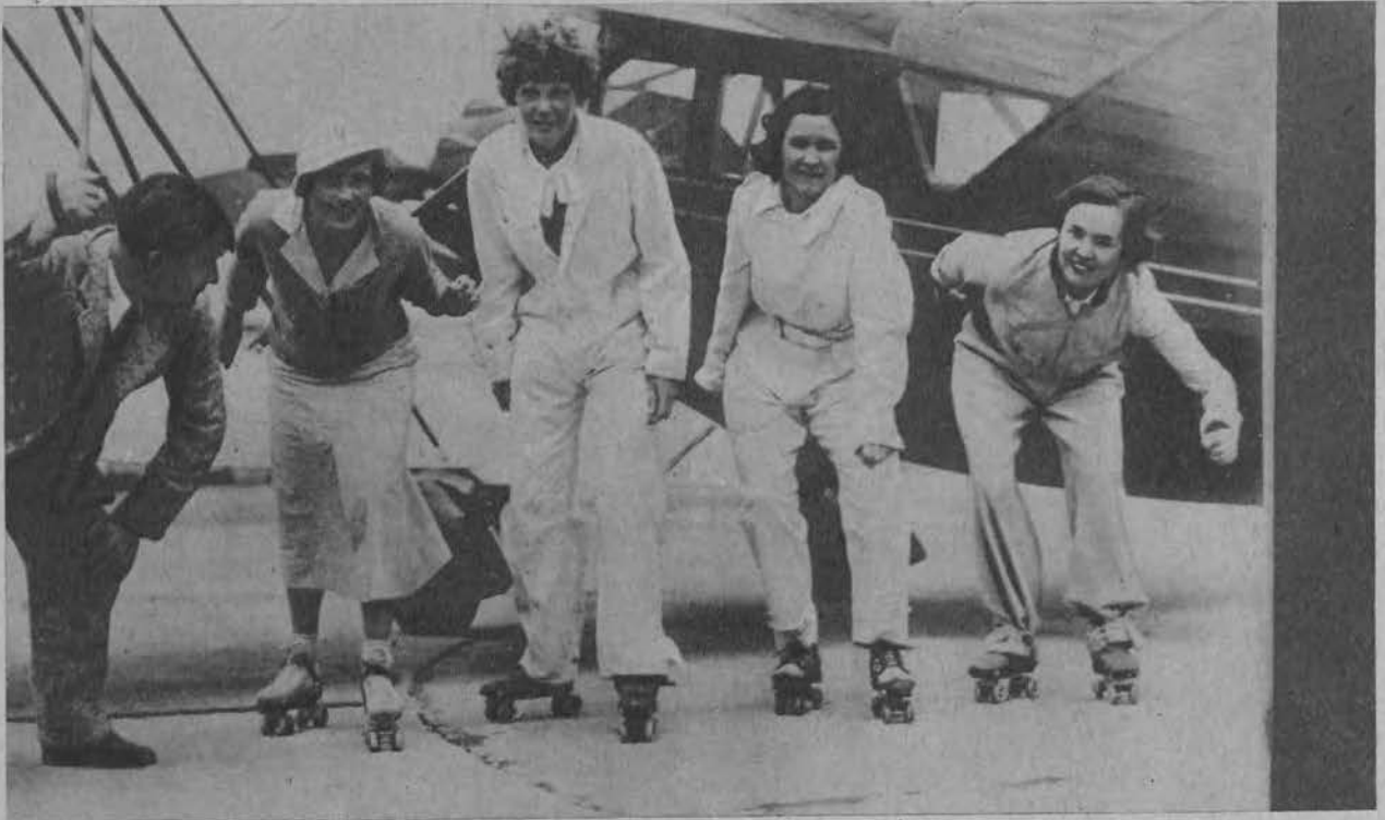
Wyścig na wrotkach słynnych lotniczek amerykańskich. Druga od lewej zdobywczyni oceanu Amelja Earhart.