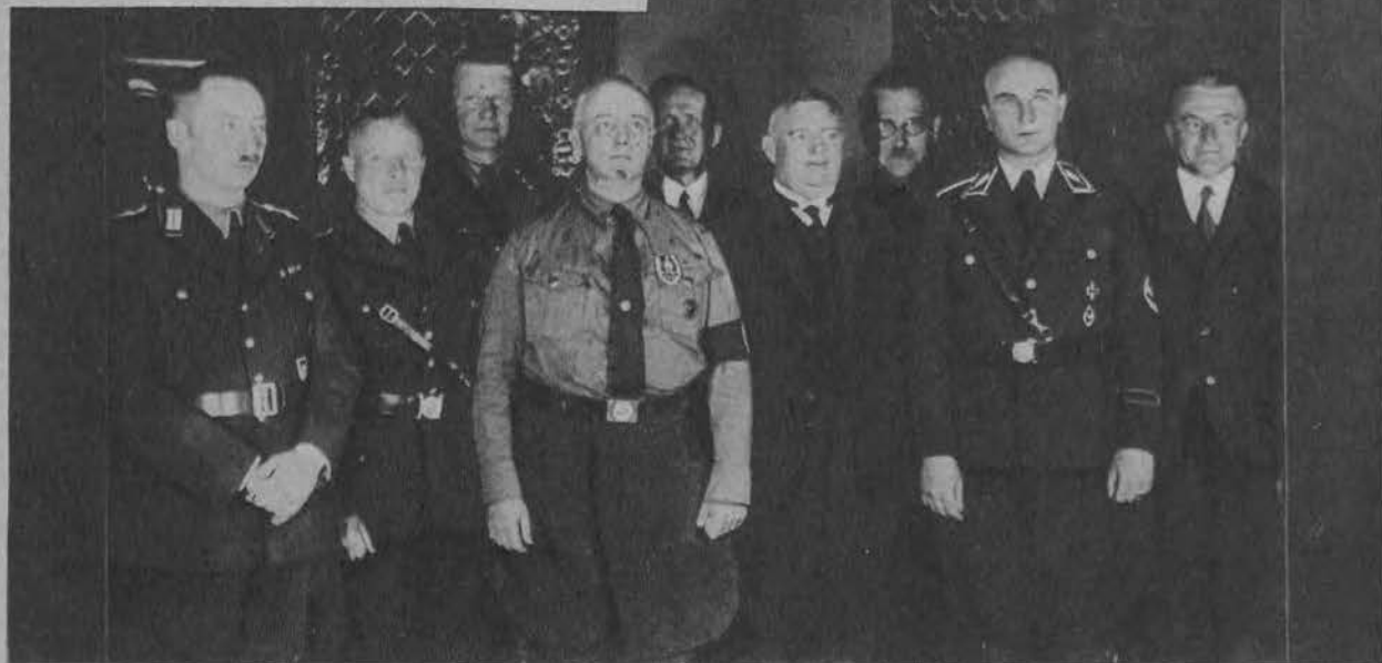
Nowy senat gdański z prezydentem Bertlingiem, w którym hitlerowcy mają silną większość.