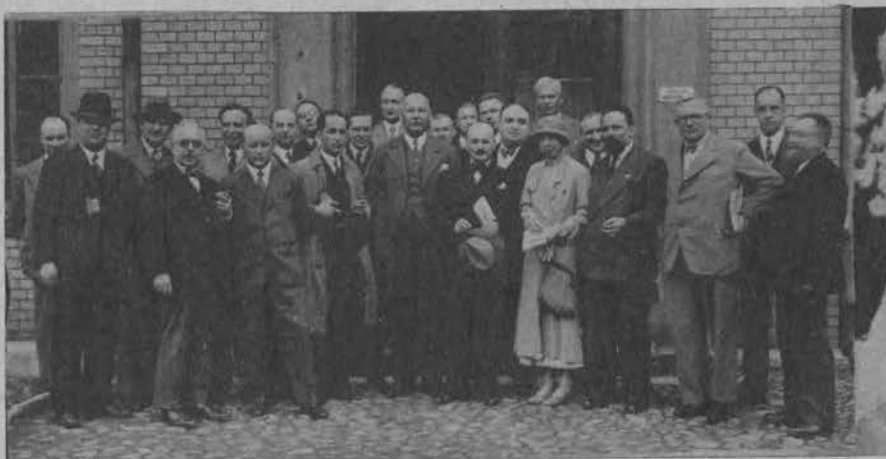
Lekarze zagraniczni delegowani przez Ligę Narodów do Polski, odwiedzili również Łódź i jej urzędnika zdrowotne.