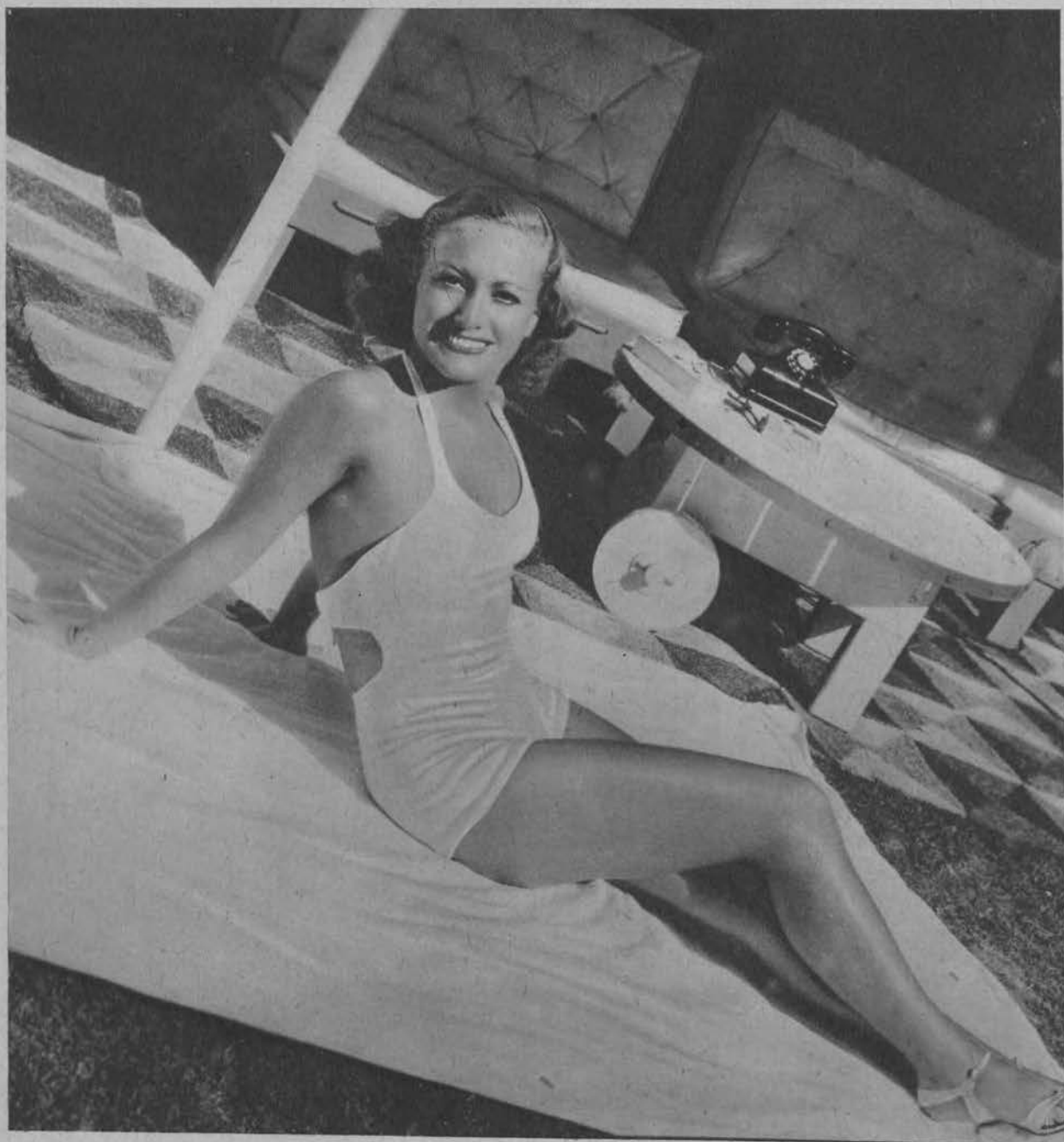
Joan Crawford spędza wolny czas przed swoim „patio” w Hollywood.