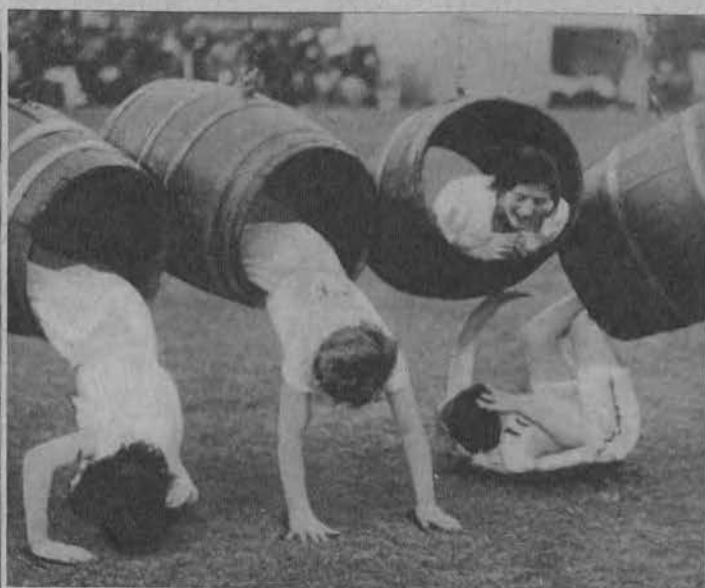
Zabawny moment z biegu z przeszkodami w Londynie.