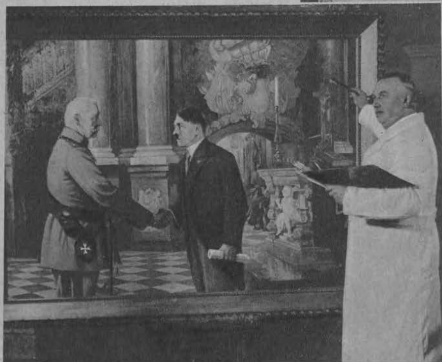
„21 marca“ obraz Georga Marshalla. Hindenburg ściska dłoń Hitlerowi w kościele garnizonowym w Poczdamie. W głębi grobowiec Fryderyka W.

Na prawo: Rząd austriacki obsadził wszystkie instytucje hitlerowskie wojskiem.