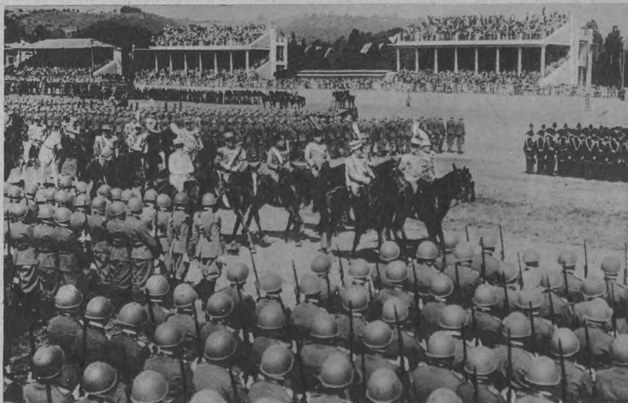
Rzym święci dzień Konstytucji. Król Wiktor Emanuel w czasie przeglądu armji.