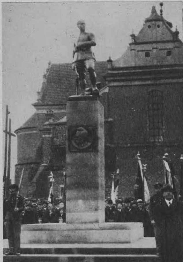
Pomnik niepodległości odsłonięty na rynku pabianickim. (Na prawo twórca pomnika art. rzeźbiarz Lubelski).

Na prawo: „Legjon Młodych“ defiluje i oddaje honory pozdrowieniem faszystowskim.