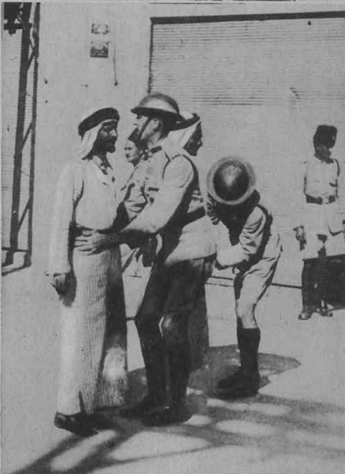
Rewizja Arabów za bronią w czasie rozruchów antyżydowskich w Palestynie.