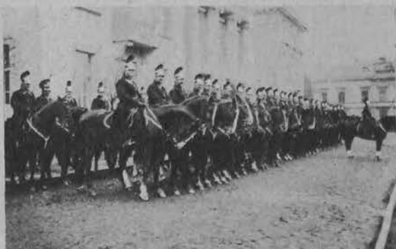
Konny oddział policji łódzkiej przed pałacem biskupim.