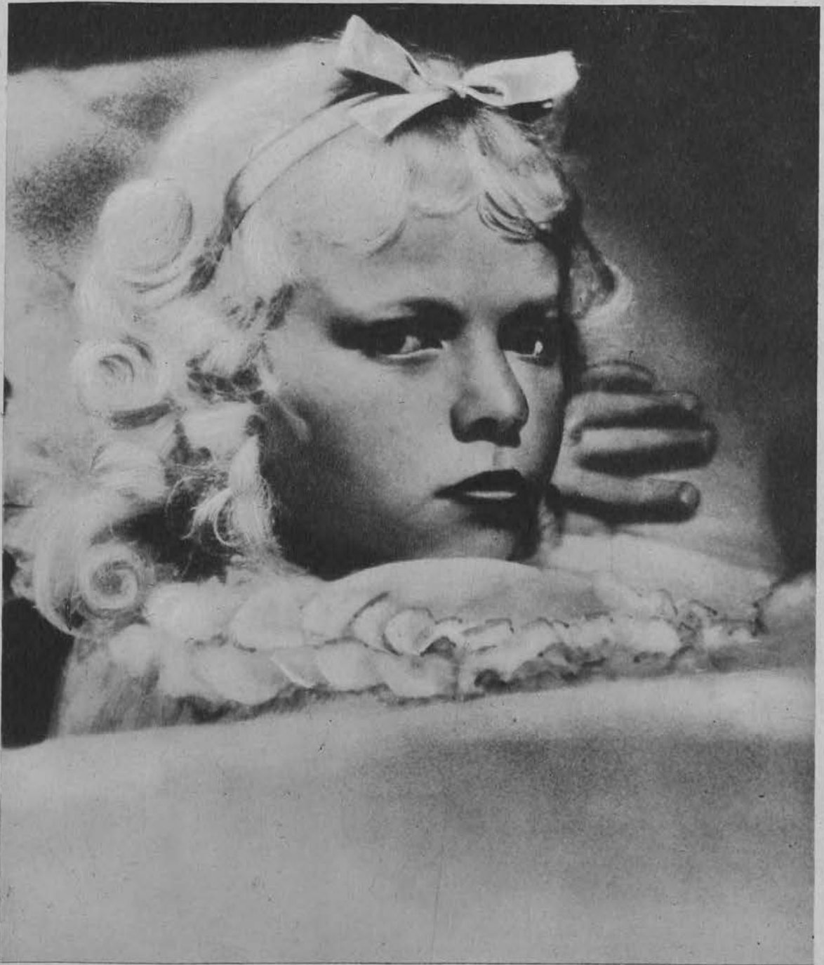
Córeczka Marleny Dietrich, Marja zadebjutowała w filmie w roli carycy Katarzyny II w latach dziecięcych. Carycę w wieku późniejszym odtwarza jej matka.