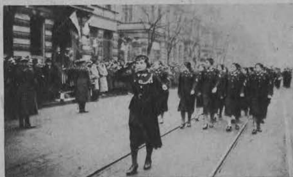
Na prawo: Rezerwa defiluje.