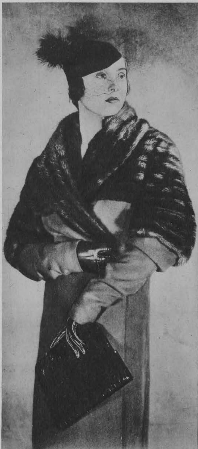
Model płaszcza wełnianego z futrem.