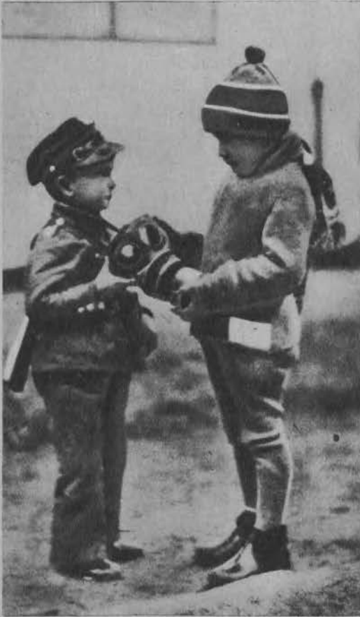
Pod znakiem alarmów gazowych. Cywil ogląda z podziwem przeciwgazowy rysztniek małego strzelca.

Na prawo: Czyszczenie po podróży, olbrzymiego sterowca amerykańskiego „Macon”. Widoczne w głębi 2 samoloty należą do jego inwentarza.