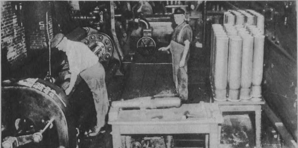
Wnętrze największej w Ameryce fabryki amunicji pod Waszyngtonem.