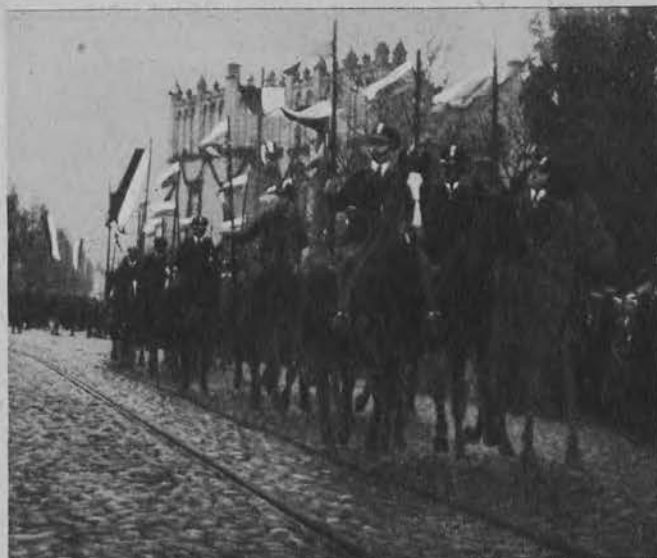
Konny oddział rezerwistów po raz pierwszy zaprezentował się na uroczystościach.