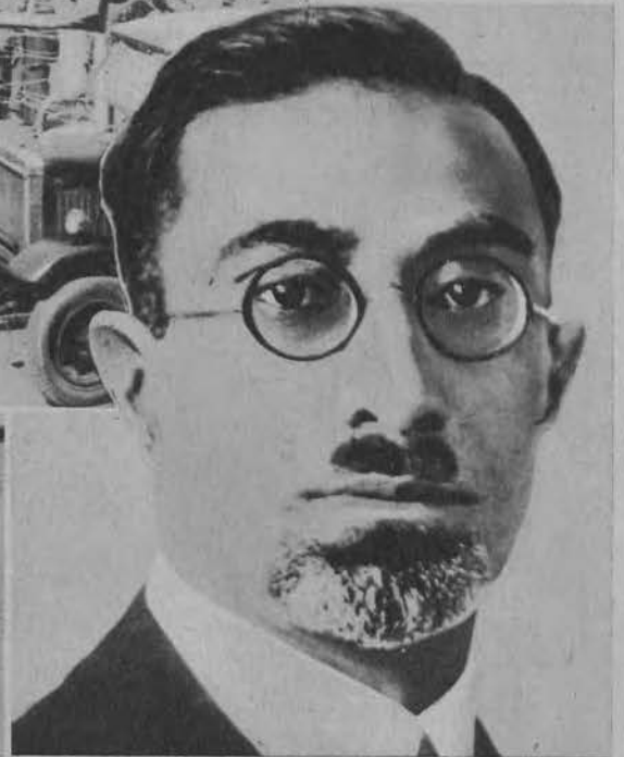
Zamordowany król Afganistanu Nadir Szach Ghazi.