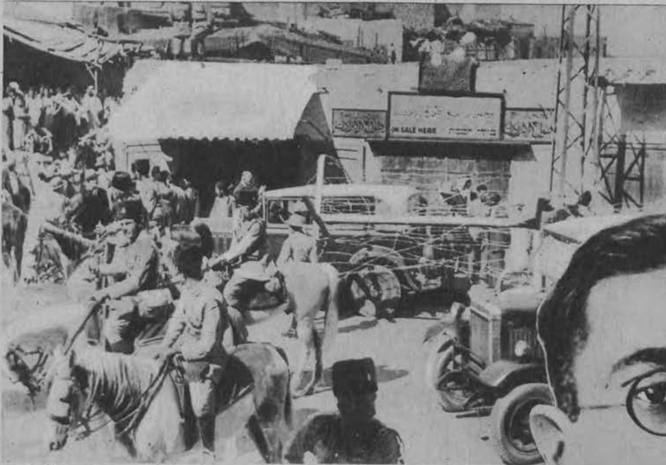
Na lewo: Scena z ulic Jaffy (Palestyna) po uśmierzeniu rozruchów arabskich.