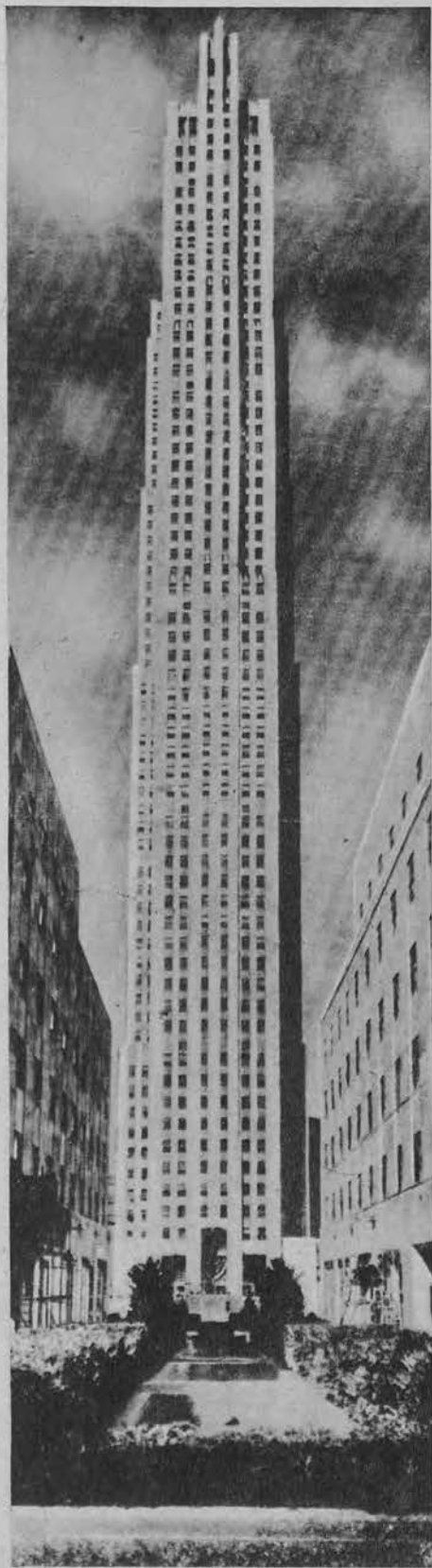
Nowoczesne kolosy. Drapacz chmur w Rockefeller City w N. Jorku.