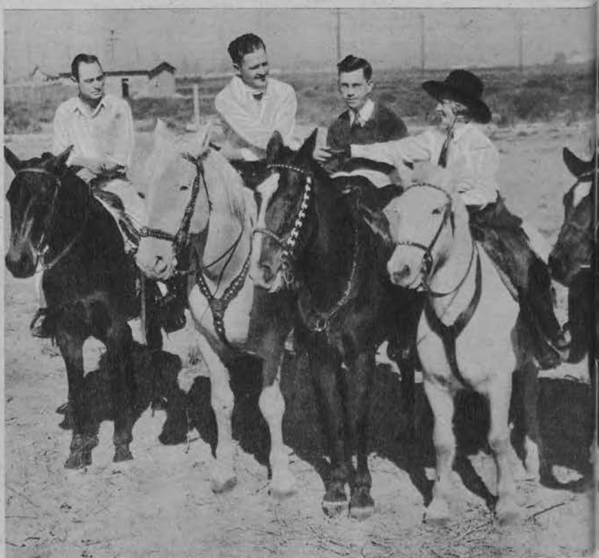
Amerykańskie szaleństwa. U góry: Ślub nudystów w miejscowości L... w Kalifornji. U dołu: Ślub na koniach na „dzikim“ Zachodzie w Santa Fe