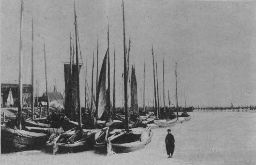
Na lewo: Flota rybacka w Volendam w Holandji, unieruchomiona w lodzie.