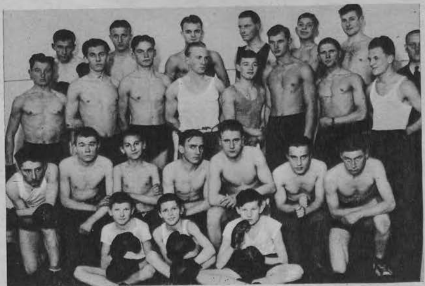
Na prawo: Sekcja bokserska Union-Touringu.