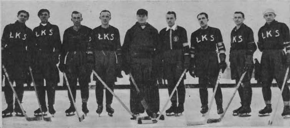
Hokejowa drużyna ŁKSu bije Union Touring 8:0