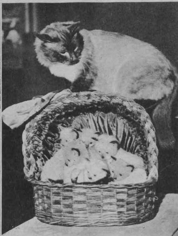
Kotka znanego sportowca szwajcarskiego obdarzyła swego pana sześciorgiem młodych.