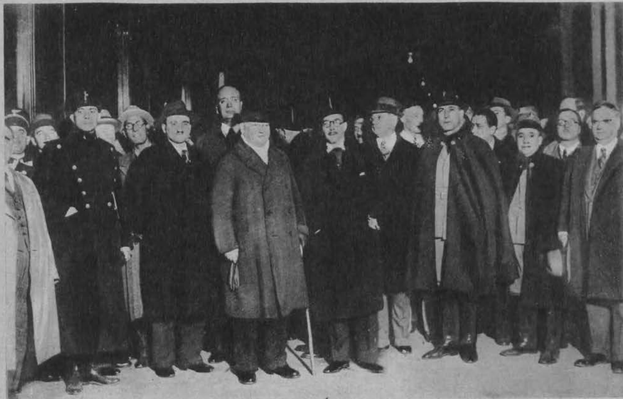
Litwinow, rosyjski komisarz spraw zagranicznych, w drodze z Washington'u zatrzymał się w Rzymie. Na zdjęciu powitanie Litwinowa na dworcu.