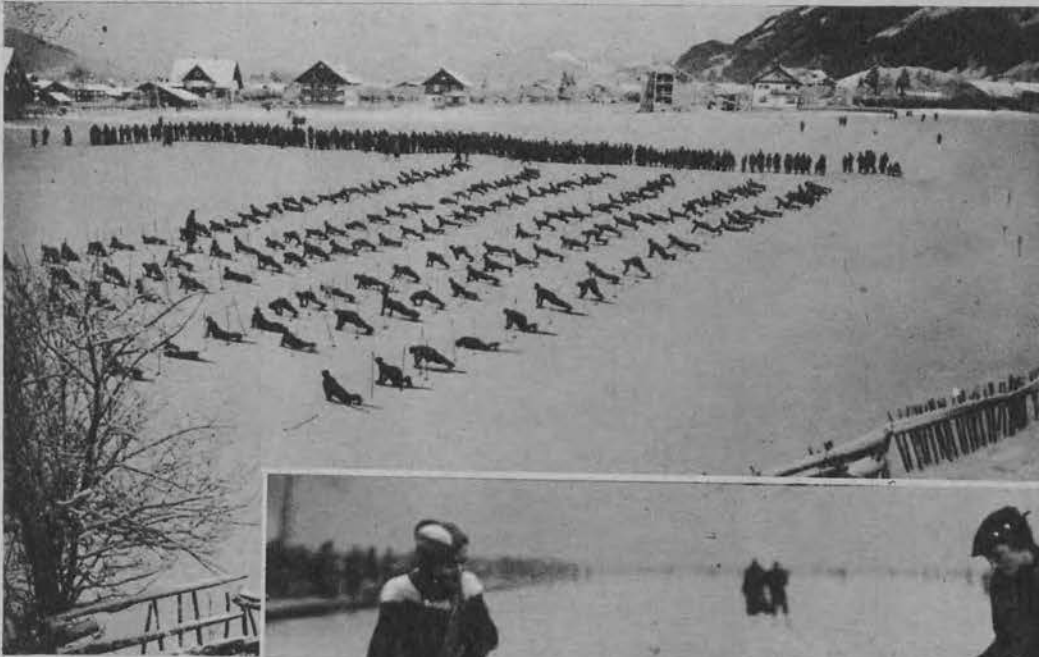
Na lewo: Cwiczenia gimnastyczne kursu narciarskiego, w jednej z uczęszczanych miejscowości kuracyjnych w Szwajcarii.