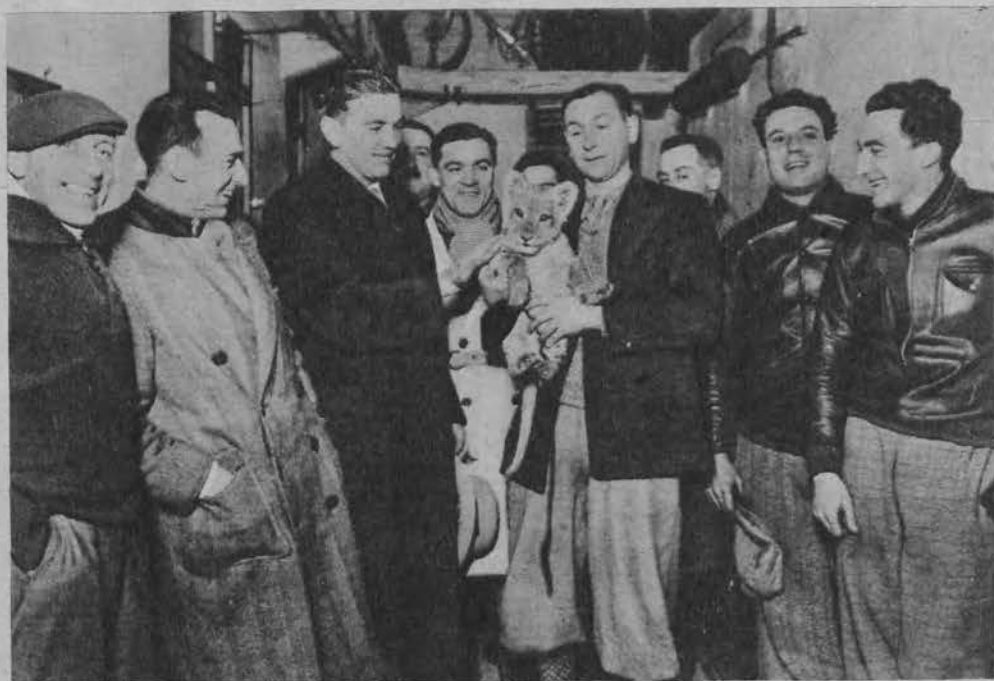
Ekipa kolarska, biorąca udział w wyścigach 6-dniowych, wierzy, że młode lwiątko przynosi zwycięstwo.