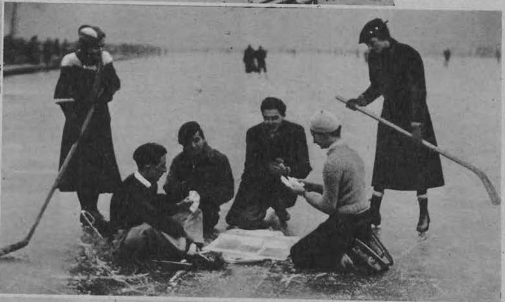
Na prawo: Wczesne mrozy tegoroczne pokryły lodem także wszystkie sadzawki w Wersalu pod Paryżem. Korzystali z tego liczni łyżwiarze. Oto grupa „sportowców” wypoczywa na „Wielkim Kanale”.