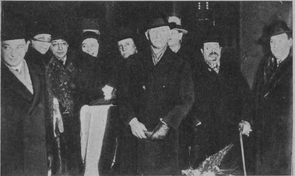
Do-Sztokholmu przybył Ivan Bunin, laureat nagrody Nobla. Był on podejmowany na dworcu chlebem i solą.