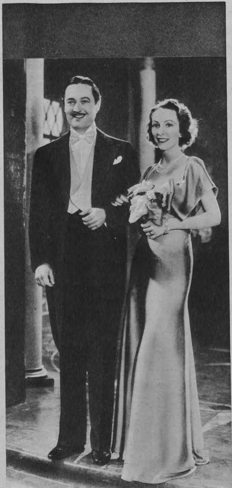
John Barrymore w filmie Metro „Obiad o 8 mej“.

Na prawo: Nowoczesne kolosy. Model gipsowy „Tour de France“, gigantycznej wieży wys. 1.000 m., która ma stanąć w Paryżu w czasie światowej wystawy w r. 1937.