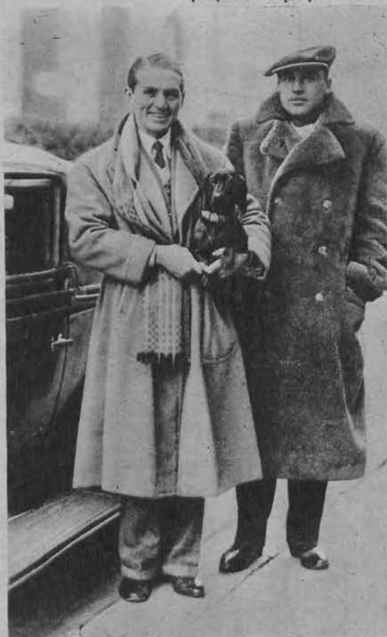
Znakomity bokser francuski Carpentier, który chce powrócić na ring, nie rusza się nigdzie bez swego ulubionego jamnika.