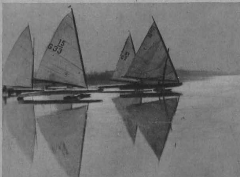
Regaty żaglówek na lodzie jeziora Rangsdorf.