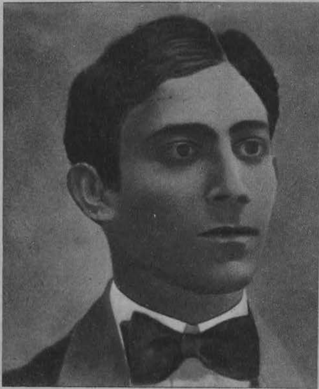
Stawiski gdy miał 22 lata.

Na prawo: Stawiski, tak jak go znaleziono po samobójstwie w Chamonix.