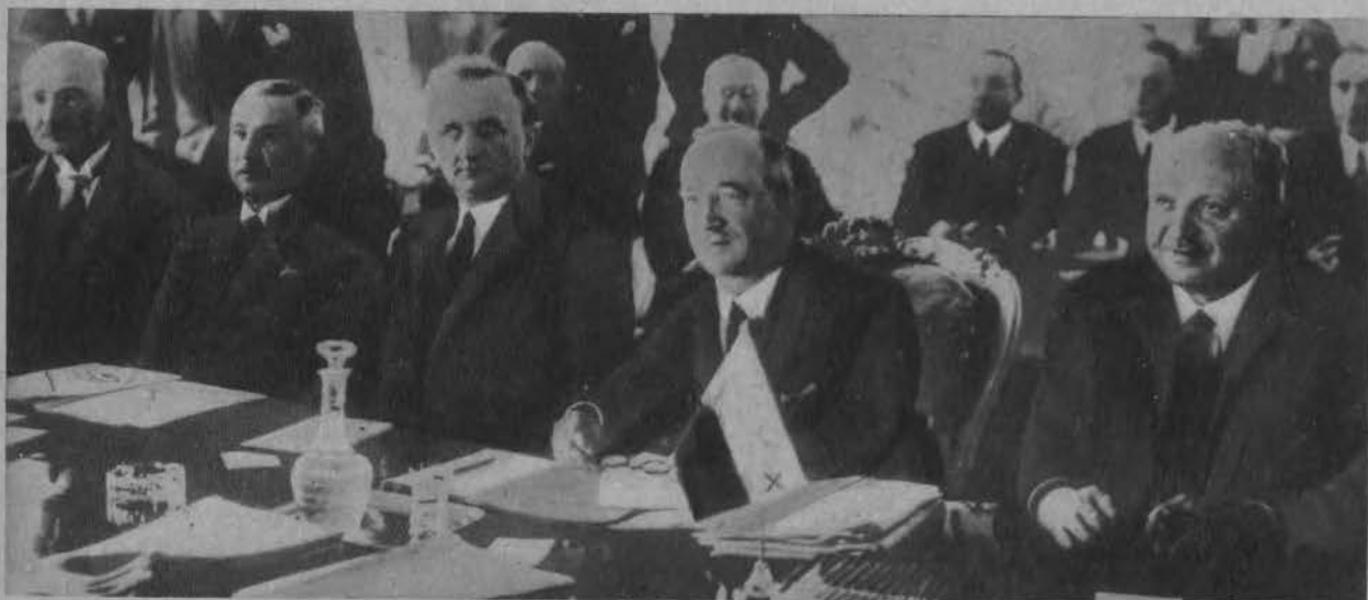
Min. Benesz otworzył w Pradze konferencję gospodarczą Małej Entente'y.