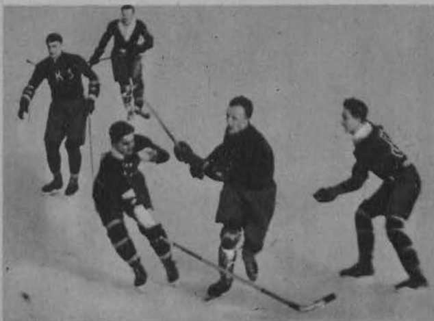
Warszawianie nie dają dojść do głosu Królowi (Ł. K. S.), przeszkadzają mu w akcji.