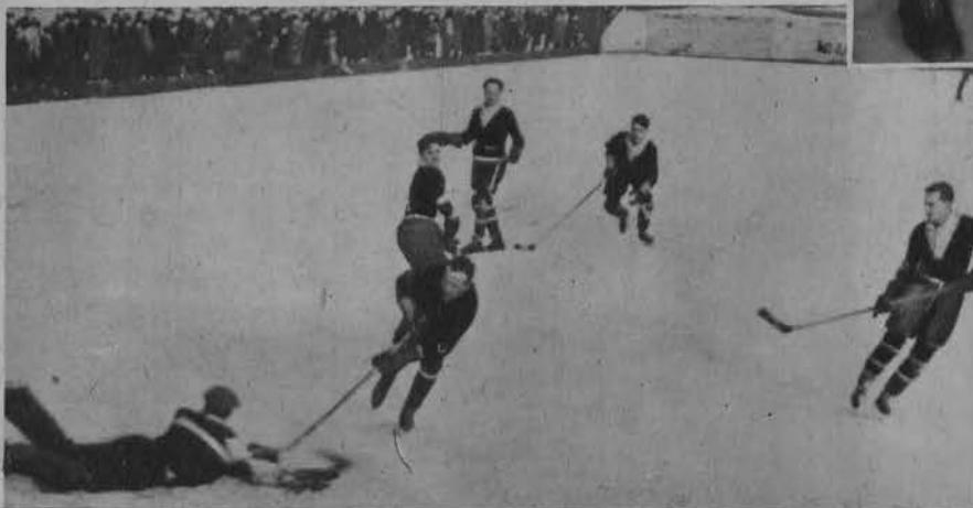
Na lewo: Moment pod bramką „Polonji”. Bramkarz wyłapuje krążek Królowi (Ł. K. S.)