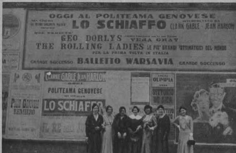
Polski zespół baletowy „Varsavia” występuje z powodzeniem we Włoszech. Na zdjęciu widzimy nasze tancerki pod wielkim afiszem, reklamującym ich występ w Genui.