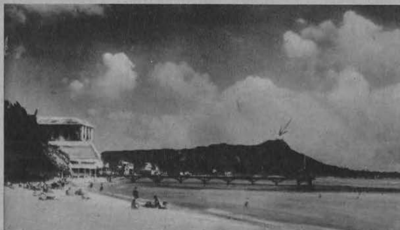
Wyspy Hawajskie na Oceanie Spokojnym zostały obecnie urządzone jako bazy operacyjne dla marynarki wojennej Stanów Zjednoczonych.