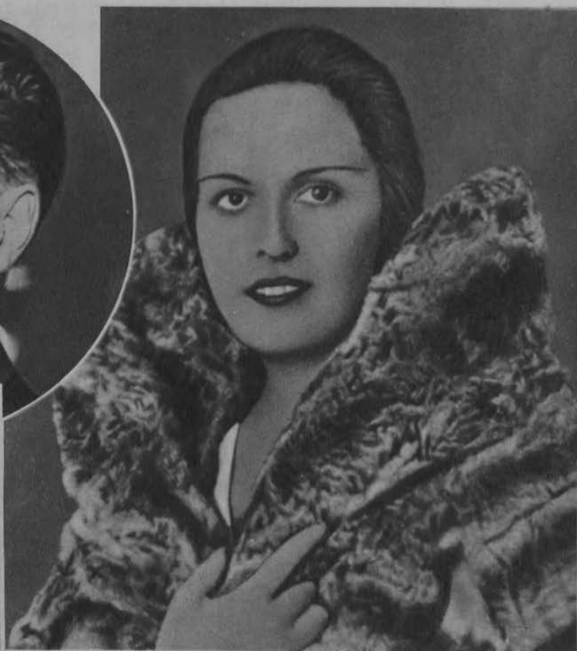
U góry i na lewo: Żona Stawiskiego.