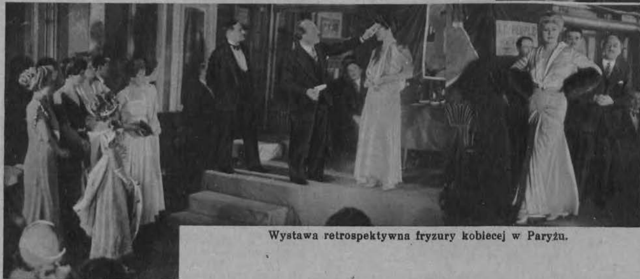
Wystawa retrospektywna fryzury kobiecej w Paryżu.