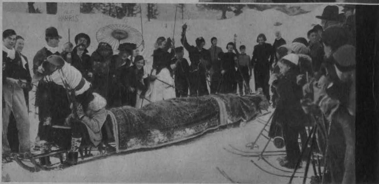
Popularny „wąż morski” z Loch Ness na wywczasach w St. Moritz.