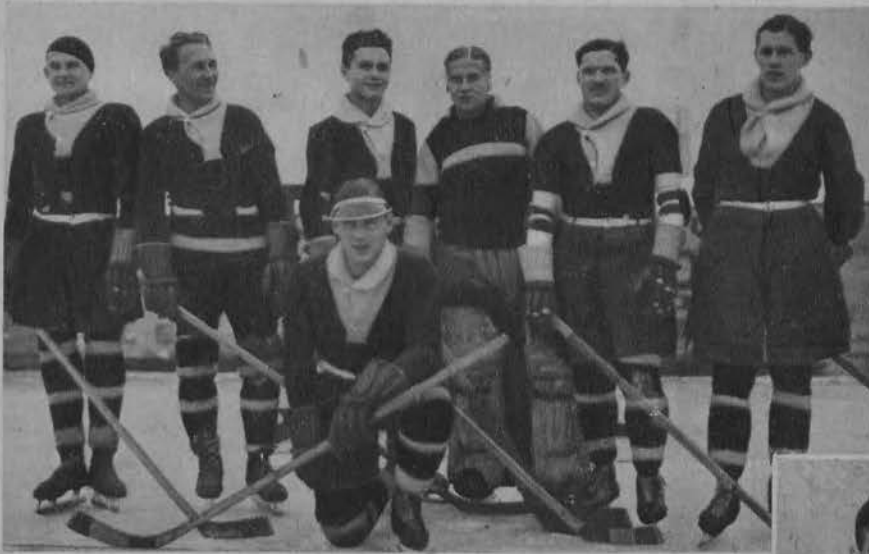
Drużyna stołecznej „Polonji” w Łodzi.