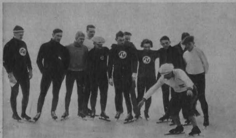
Niemiecka drużyna łyżwiarska ćwiczy pod okiem trenera. Na prawo: Uroczy kostjum narciarski.