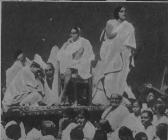
Na prawo: Gandhi po opuszczeniu więzienia przewodniczy demonstracji kobiet w Madras.