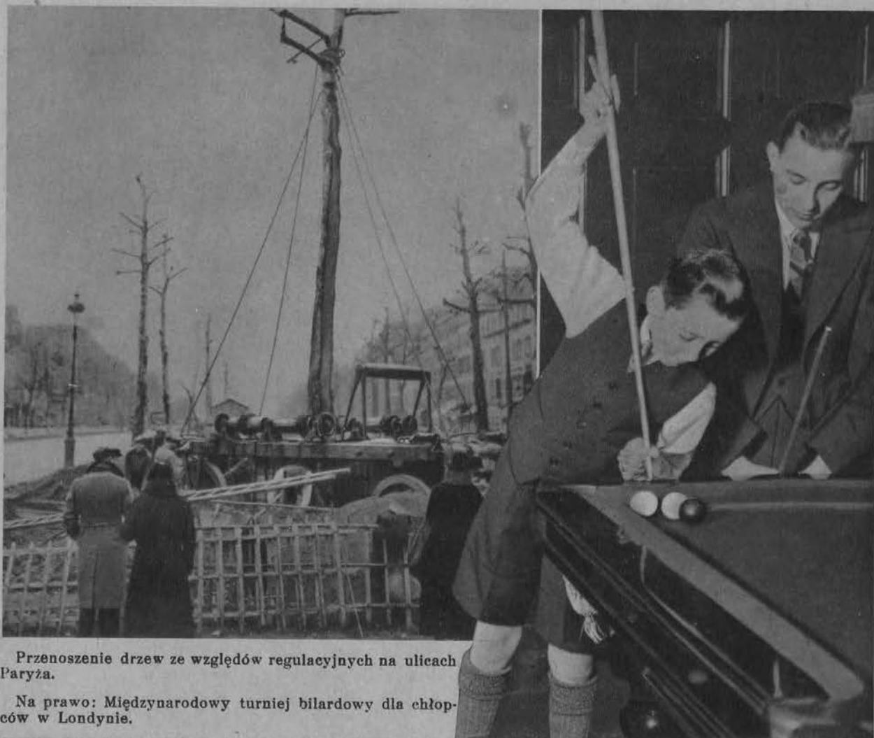
Przenoszenie drzew ze względów regulacyjnych na ulicach Paryża.