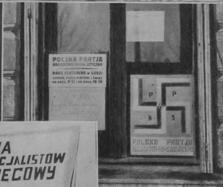
Lokal frontowy Polskiej Partii Narodowo-Socjalistycznej przy ul. Wolezańskiej 112 z widoczną na drzwiach swastyką biało-amarantową.