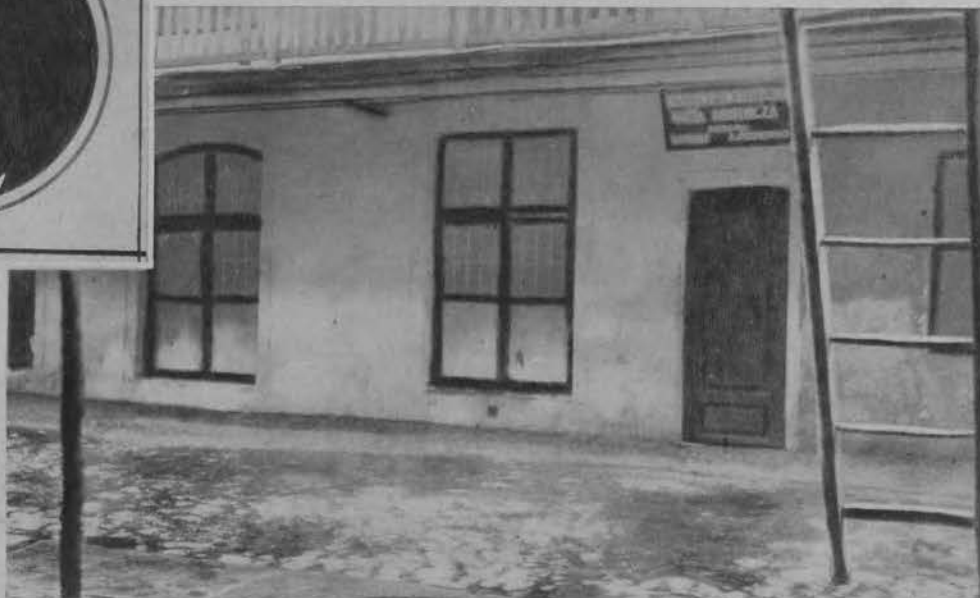
Na prawo: Siedziba Narodowo-Socjalistycznej Partii Robotniczej przy ul. Piotrkowskiej 89 w oficynie.