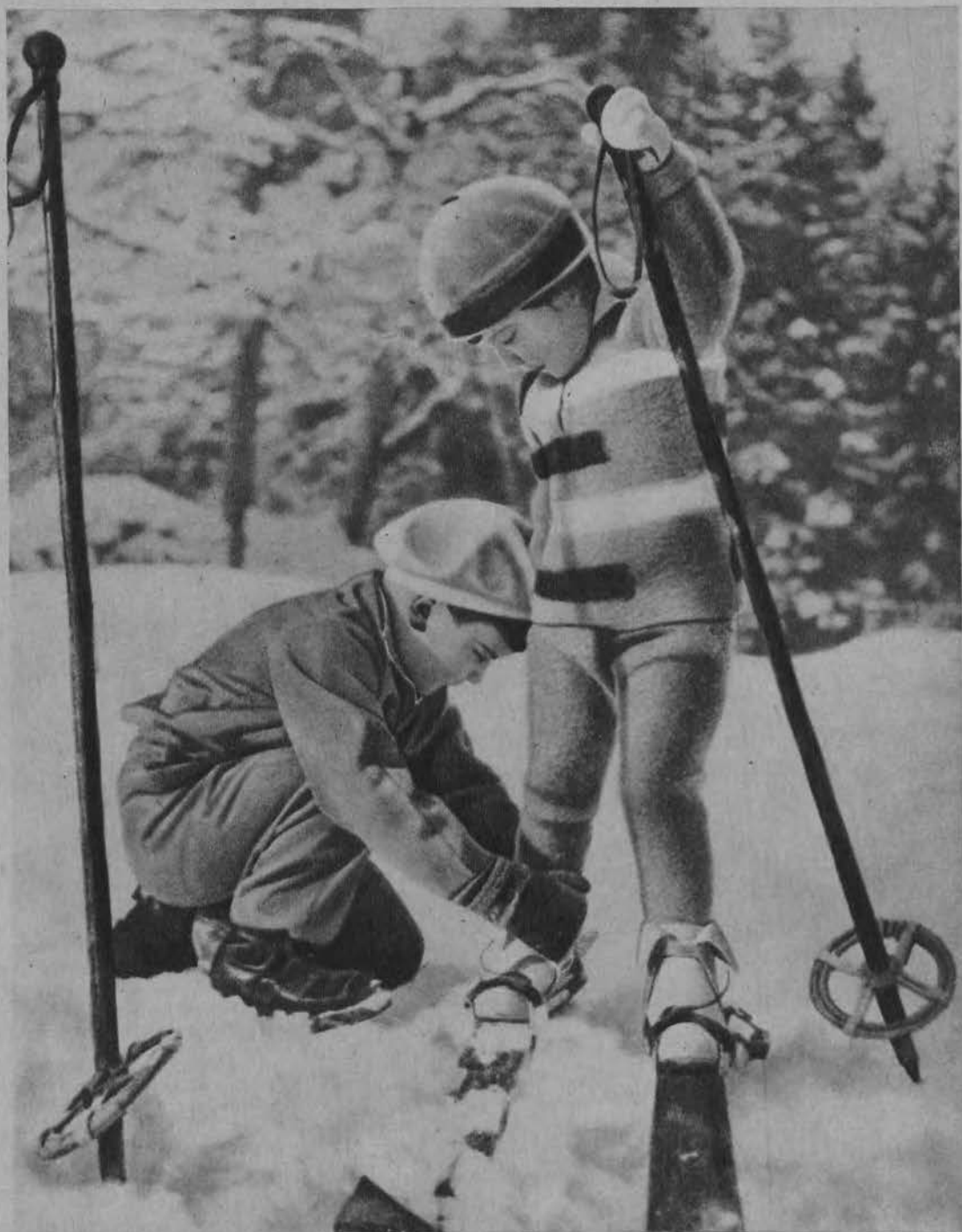
Najmłodsze pokolenie narciarzy.