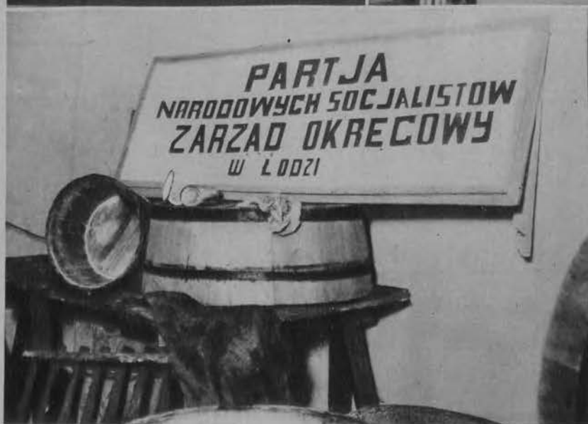
Na lewo: Szyld trzeciej organizacji hitlerowskiej w Łodzi, Partii Narodowych Socjalistów przy ul. Nawrot 38. (Szyldu tego nie pozwolił wywiesić właściciel domu i znajduje się on w komórce wraz z baljami i cebkami, czekając na... „lepsze” czasy).