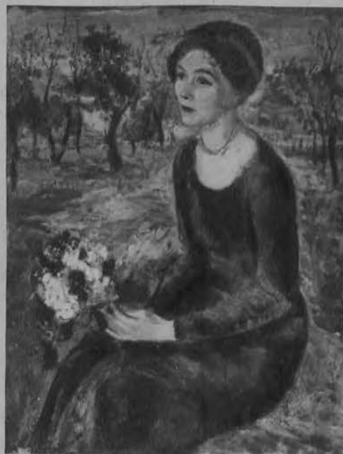
Na prawo: Portret p. L. B.