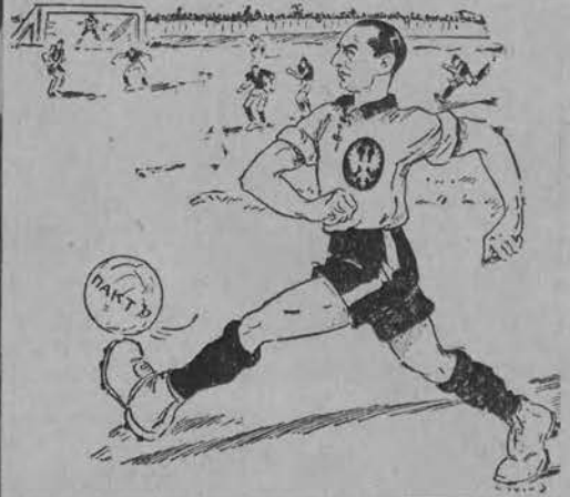
Beck gra w centrum. W centrum polityki europejskiej znajduje się podróż polskiego ministra spraw zagranicznych do Moskwy.