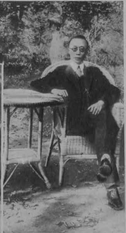
Pu-ji cesarz nowo-utworzonego państwa Mandżukuo. Wielkie uroczystości koronacyjne rozpoczną się 1-go marca.