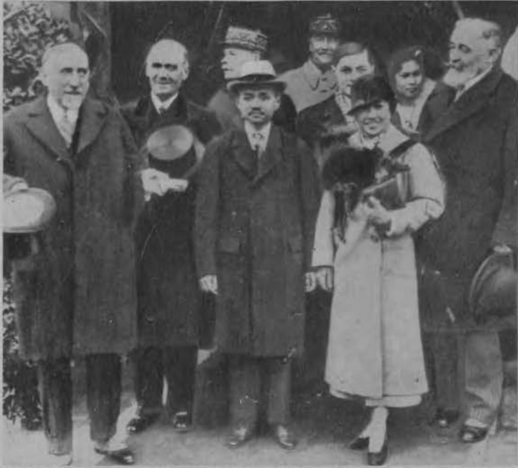
Do Marsylii przybył król Sjamu wraz z swą małżonką. Para królewska zabawi jakiś czas w Francji a następnie uda się w podróż po Europie.