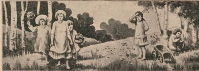
Rys. J. Beszkowski.