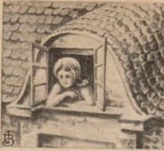
Okienko na strychu.