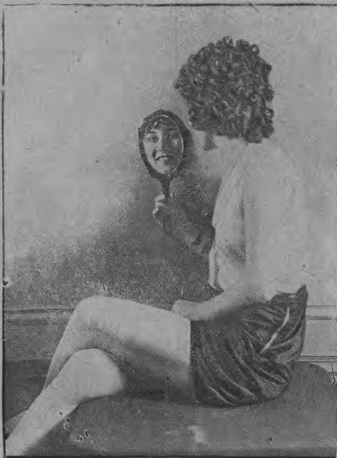
„Winne grona“ — to nowy rodzaj uczesania pięknej amerykanki.