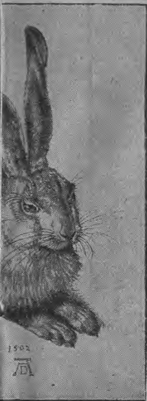
„Elkanocny“, namalowany Dürera w 1562 roku.