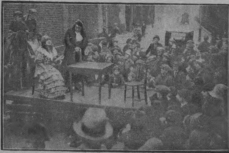
Uliczne przedstawienie teatralne na platformie zaprzężonej w konie.