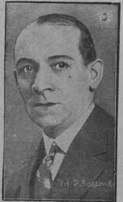
Znany aktor operetkowy Władysław Szczawiński obchodził jubileusz pracy scenicznej.