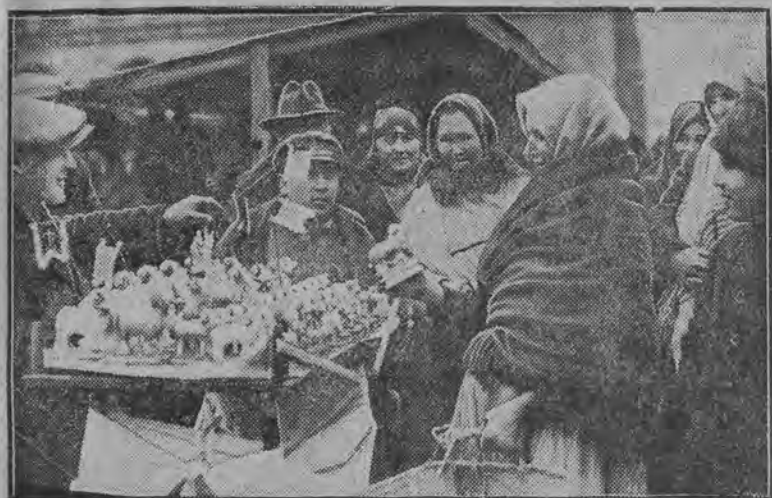
Słodkie baranki po słonych cenach były najbardziej pokupnym artykułem na targach publicznych.