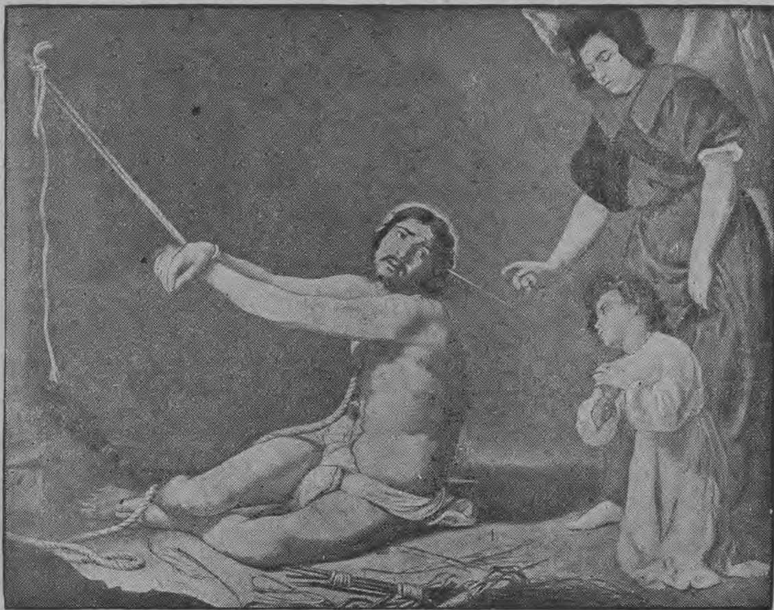
Obraz Velasqueza „Chrystus w kaźni“.