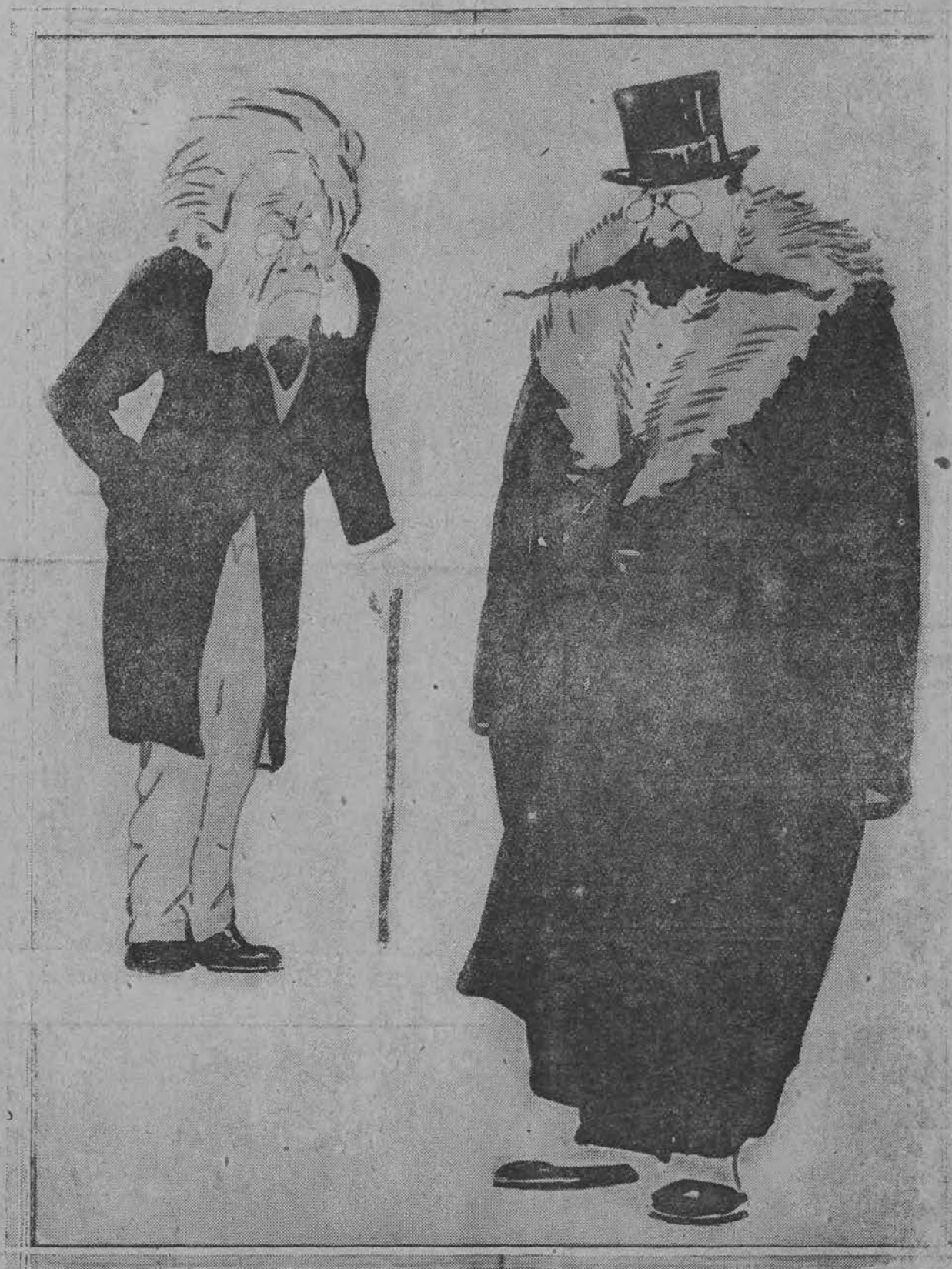
Karykatura warszawska, wyobrażająca oburzenie wielkiego dramaturga norweskiego na płytkość zainteresowań naszej stolicy.