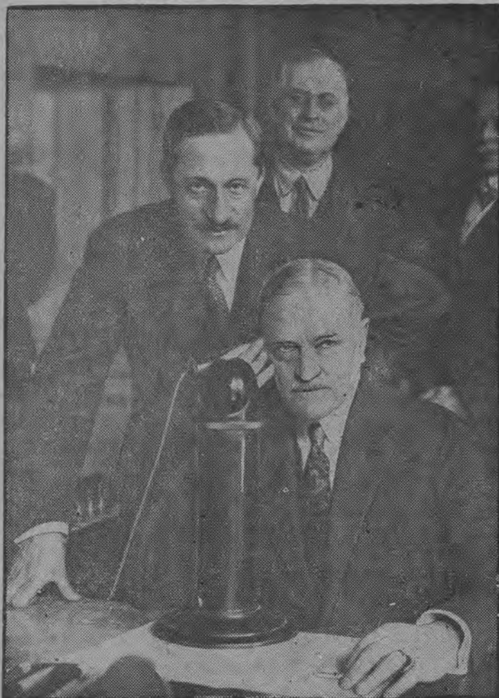
Gen. Pershing i min. Bokanowski przy telefonie Paryż — Nowy Jork.