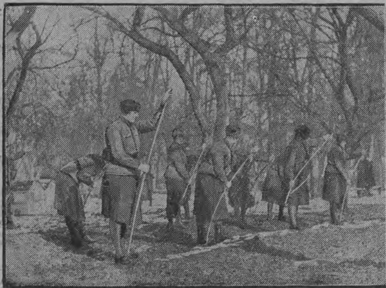
Sport tuczniczy stał się modny i zyskuje coraz nowe zastępy zwolenniczek.