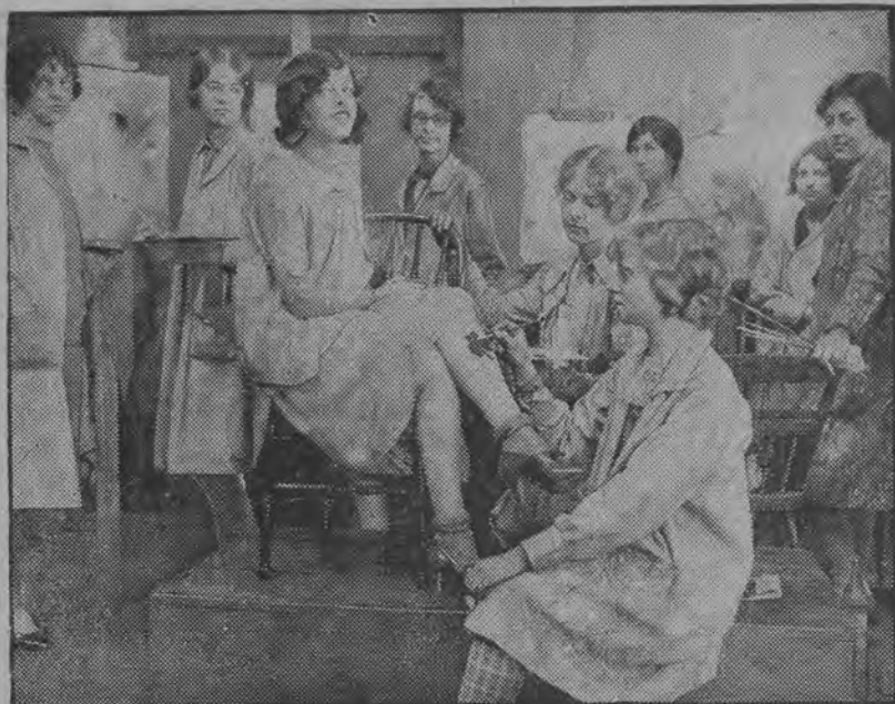
Malowanie na nóżkach kobiecych różnych „maskot“, które przeglądając dyskretnie przez cienkie pończuszki nają „elektryzować“ pleć brzydką