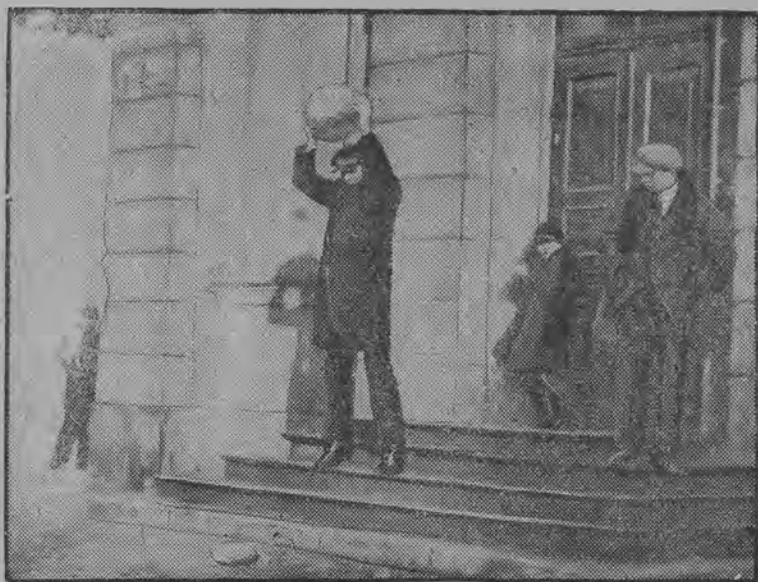
Jedna z „dzikich baterji“ które przez trzy dni świąteczne „ostrzeliwały“ stolicę hukami i trzaskami, niczem w dniach ubiegłej wojny.