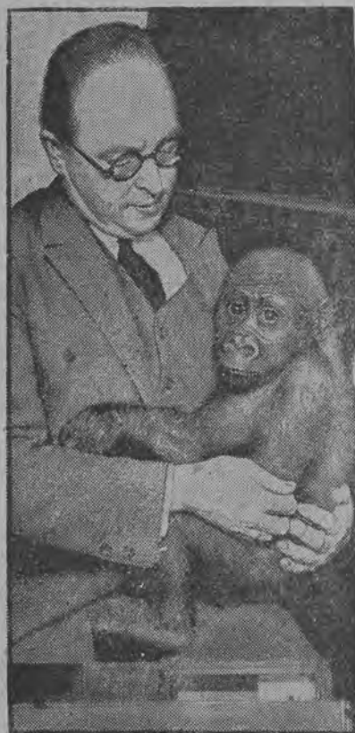
Ostatnio na Zachodzie rozwinął się handel młodemi małpkami, z którymi tamtejsze modnisie wychodzą na spacer.