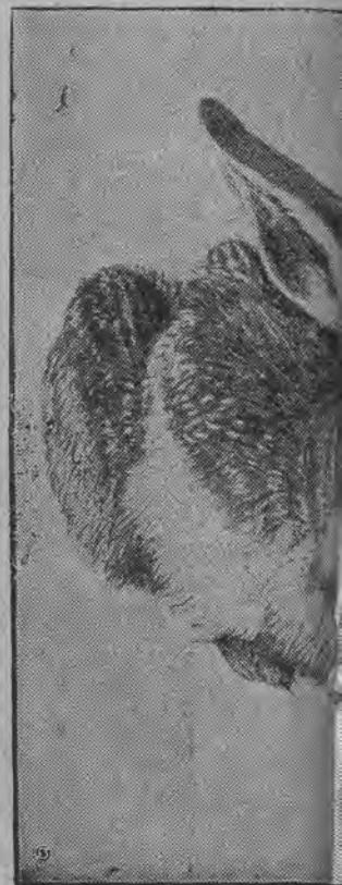
Obraz p. t. „Zając w kłębie“ akwarelą przez mistrza