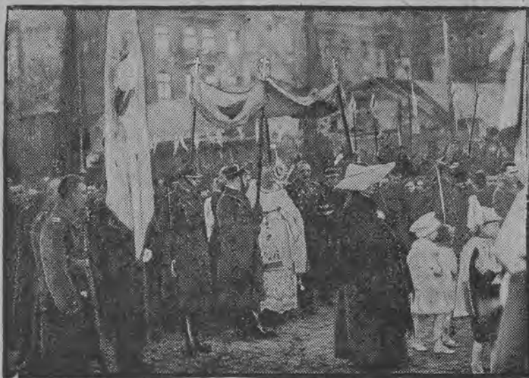
Procesja rezurekcyjna obchodzi Plac Krasińskich, zajęty przez reprezentacyjne oddziały pułków załogi warszawskiej.