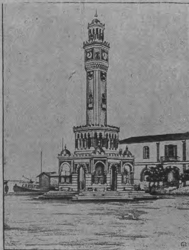
„Oko Małej Azji” nawiedziło dwukrotnie potężne trzęsienie ziemi. Wspaniała wieża zegarowa rozsypała się w proch.