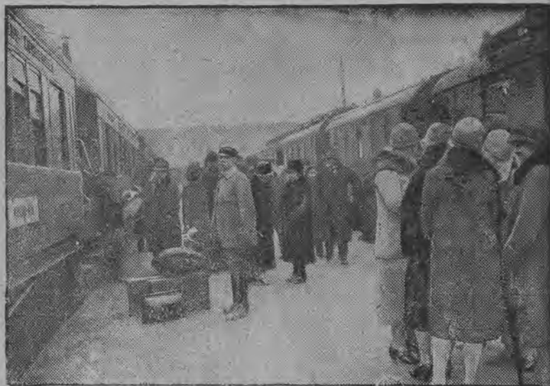
Wzmożony ruch na dworcu głównym w Warszawie w dnia przedświątecznych.