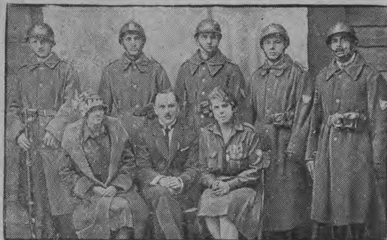
Delegatki i delegaci Zw. Strzeleckiego z obwodu Horochowe