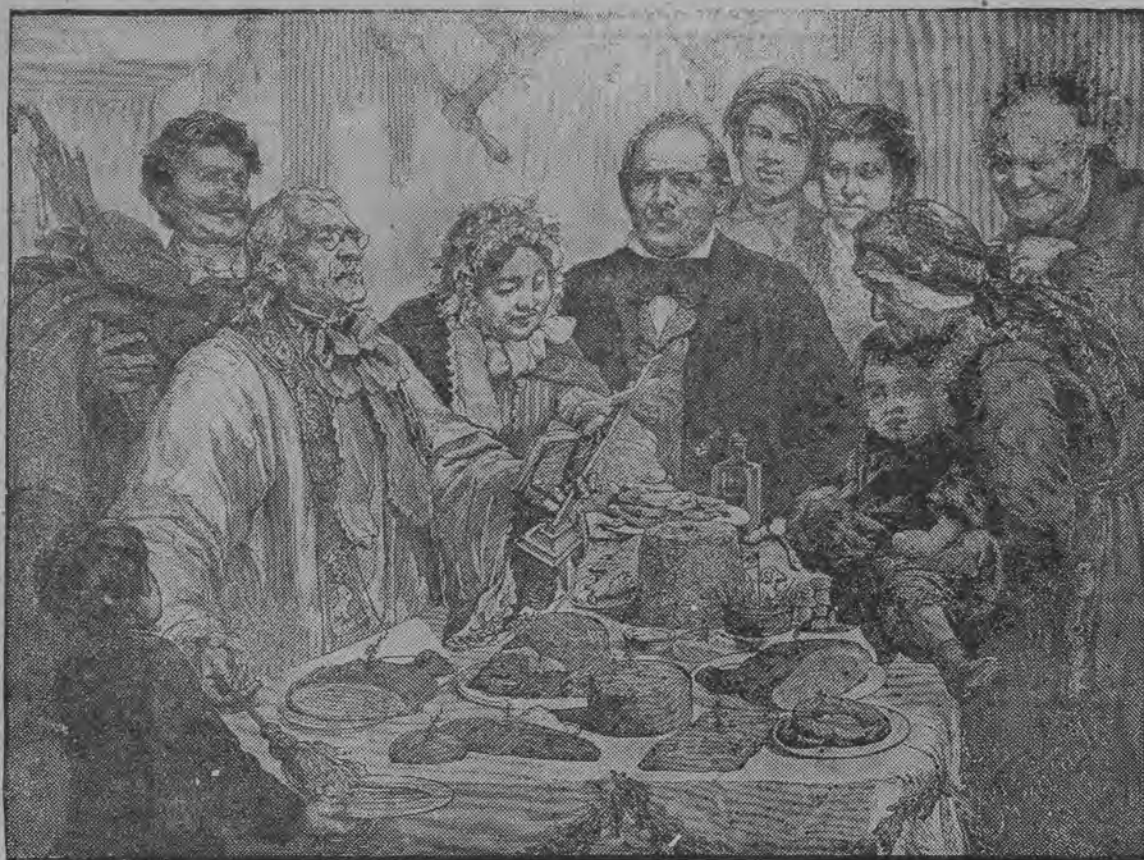
„Święcone“ — rysunek malarza polskiego życia obyczajowego Fr. Andriollego.