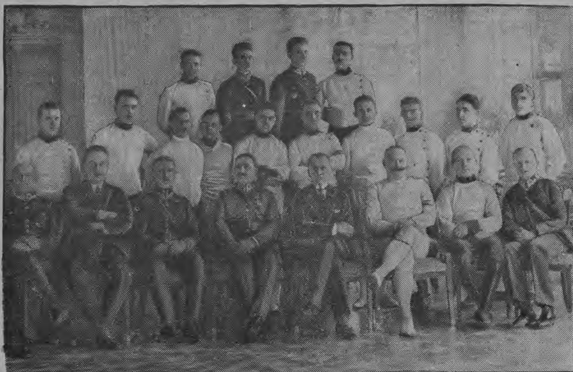
Uczestnicy wielkiej akademii szermierczej w stolicy.