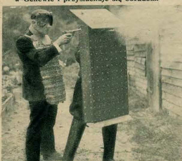
Nowy pancerz ochronny dla policji, wstrzymujący kule nawet najsilniejszych rewolwerów. Pancerze takie przydałyby się naszej policji kresowej, która stacza ciągle walki z bandytami.