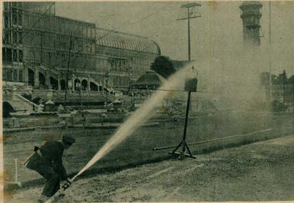
Strażackie ćwiczenia zręczności. W straży londyńskiej odbyły się zawody, w których między innymi trzeba było przez małe kółko przepuścić silny strumień wody z sikawki.