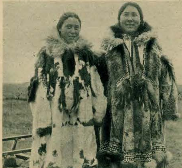
Dwie eskimoskie piękności z północnych wybrzeży Alaski. Zwrócić należy uwagę na artystyczne zdobienie płaszczy futrzanych kolorowymi skrawkami skóry i futra.