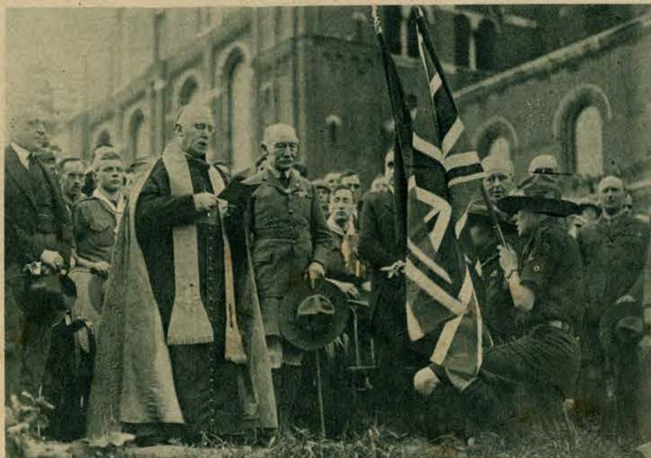
Skauci angielscy u papieża. Na zdjęciu widoczny sir Robert Baden Powell, twórca scoutingu i dowódca skautów całego świata.