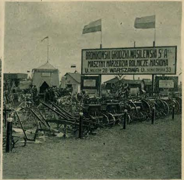
Obrazy z V. Targów Wschodnich we Lwowie. 1) Balon obserwacyjny, którym za opłatą może wzlatywać publiczność, zwiedzająca Targi. 2) Pawilon „Pacyków” mieszczący wyroby fajansowe i porcelanowe. 3) Oddział maszyn rolniczych.