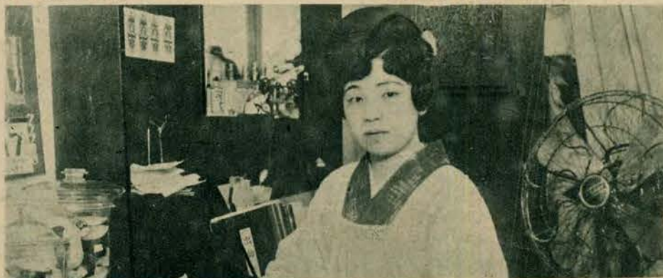
Modna teraz na zachodzie sztuka pielęgnowania piękności, ma w Japonii już tysiącletnią tradycję i doszła tam do wyrafinowanej doskonałości. Obraz nasz przedstawia właścicielkę takiego zakładu w Tokio.