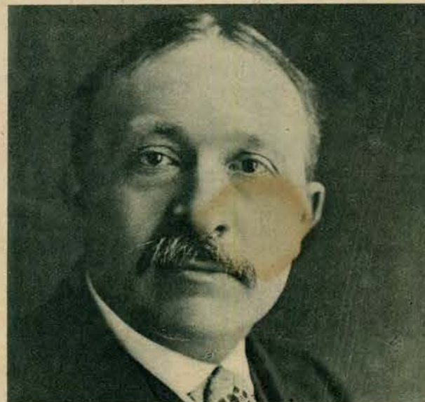
Śp. M. René Viviani. Znakomity francuski polityk i dyplomata, jeden z najwybitniejszych mowców doby współczesnej.