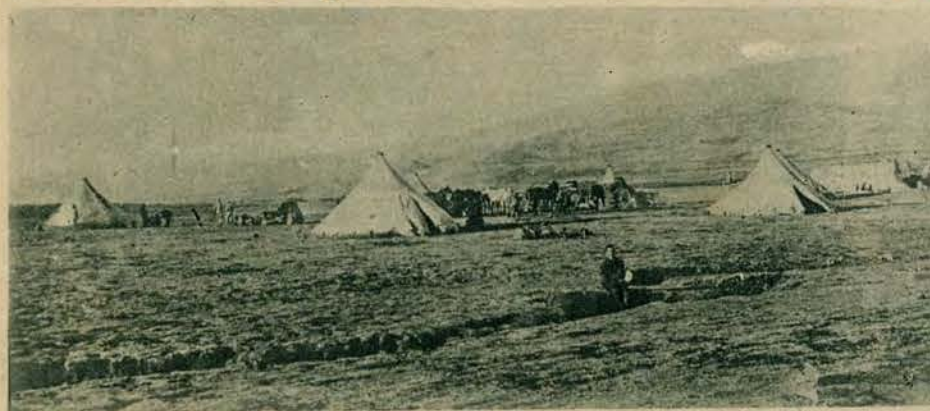
Z walk Francuzów z Druzami w Syrii. Typowy obóz obronny francuski, obwarowany szańcami.