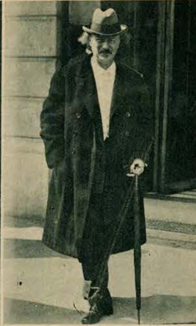
W Genewie odbywa się obecnie plenarne zebranie Ligi Narodów. Na pierwszym zdjęciu widzimy grupę dziennikarzy polskich i min. Skrzyńskiego, podczas przemówienia delegata rumuńskiego. Na drugim widzimy francuskiego prez. min. Painlevé'go, który zażądał pierwsze posiedzenie. Również Paderewski bawi w Genewie i przysłuchuje się obradom.