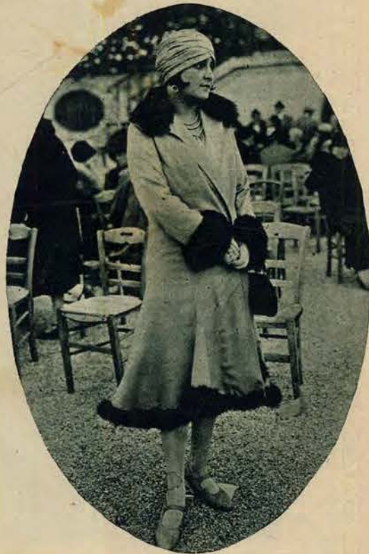
Na wyścigach konnych w Longchamp pod Paryżem ukazały się pierwsze toalety zimowe, lansowane przez firmy paryskie. Toalety te, jak widzimy, różnią się bardzo od zeszłorocznych.