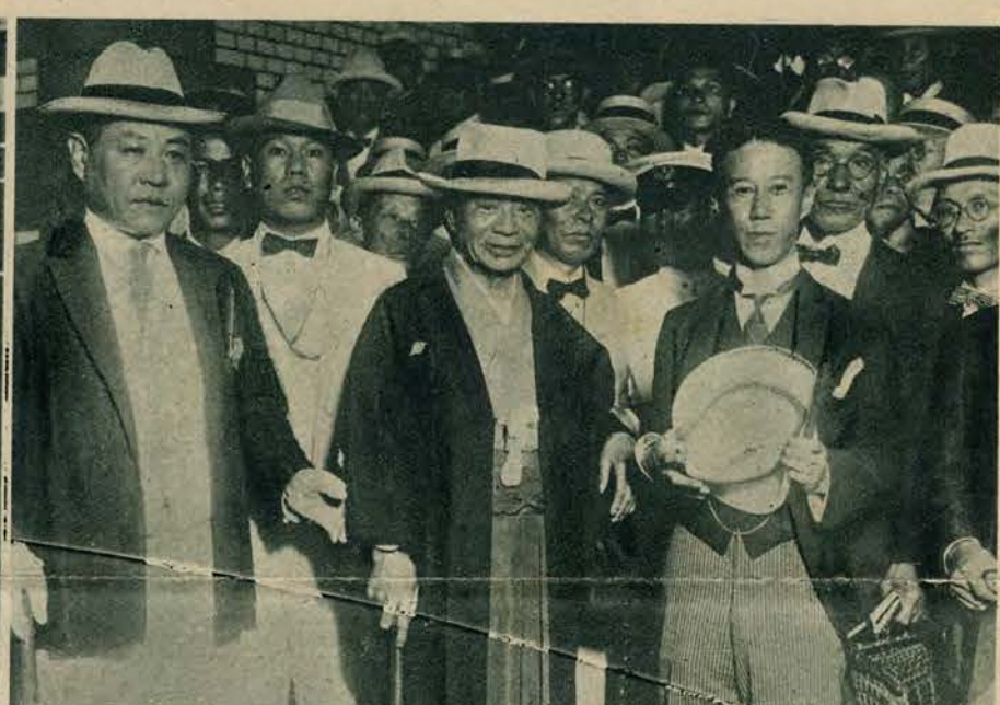
Obrazki z Japonji: 1) Dancng w hotelu Kaihin w Kamakura, w którym biorą udział także członkowie kolonij zagranicznych. — 2) Baron Okura, o którym mówią, że jest nie tylko najbogatszym człowiekiem w Japonji ale i na świecie. Podobno majątek takiego Rockfeller'a, nie stoi w żadnym stosunku do jego. Baron Okura, liczący 89 lat, jest nie tylko panem całego majątku, ale także absolutnym „pater familias“, rozstrzygającym bezapelacyjnie wszystkie sprawy rodzinne, według obowiązujących w Japonji zwyczajów patriarcalnych.