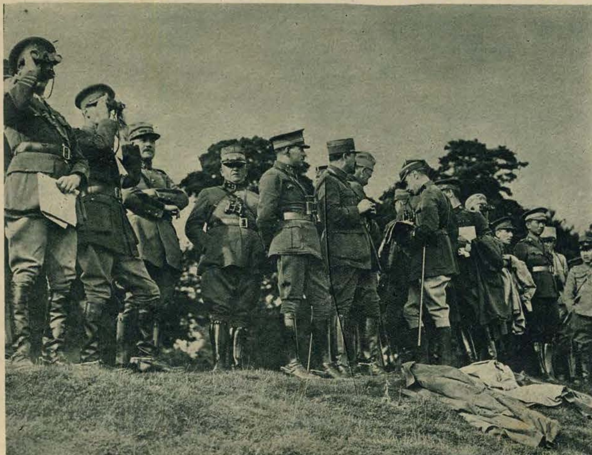
W Anglii odbyły się teraz wielkie manewry wojskowe. Między innymi odbyła się bitwa powietrzna, w której wzięło udział 50.000 ludzi. Zdjęcie nasze przedstawia grupę oficerów zagranicznych, obserwujących ćwiczenia. W środku widać oficera polskiego.