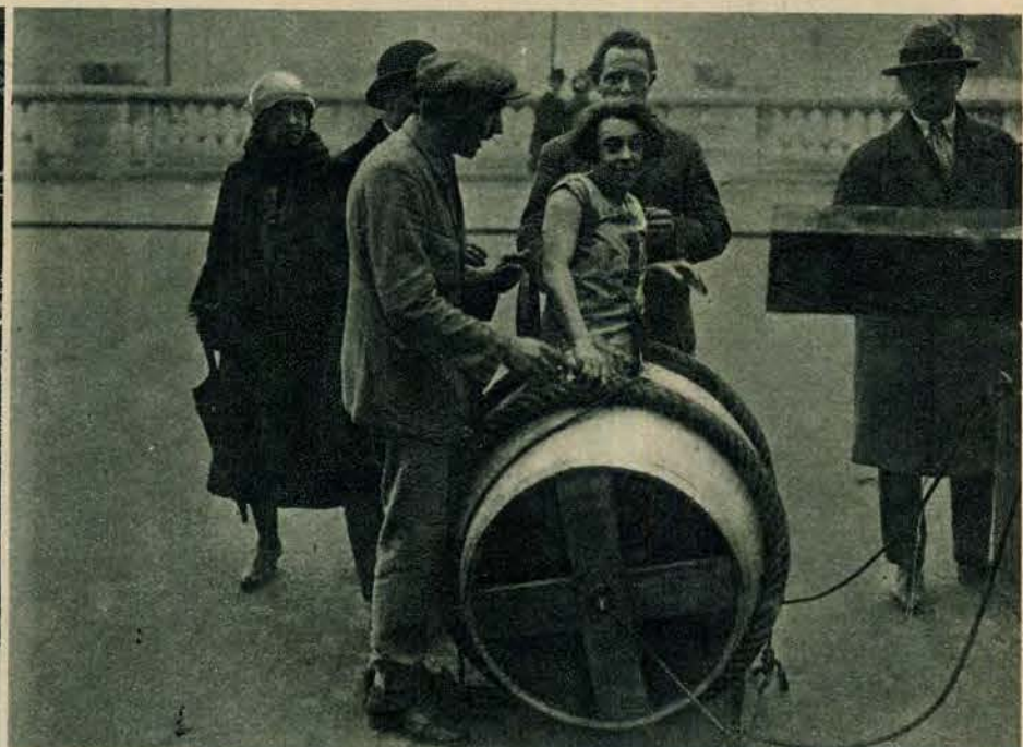
1) Małopolski Klub Motocyklowy we Lwowie, nowo zorganizowany w dniu 23 września b. r. Moment przed wycieczką do Janowa. — 2) Warjacki zakład. Pewna żądna sławy paryżanka, założyła się, że stoczy się w beczce ze schodów Montmartre. Ponieważ jednak policja sprzeciwiła się tego rodzaju wybrykom, dała się ona ciągnąć w beczce naokoło placu Concordia.