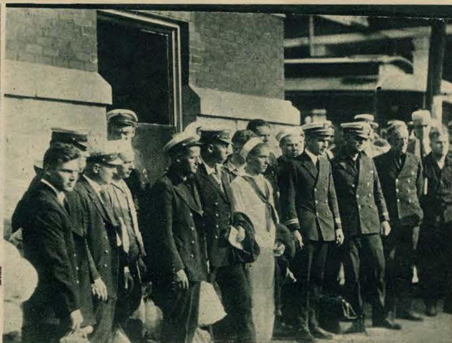
1) Przyjazd do Warszawy min. spraw zagr. Bolszewji, Cziczierina. Obok poseł sowiecki w Warszawie, Wojkow. — 2) Pozostali przy życiu członkowie załogi okrętu powietrznego Shenandoah.