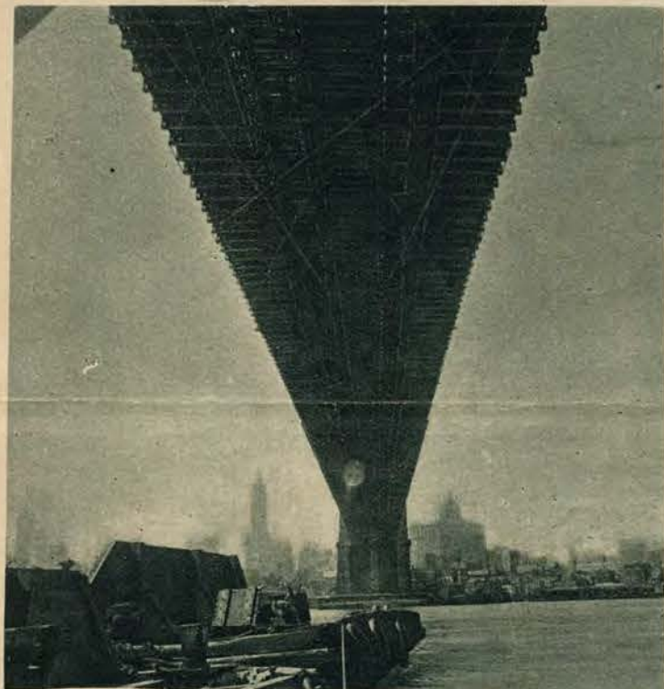
Słynny most brooklyński w Now. Jorku, widziany z łodzi przepływającej pod nim.