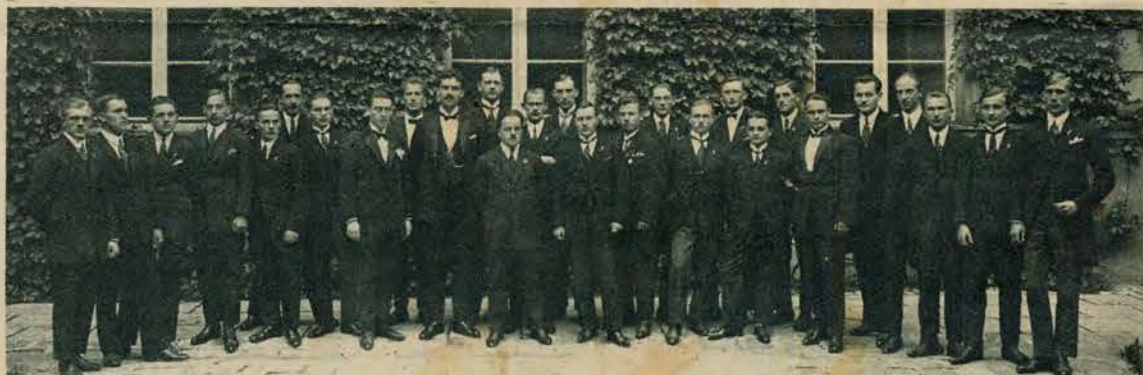
Krakowski Chór Akademicki odniósł w Bukareszcie niebywały sukces.