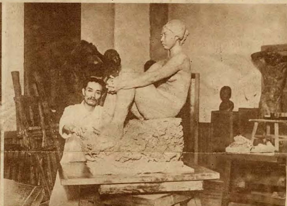
1) W Berlinie urządzono obecnie wystawę konkursową urządzeń ogrodowych. Obraz nasz przedstawia jeden z nagrodzonych fragmentów tej wystawy. — 2) Ze współczesnej sztuki japońskiej. Jeden z najwybitniejszych rzeźbiarzy japońskich Daimu w swej pracowni, obok dzieła „Marząca dziewczę”.