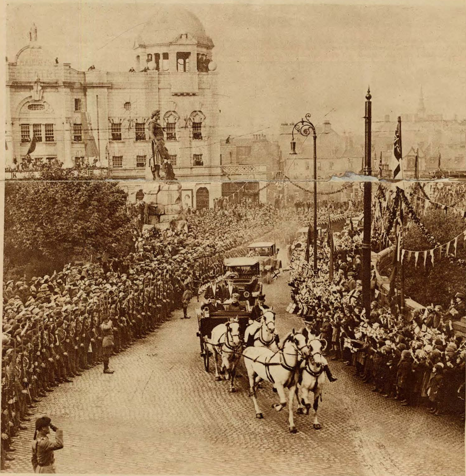
Król angielski Jerzy V. wraz z małżonką przyjechali do Aberdeen, gdzie wzięli udział w otwarciu miejskiej Galerji Sztuki. Królewska para była entuzjastycznie przyjmowana. Zdjęcie nasze przedstawia wspaniały moment z tej uroczystości. Na lewo widoczna fasada teatru „His Majestys“.