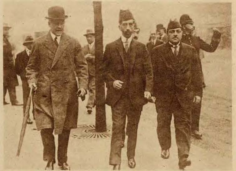
Król Iraku, Feisal, który jest pionkiem w rękach Anglików, zwiedza obecnie Europę.