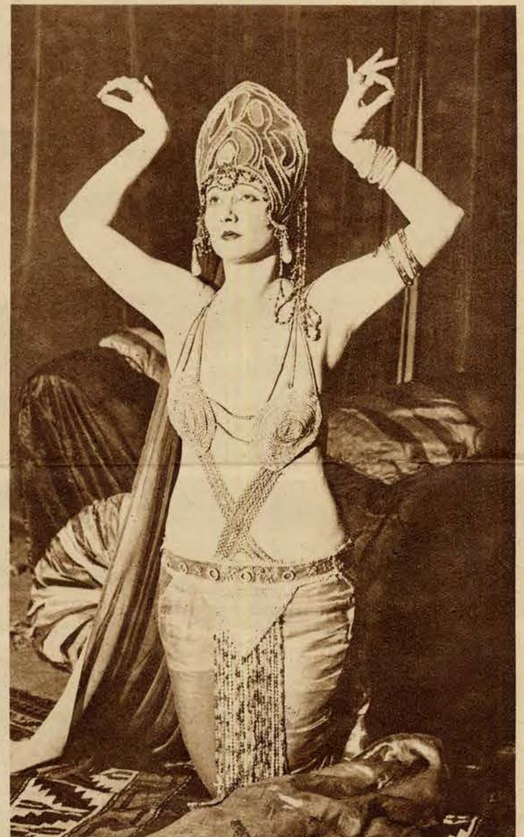
Słynna artystka filmowa Betty Blythe, znana w Polsce z filmów „Królowa Saba” i „O czem marzą kobiety”, bawi obecnie w Londynie, gdzie kreować będzie główną rolę w filmie „Chu Chin Chow”.