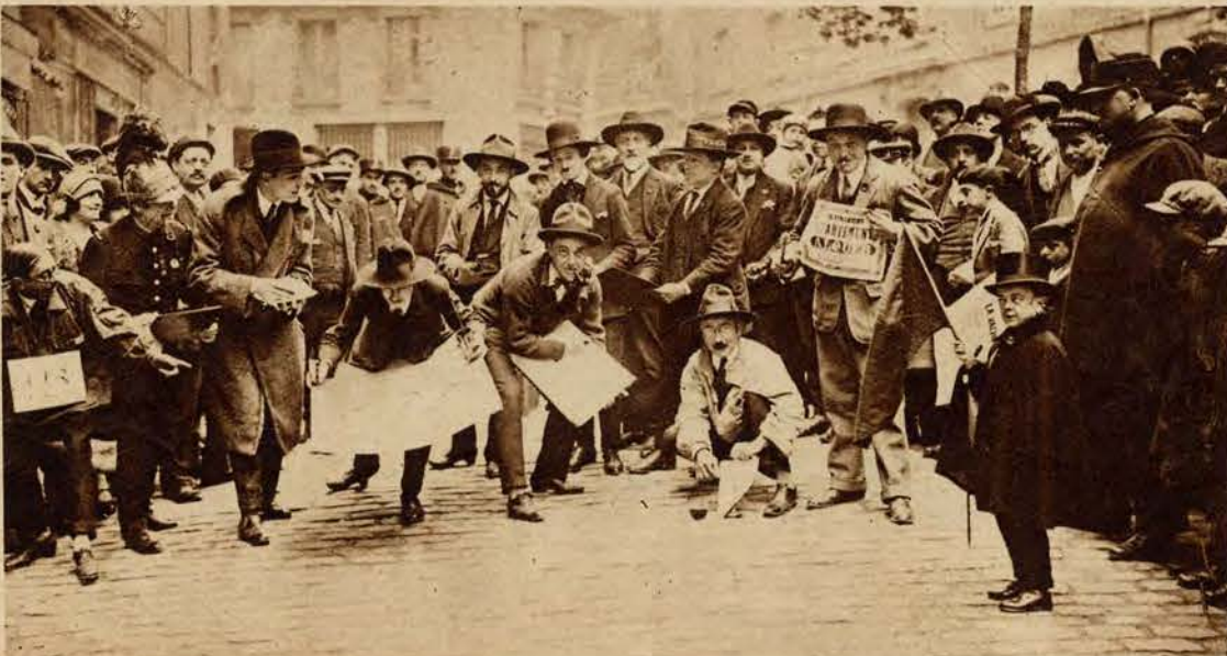
Święto artystów na Montmartre. Oryginalne zawody sportowe. W zawodach biorą udział malarze, poeci i pisarze, którzy mają przebiegnąć pewną przestrzeń i w międzyczasie wymalować obraz, względnie napisać jakiś utwór. Zwycięzcą zostaje twórca najlepszego dzieła, o ile przyszedł pierwszy do mety.