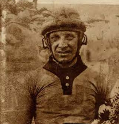
1) W Paryżu odbył się wyścig dzieci na prawdziwych małych samochodach, poruszanych motorem. — 2) Belg Vanderstuyft ustanowił nowy światowy rekord szybkości na rowerze w nieprawdopodobnym czasie 115 klm. na godzinę