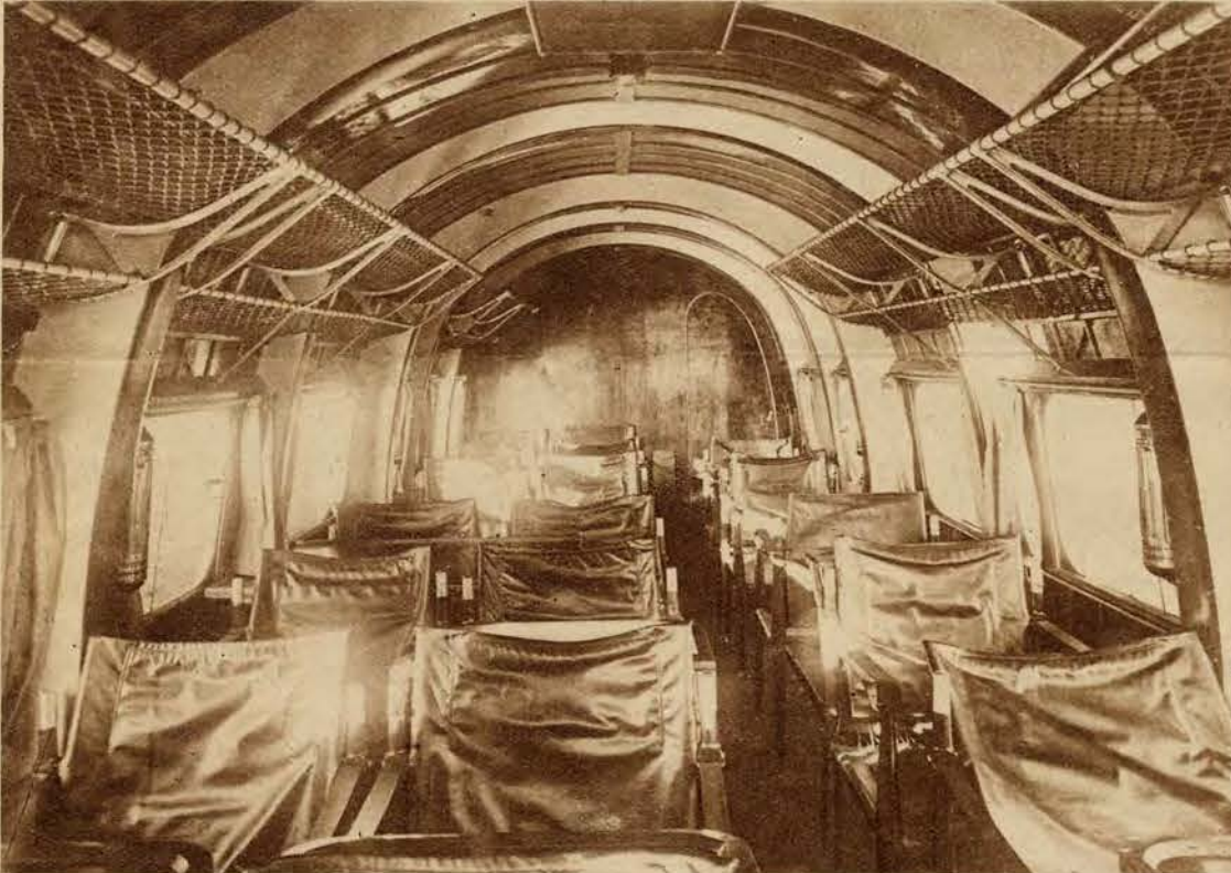
Wnętrze luksusowej kabiny w samolocie pasażerskim, kursującym między Londynem i Paryżem. Kabina mieści 22 osób i zawiera także bufet. Ruch lotniczy na tej linii popularyzuje się tak, że zaczyna go już odczuwać dotkliwie ruch morski.