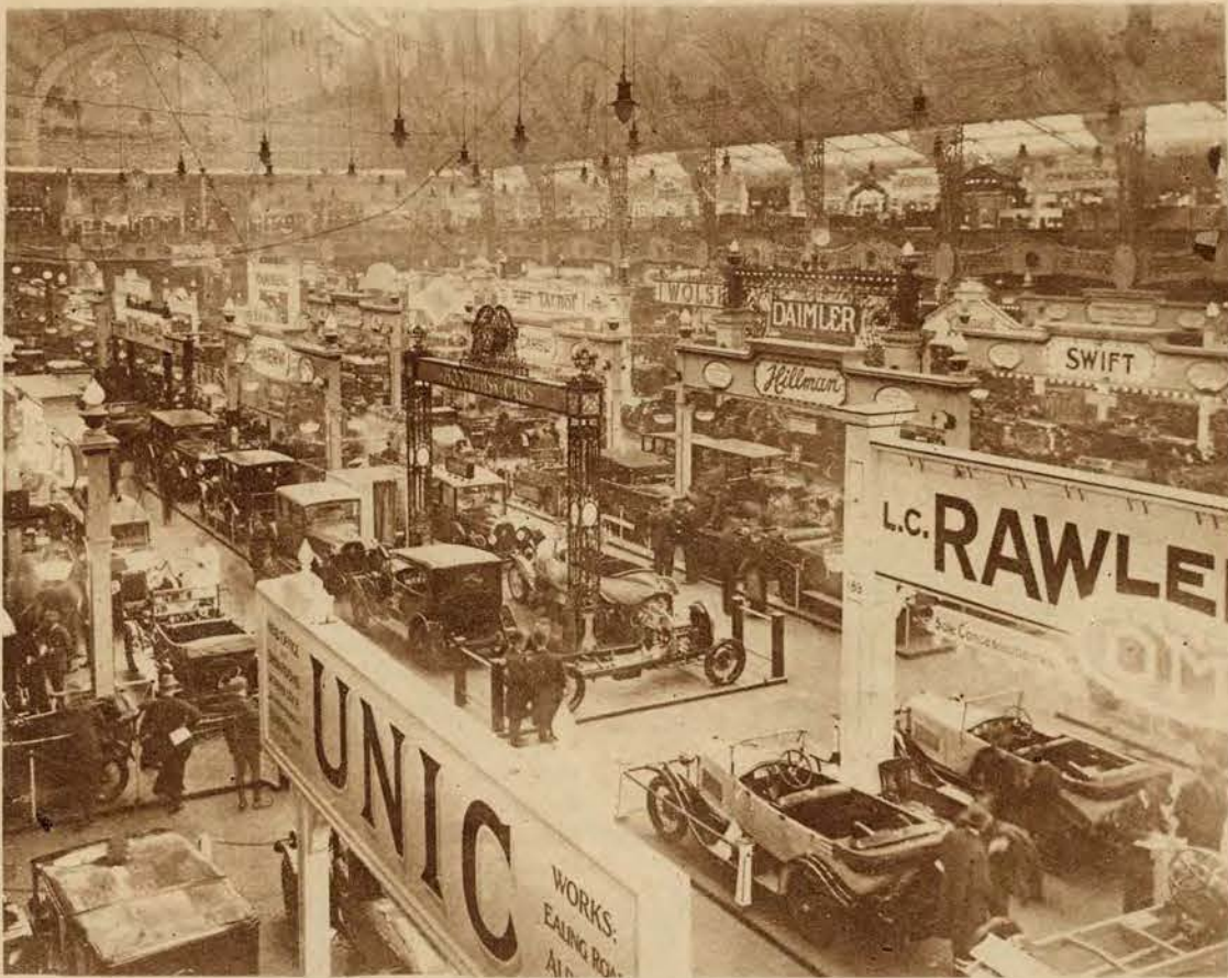
Dnia 1-go października otworzono w Londynie 19-tą międzynarodową wystawę samochodów i motorów. Zdjęcie nasze przedstawia widok ogólny na główną halę wystawową w Olympia Hall.