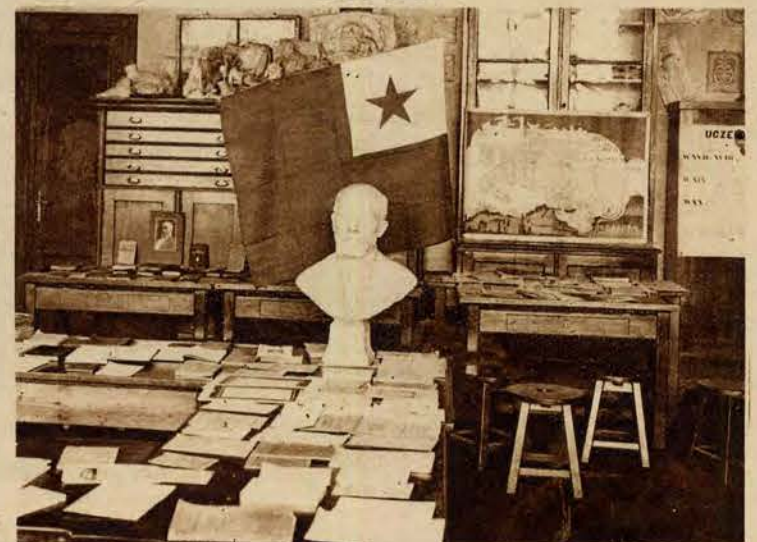
W krakowskim muzeum przemysłowym otwarto wystawę esperancką. Na wystawie odbywają się próbne lekcje, mające zobrazować łatwość tego języka.